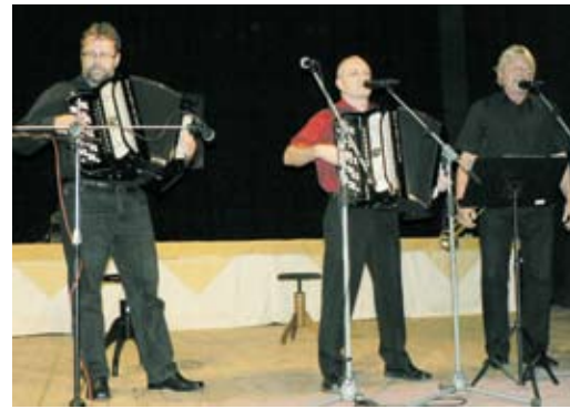
Město Jevíčko a Základní umělecká škola Jevíčko Váš srdečně zvou na 7. SETKÁNÍ HARMONIKÁŘŮ MALO- HANÁCKÉ HARMONIKÁŘ v sobotu 17. října 2015 od 14 hodin v sále hotelu Morava. Hostem programu je Franta Uher, oblíbený zpěvák a bavič TV Šlágr.