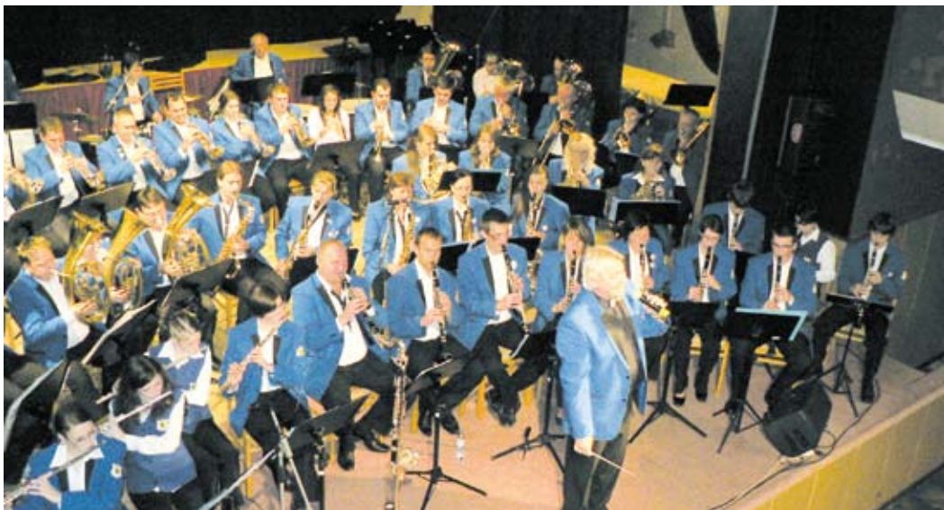
12. ročník Festivalu mládežnických dechových orchestrů v Jevíčku proběhne v neděli 15. listopadu 2015 od 14:00 hodin v sále Hotelu Morava v Jevíčku. Bohatý hudební program, svatomartinská vína, speciality.

Jevíčko může nabídnout příjemnou procházku po městském památkovém okruhu, poskytne dobrou kuchyni v mnoha restauracích a v neposlední řadě je městem s kulturním srdcem. V průběhu celého roku je možné v Jevíčku navštívit množství kulturních, sportovních a jinak zaměřených akcí. Město Jevíčko je příjemným místem pro Vaši návštěvu v každém ročním období s atraktivní nabídkou historie, kultury, sportu a dalších oblastí vyžití. K ubytování můžete využít dostatečnou nabídku místních hotelů a ubytovacích zařízení. Aktuální informace o městě a dostupných aktivitách Vám podá Turistické informační centrum na Pa- lackého náměstí v Jevíčku a webové stránky města www.jevicko.cz .