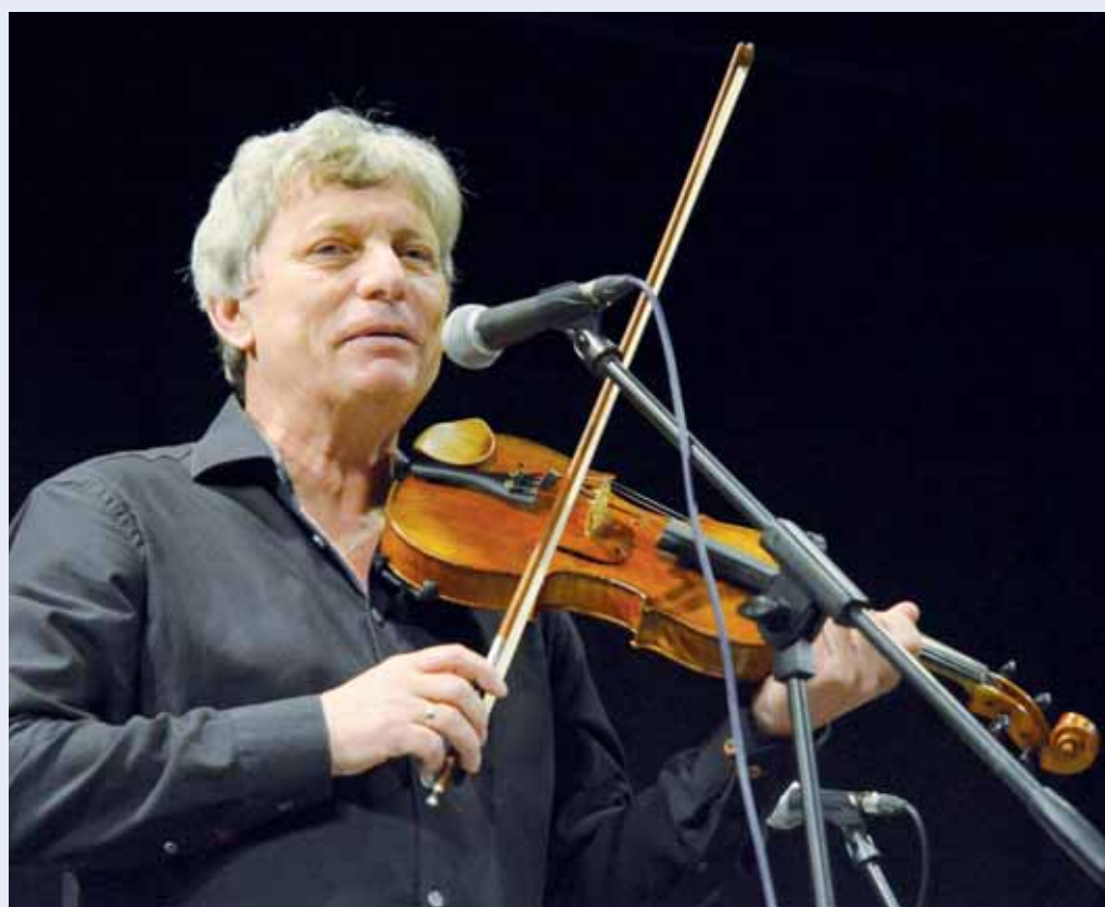
VÁNOČNÍ KONCERT. Čtyři sta posluchačů si uplynulý pátek v boskovické sokolovně vychutnalo vánoční koncert v podání Jiřího Pavlici a Hradišťanu.