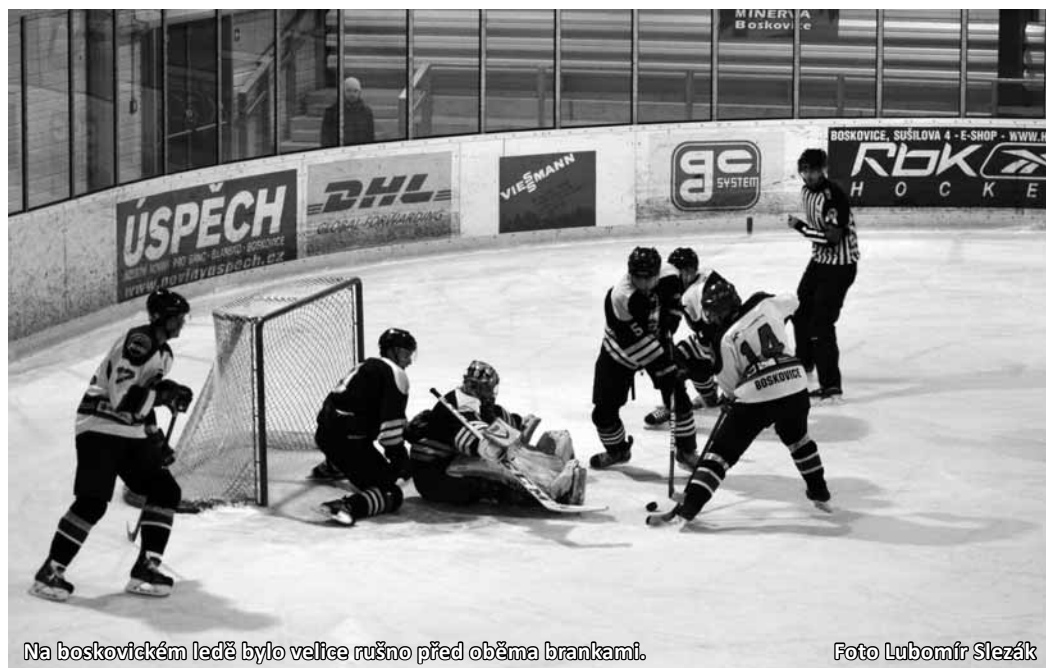
Na boskovickém ledě bylo velice rušno před oběma brankami.