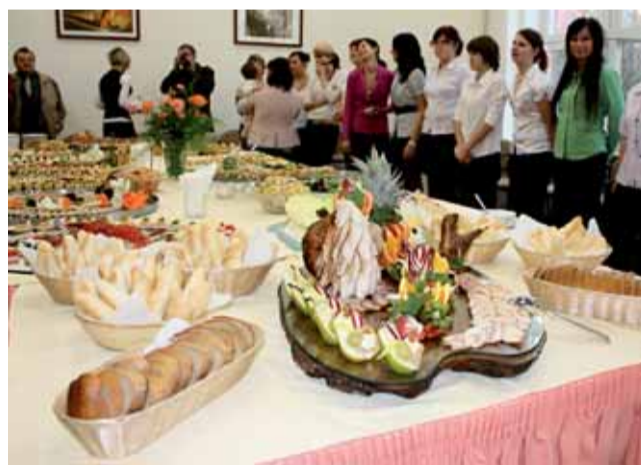
Raut. Vývrcholením kurzu studené kuchyně byl slavnostní raut.

„Přijel jsem do Boskovic již podruhé. Už minule se tady sešla bezvadná parta lidí, která kurz dobře zvládla. Letos tomu nebylo jinak. Opět jsem poznal výborné studenty a práce s nimi