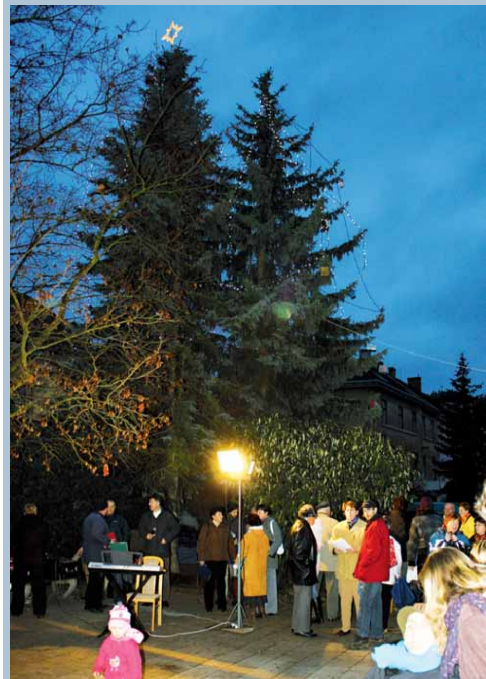
Tradice. V řadě měst a obcí našeho okresu rozsvítili o víkend vánoční stromy. Nejinak tomu bylo i v Letovicích, kde se lidé sešli na Masarykově náměstí.