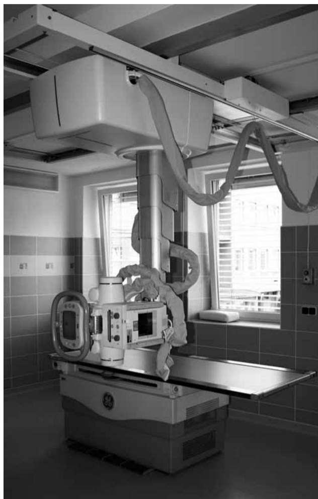
Digitální. Radiodiagnostické oddělení boskovické nemocnice se rozloučilo s chemií a klasickými snímky.

V rámci dokončení kompletní digitalizace Radiodiagnostického oddělení byly vybudovány dvě nové vyšetřovny, které jsou vybaveny moderními digitálními přístroji. Byl