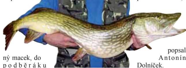
popsal Antonín Dolníček.

o půl třetí se ve vodě něco pohnulo. Myslel jsem, že je to vítr, ale začal jsem tahat a asi deset metrů od břehu jsem zjistil, že mám štika. Byl to pořádný macek, do