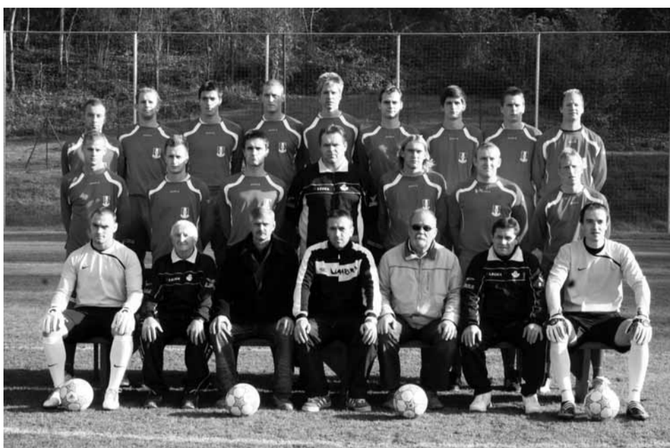
Nevydařený podzim. Blansko po sestupu z moravskoslezské ligy na podzim své příznivce nepřijemně překvapilo nevyrovnanými výkony.

V řadě příspěvků na webu klubu toho bylo řečeno hodně. Některé jsou až nevybíravé, s jinými však musím souhlasit. Stav sportoviště je špatný. Jed-