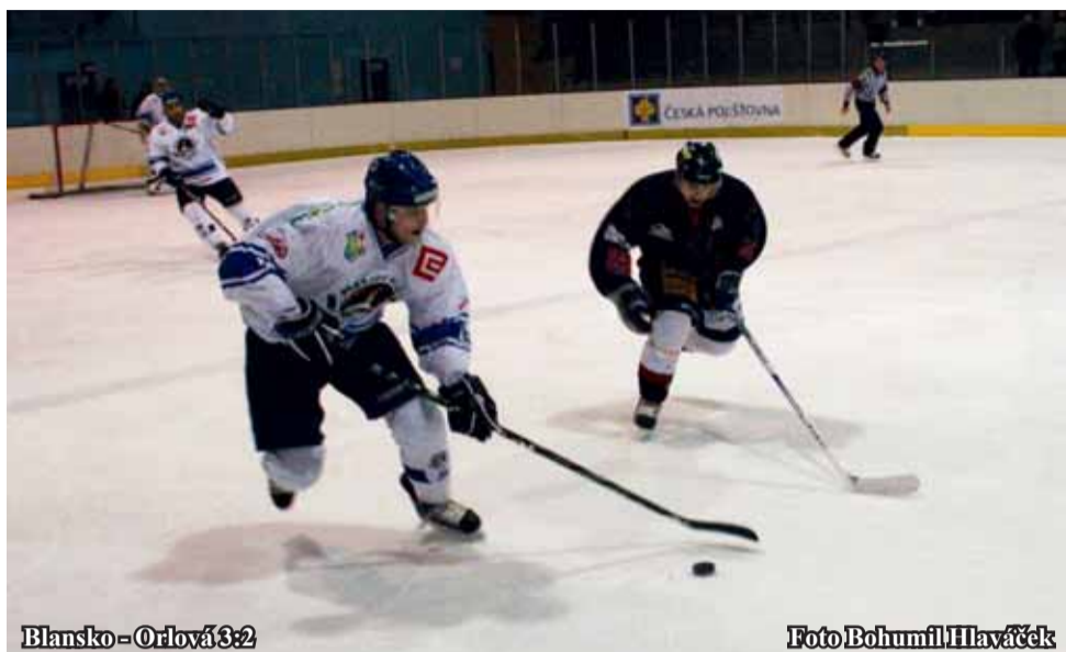
Blansko – Orlová 3:2

Již v první minutě se měnilo skóre ve prospěch hostů, po chybě obrany se trefil Stránský. Brzobohatý ale brzy srovnal. Zbytek třetiny se hrálo nahoru dolů bez výraznějších šancí. Ve dru-