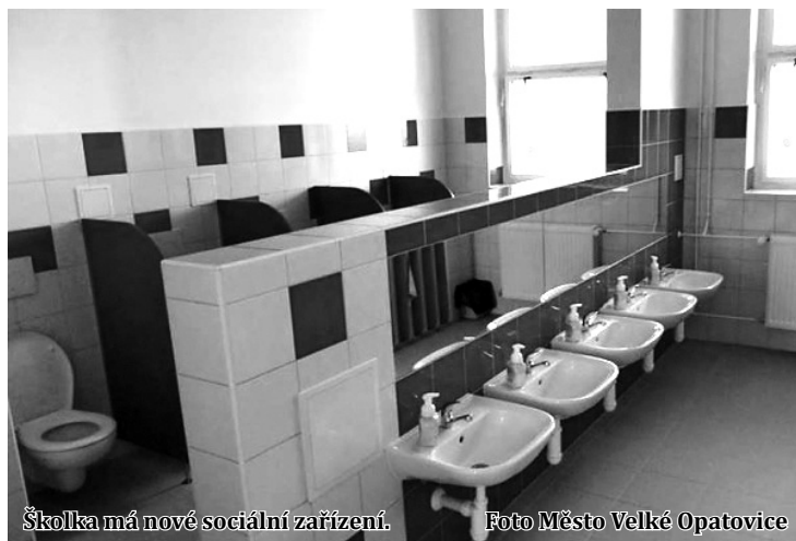
Školka má nové sociální zařízení.

Město zřizuje ještě jednu mateřinku. 1. Mateřská škola v Dlouhé ulici má kapacitu 72 dětí. (moj)