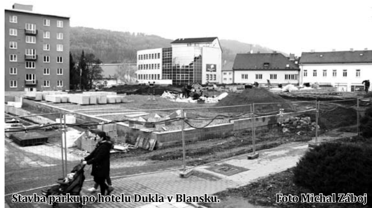
Stavba parku po hotelu Dukla v Blansku.

„Některé věci zůstanou na příštím rok, a to především schodiště ze západní části, které se z technických důvodů nestihlo a potom to už spíše budou drobnosti. Na jaře