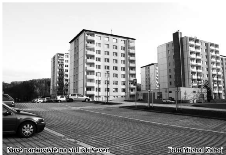
Nové parkoviště na sídlišti Sever.

„Původní asfaltový povrch nebo dlážděné chodníky tak byly díky navýšení prostředků z městské pokladny vyměněny za kvalitní zámkovou dlažbu. Stejně tak původní asfaltový povrch na parkovišti byl nahrazen dlažbou s průsakem, odpočinková zóna, kterou mohou lidé využívat mezi bytovými domy na ulici Dvorské, je opatřena kvalitní dopadovou plochou z lité pryže. V současné době je na tomto sídlišti 99 parkovacích míst, z nichž čtyřicet je nových,“ uvedl na městském webu starosta Blanska Ivo Polák (ČSSD).