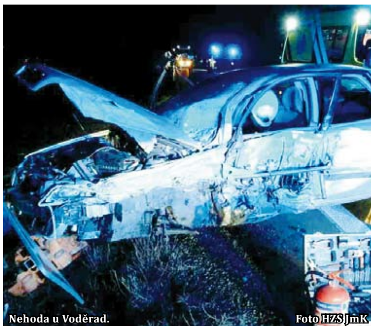
Nehoda u Voděrad.