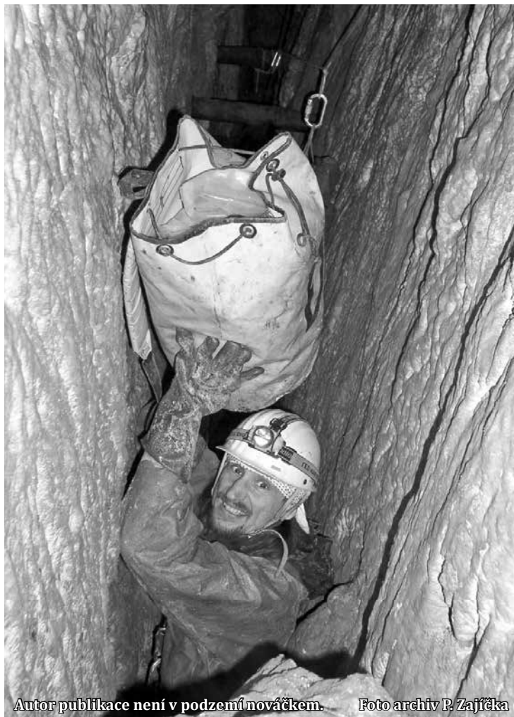
Autor publikace není v podzemí nováčkem.

Mojí snahou bylo přiblížit kras čtenáři, a to z pohledu všech vědních disciplín. Chtěl jsem, aby byla poutavá, a aby byla i ta nejobornější tématu podána co nejsrozumitelnější formou. Kniha má nejen doplňovat informace, tedy vzdělávat, ale i bavit. Nejtěžší byla práce na geologické části. Přiblížit geologický vývoj krasu tak, aby to bylo pro čtenáře srozumitelné a netrápilo se s vědeckými termíny, bylo opravdu náročné. Publikace začíná geologickým vývojem, postupně přechází k