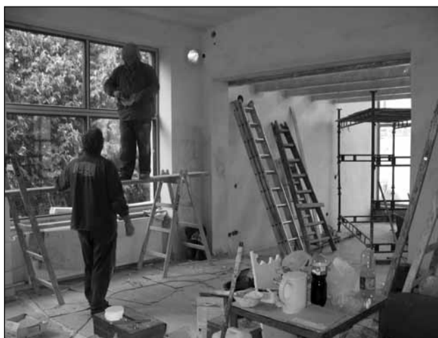
Stavba. Dělníci finišují na přípravách nových prostor.

„Úprava spočívá v tom, že vlastní prodejní plochy, kde lze v současné době vystavit tři automobily, budou rozšířeny o více než sto metrů čtverečních, což umožní vystavení sedmi modelů. Tím splníme požadavky zastoupení Citroënu v České republice pro autori-