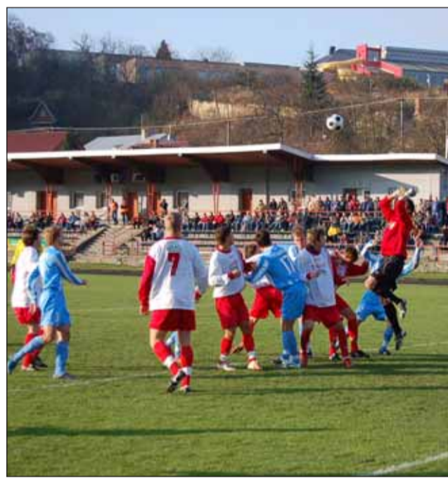
Tři body. Boskovice se rozloučily s podzimem v divizi nečekanou výhrou se Šardicemi.