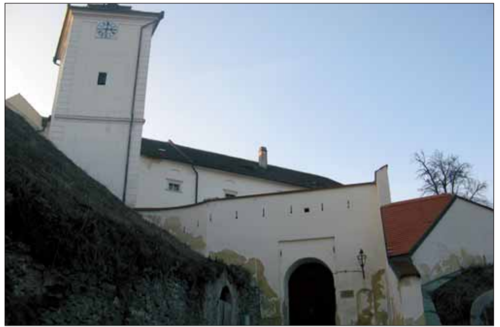
Zámek. Archiv pravděpodobně ve spodním zámku vystřídá depozitář památkářů.

O tom, že se prostory uvolní, se mluvilo už tehdy, když začal Moravský zemský archiv stavět svůj centrální depozitář v Brně.