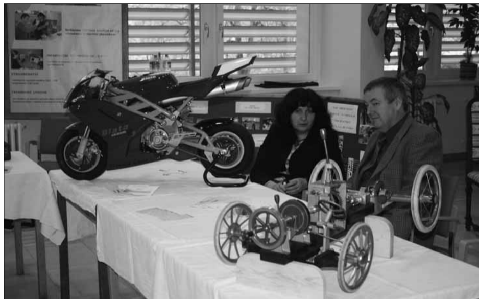
Přehlídka. Nabídky svých studijních a učebních oborů představily střední školy a učiliště z našeho regionu na tradiční podzimní burze, která se konala v blanenském Dělnickém domě. Nechyběli ani zástupci škol z Prostějova, Kroměříže, Brna a blízkého okolí.