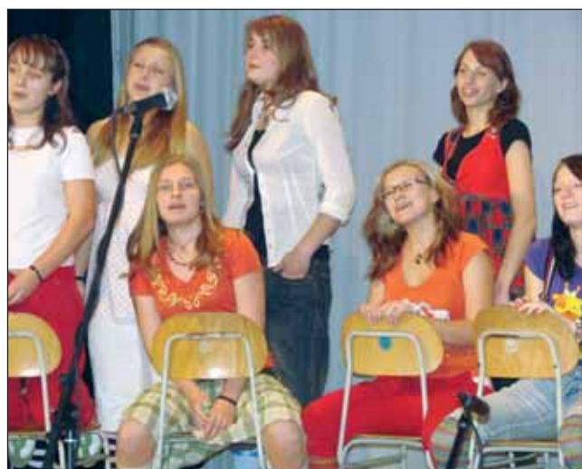
Zahájení. Slavnostní zahájení Pedagogické Poemy se neslo v duchu připomínání její čtyřicetileté historie.

„Soutěž vznikla v roce 1967 na Střední pedagogické škole v Kroměříži, kde pracoval profesor českého jazyka Ol-