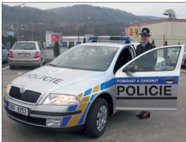
Nové vozy. Blanenská policejní mluvčí Iva Šebková ukazuje jeden z nových vozů Škoda Octavia.

„V našem okrese budou mít policisté k dispozici jednu Škodu Octavii 1.8 T v benzi-