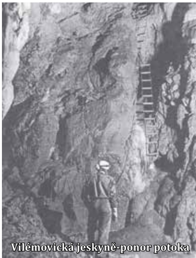
Vilémovická jeskyně-ponor potoka

Před závěrečným slovem ještě zmínka o speleologickém výzkumu v obci. Vše započalo, až když jsem žil v jiné krasové obci, a to v Holštejně. Speleologický kroužek při ZK ROH n.p. Metra Blansko objevil v roce 1968 podzemní prostory v blízkosti již vpředu zmíněného Vilémovického propadání.