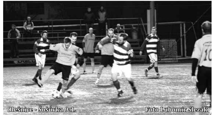
Olešnice - Šošůvka 9:1.