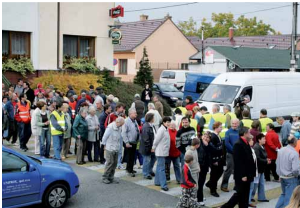
Protest. V loňském roce se konala akce, při které lidé zablokovali silnici I/43 v Lipůvce. Chtěli tak upozornit na neustálé průtahy kolem výstavby silnice R43.

Zástupci svazku ministra Mika upozornili také na neopodstatněné protahování přípravy stavby rychlostní komunikace. A požádali ho o prověření transparentnosti právních kroků, které v minulosti Ministerstvo životního prostředí udělalo. V podstatě jde o to, že za