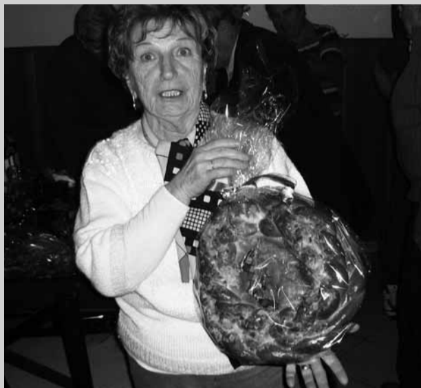
Nejlepší. V turnaji bojovalo také sedm žen.