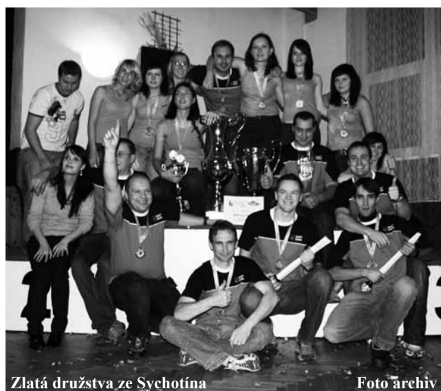
Zlatá družstva ze Sychotína

Oficiální část programu s vyhlášením nejlepších týmů byla prokládána videoprezentacími družstev. Doplňkovou částí bylo poděkování rozhodčím, kteří pracovali na soutěžích, a jejich odměnění symbolickými dárky. Novinkou bylo vyhodnocení motivační soutěže pro redaktory VC. Hodnotily se kategorie