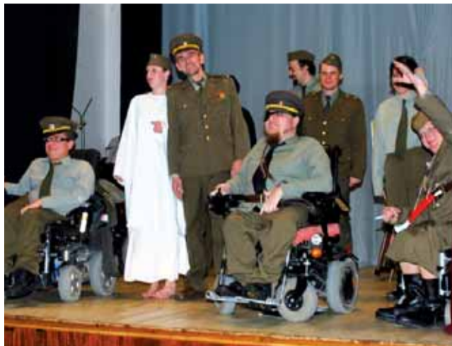
Představení. Divadelní spolek Járy Pokojského předvedl v Rudici hru Mlýny.

To byla velká náhoda. Můj kamarád se mne kdysi zeptal, jestli bych si nechtěl zahrát divadlo, tehdy se jednalo o Cimrmanovu hru Blaník. Měl jsem z toho nejprve strach, ale on mi říkal, abych se nebál, že tam je jenom malá role, přijdu na začátku a na konci a bude to všechno bez problémů. Když jsem na to, nakonec to ale dopadlo tak, že jiný herec vypadl, takže jsem měl podstatně větší roli.