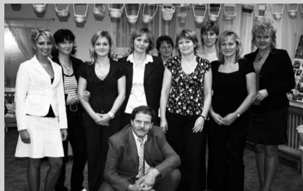
Akce. Setkání bývalých zaměstnanců a partnerů školy, ale také Den otevřených dveří s možností prohlédnout si budovu, interiéry, vybavení tříd, výstavu dobových i současných fotografií, kronik a prací dětí, byly v sobotu součástí oslavy 40. výročí otevření Mateřské školy v Lysicích. Nechyběla ani vystoupení dětí i zábavný program s kouzelníkem a písničkami.