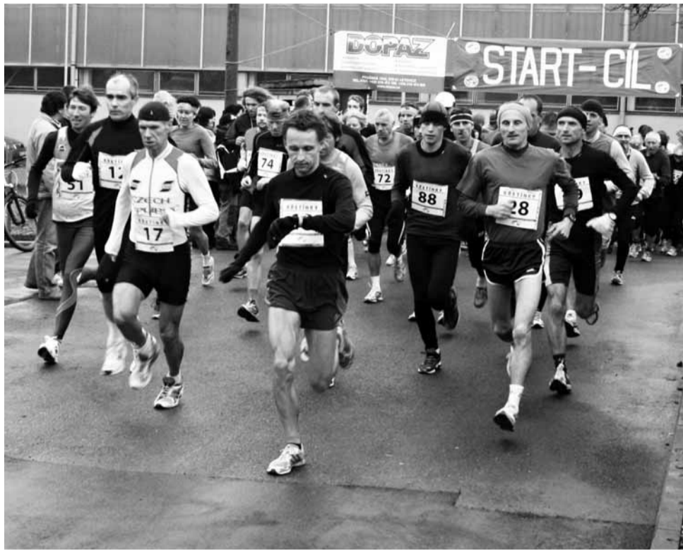
Start. I letos bylo pole běžců v Letovicích početné.

Výsledky, muži 18 - 39 let (21 startujících): 1. Kučera (VSK UNI Brno) 47:49, 2. Wallenfels (Sokol Vinohrady) 50:53, 3. Macura (Horizont Kola Novák) 53:20, ..., 5. Šebánek (Rájec-Jestřebí) 54:20, 8. Videman (Kunštát) 55:47, 9. Haresta (Blansko) 1:01:43, 10. Coufal (Letovice) 1:02:13. Muži 40 - 49 let (18): 1. Čermák (neuveveno) 51:22, 2. Bezrouk (BOKI) 55:20, 3. Dvořák (VSK Rájec Jestřebí) 55:46, 4. Kyzlink (ASK TT Blansko) 56:16, 5. Kejik (VSK Rájec Jestřebí) 56:39, 6. Novák (Horizont Kola Novák) 57:43, 7. Stloukal (Ada-