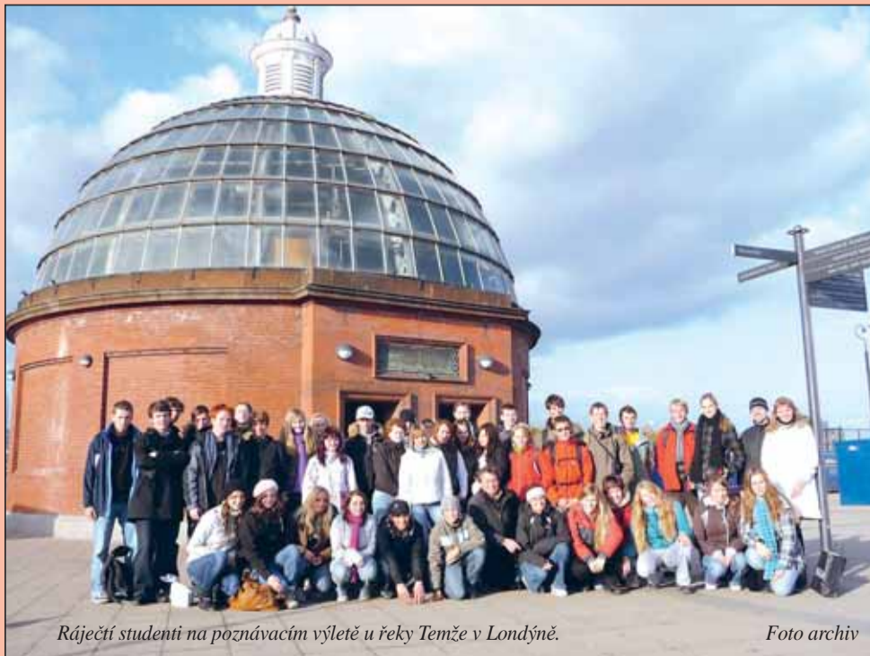
Ráječtí studenti na poznávacím výletě u řeky Temže v Londýně.