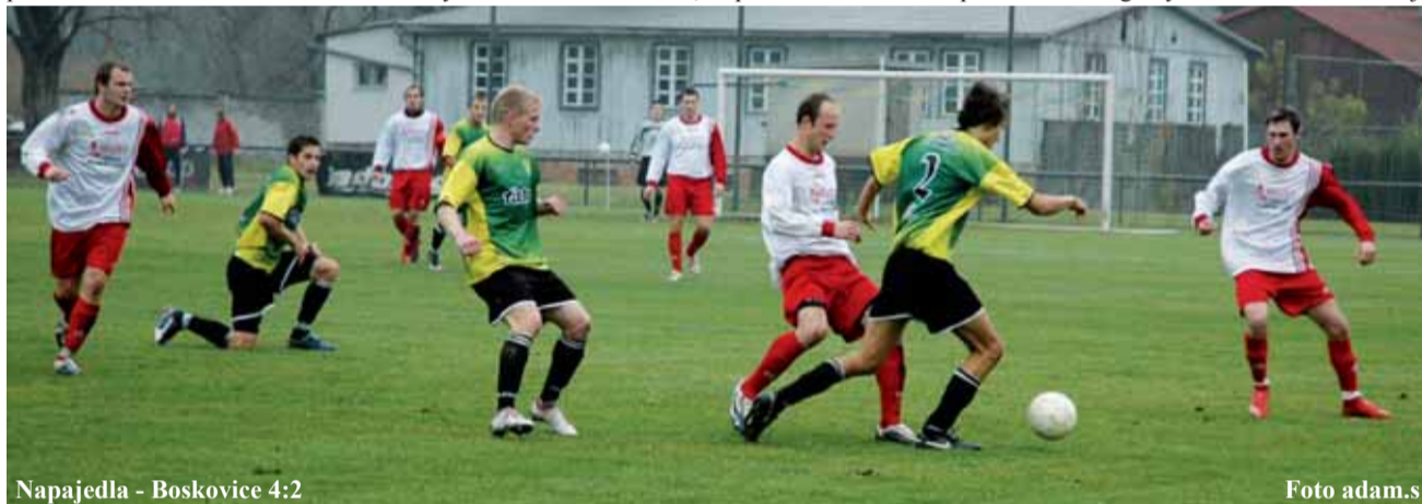
Napajedla - Boskovice 4:2