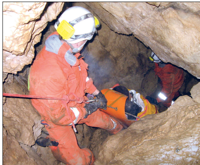
Jeskyně. Záchranáři vytahují zraněného speleologa z podzemí.

„Událost nám byla nahlášena těsně před půl čtvrtou odpoledne. Na místo jsme vyslali tři jednotky profesionálních a dobrovolných hasičů včetně skupiny