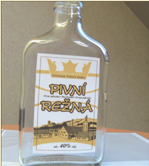
Na trhu se objevuje Pivní rezná v kapesním balení vhodném na zimní procházky či návštěvy hokejových zápasů.