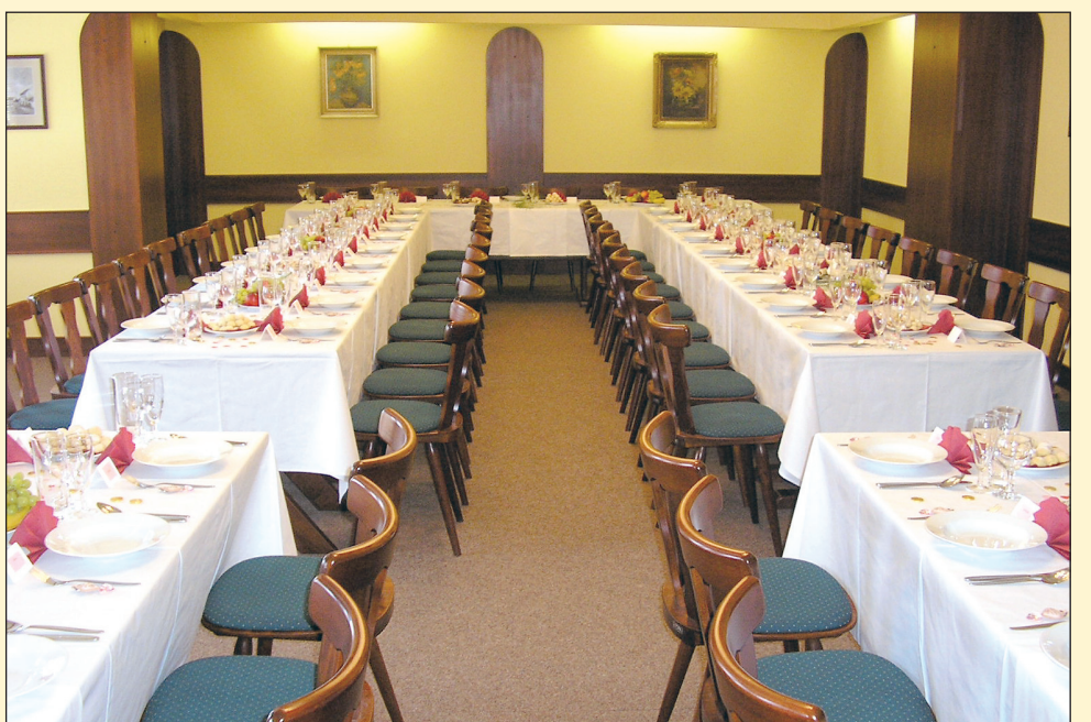
Chcete uspořádat svatební hostinu v pěkném prostředí? Olešnický Hotel Závrší je vám k dispozici.