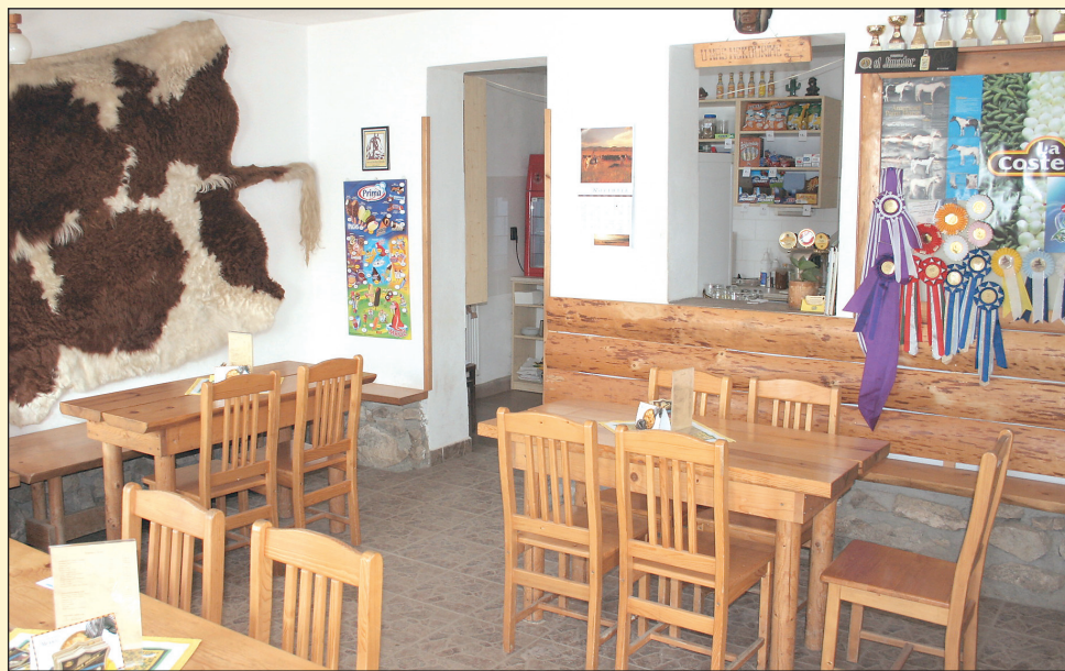
Hlavním lákadlem restaurace je mexická kuchyně s chutnými steaky.

Kromě restaurace nabízí zařízení také další služby. Hlavně se zaměřují na jezdecké kurzy pro děti a mládež a pobytové jezdecké kurzy v letním období. V příštím roce by v Hořicích rádi rozšířili spektrum služeb ještě o servis pro dospělé klienty. To znamená nějaké jezdecké progra-