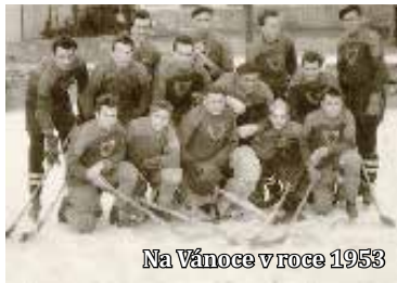
Na Vánoce v roce 1953