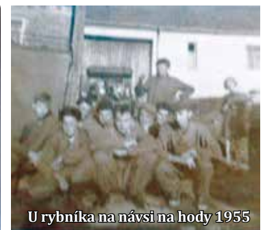
U rybníka na návsi na hody 1955