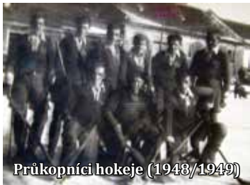
Přukopníci hokeje (1948/1949)

Na prvních dvou obrázcích lze vyzpozorovat, že hokejisté mají na sobě fotbalové dresy, které zůstaly po dřívějších fotbalistech. Musely se poříditi společně a stejné kalhoty a stulpny (punčochy), chrániče nohou a náloketníky měl každý své, nárameníky (vesty) ještě neznali. A rukavice z počátku byly jen obyčejné pletené zimní. Teprve později přišly speciální ohebné hokejové.