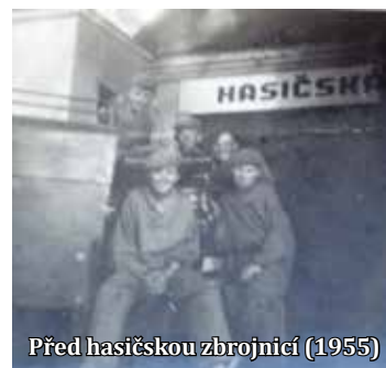
Před hasičskou zbrojnicí (1955)

A když jsem byl starší, stal jsem se voleným předsedou místní jednoty Československého svazu požární ochrany (ČSPO).