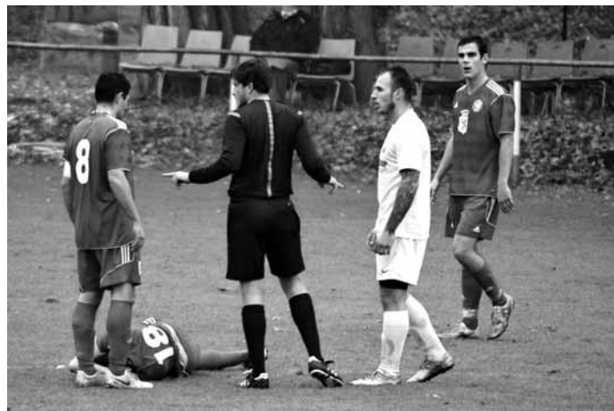
Překvapení. Skvělá obrana a rychlé protiútoky - to byly základní kameny výhry Boskovic v Bosonohách.