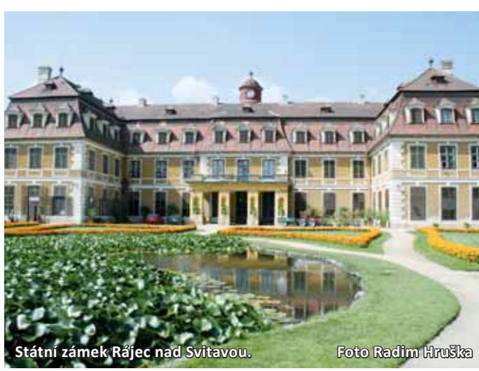
Státní zámek Rájec nad Svitavou.

Tradičně se v Lysicích konala také řada výstav. Lidé si mohli prohlédnout květinová aranžmá v komnatách, unikátní sbírku pečeti, nebo expozici představující předměty ze zámeckého depozitáře.