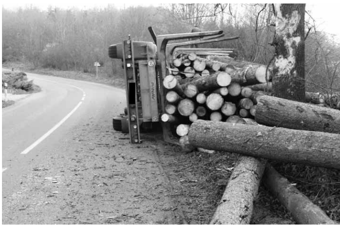
Nehoda. Kamion plný dřeva havaroval v úterý 3. listopadu odpoledne nedaleko hotelu Broušek ve Sloupě. Řidič zřejmě kvůli vysoké rychlosti nezvládl levotočivou zatáčku a převrátil vozidlo na bok. Náklad skončil vysypáný vpravo mimo silnici.

Společnost Včelpo byla založena v roce 1979 jako výrobní podnik českých včelařů. Jejím vlastníkem je Český svaz včelařů. Včelpo je držitelem řady ocenění a certifikátů kvality.