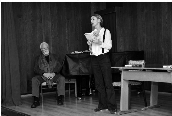
Známý americký spisovatel Robert Fulghum představil v sále Základní umělecké školy Letovice svoji novou knihu Opravář osudů. Oblíbený spisovatel se cítí v České republice jako doma. Po besedě a divadelním představení podepsal všem příznivcům svoje knihy.