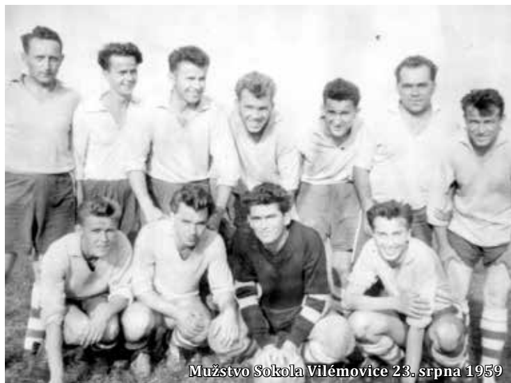
Mužstvo Sokola Vilémovice 23. srpna 1959

V té době nebyly k dispozici žádné kabiny, takže my jsme se jako domácí převlékali doma a hosté zpravidla v autobuse. A v řadě případů tomu bylo stejně, když jsme hráli venku.