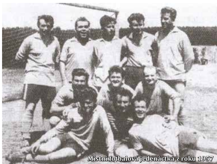
Místní fotbalová jedenáctka z roku 1957

Dalším krokem pak bylo utkání dospělých s mužstvem Těchova na hřišti na Obůrce. Šlo se tam pěšky po trase: horní můstek Macochy, zkratkou dolů k Punkevním jeskyním po „Stežce smrti“, nahoru do Suchdola a další zkratkou na Obůrku. Bylo to v neděli 10. července 1955. Byl jsem přímým účastníkem této akce.