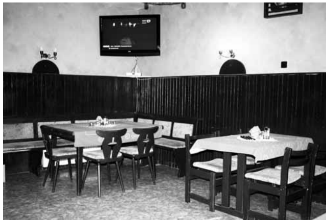
Otevřeno. Restaurace Obůrka nabízí příjemné posezení.