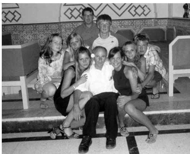
Prázdniny. Studenti lomnické školy na studijní stáži v Tunisku. Foto archiv

Na tříměsíční stáž vyrazili studenti z Lomnice 13. června. „Byli jsme rozděleni do dvou skupin po čtyřech. První část byla zaměstnaná v hotelu Les Colombes, kde se kluci a holky střídali v restauraci a na baru,