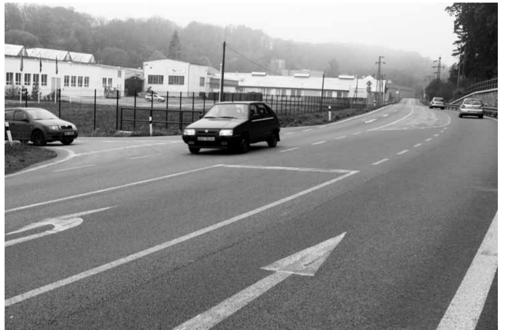
Rozšíření. Nájezd u letovického Letoplastu už má potřebné parametry.

Stavba bude s ohledem ke složitosti rozdělena na tři etapy. Řidiče čekají také objížďky. Dálková doprava bude vedena ve směru ze Svitav na Poličku, Bystré, Olešnici a Kunštát. Ve směru od Brna pak z Letovic přes Moravskou Třebovou. Místní a autobusová doprava bude na-