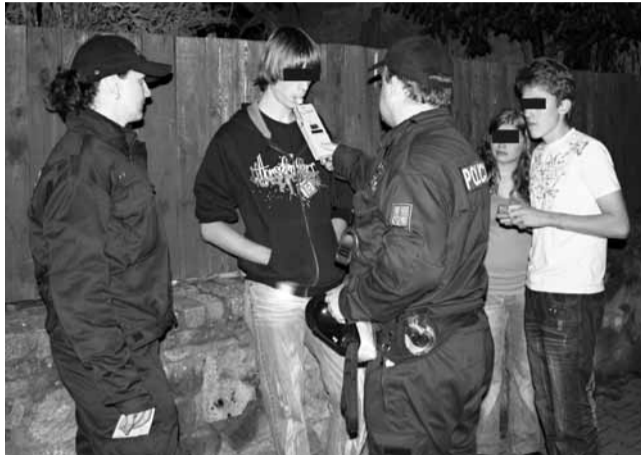
Kontrola. Také před kunštátskou diskotékou někteří mladší osmnácti let nadýchali alkohol.

„Mladé si vybíráme náhodně, musí ukázat občanský průkaz. Pokud je jim méně než osmnáct let, následuje u každého z nich dechová zkouška. Kontroly na drogy provádíme namátkově. Je několik věcí, které uživatele omamných látek prozradí. Například rozšířené zorničky, špatná orientace, ale také přílišná snaha spolupracovat s policisty,“ vysvětlila.