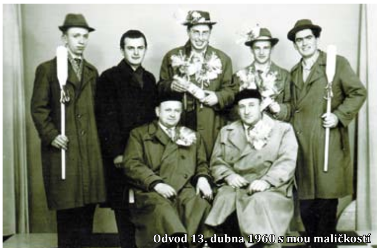
Odvod 13. dubna 1960 s mou maličkostí