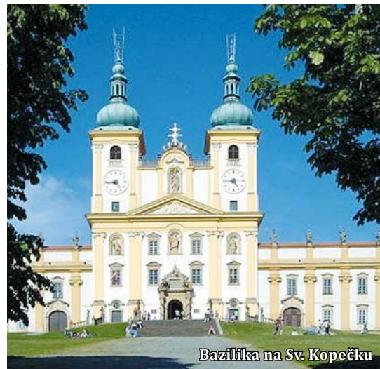
Bazilika na Sv. Kopečku