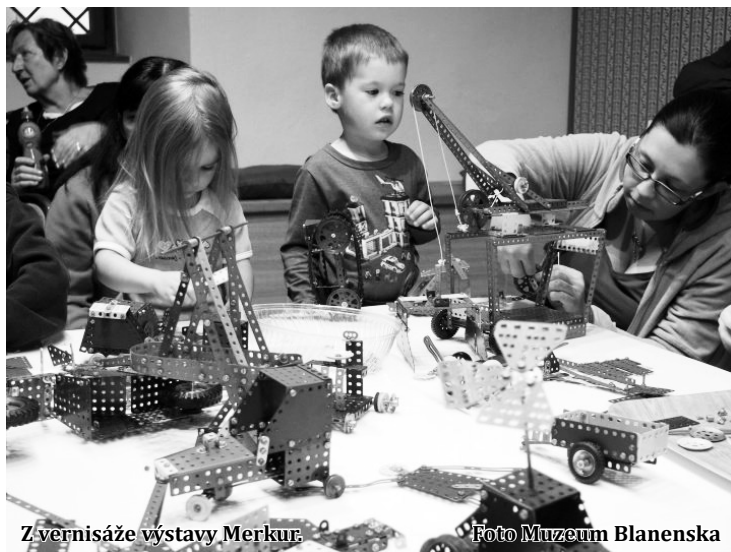
Zvěrnisáže výstavy Merkur.