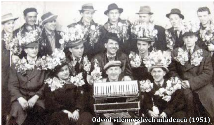
Odvod vilémovských mládenců (1951)

Následující fotografie ilustrují odvody na počátku a konci 50. let. Na starším foto je můj bratr, na mladším já.