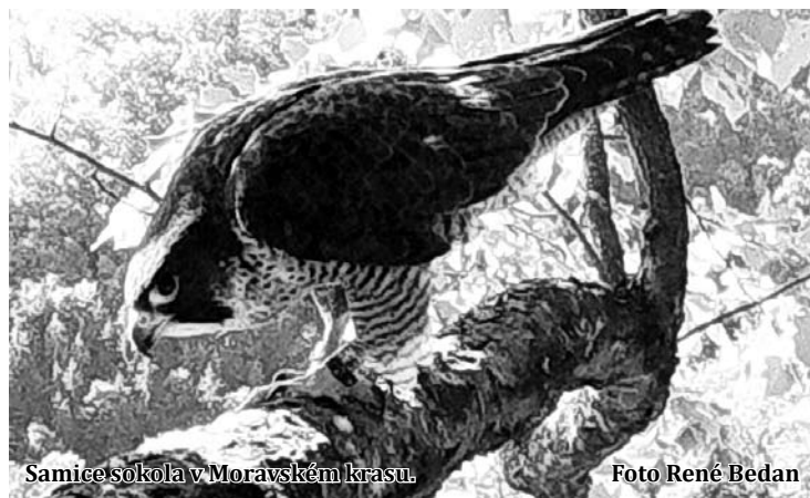
Samice sokola v Moravském krasu.