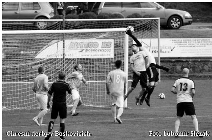
Okresní derby v Boskovicích.

V krajském přeboru bylo v jedenáctém kole na programu okresní