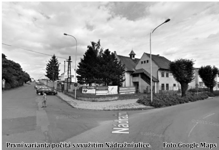
První varianta počítá s využitím Nádražní ulice.

Druhá varianta by přišla na asi 155 milionů korun a počítá s odklonem dopravy od centra města západním