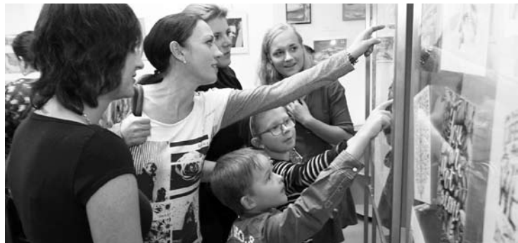
Výstava. Městská knihovna Blansko dala opět po roce prostor amatérským umělcům. Až do pátku 2. prosince hostí tradiční Salon blanenských výtvarníků.

„Policisté nyní muže stíhají pro vydírání, znásilnění a nedovolenou výrobu a jiné nakládání s omamnými a psychotropními látkami a jedy,“ doplnil Bohumil Malášek. (hrr)