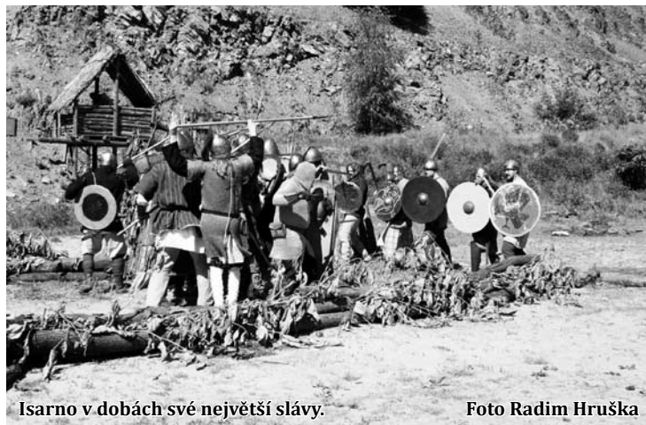
Isarno v dobách své největší slávy.