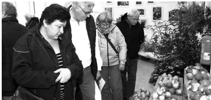
Zahrádkáři vystavovali. Osmá Regionální výstava ovoce, ovocných a okrasných dřevin se o víkendu odehrála v Arboretu Šmelcovna v Boskovicích.