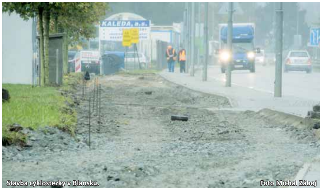
Stavba cyklostezky v Blansku.

V budoucnu na úsek kolem průmyslové zóny v Blansku naváže další část, kterou se cyklisté přes plánované Centrum Skleníky a most přes řeku Svitavu dostanou až na Sportovní ostrov. Michal Záboj