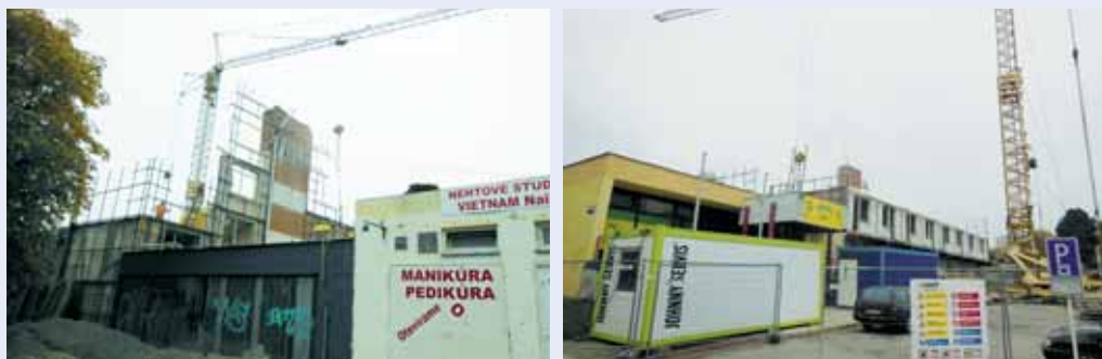
Bourání. Dělníci už odbourali pět horních pater a zbývá jim poslední. Objekt na náměstí Republiky začali rozebírat na konci srpna. Demolice včetně provizorního zapravení prostranství má skončit do poloviny listopadu. Příští rok město na místě Dukly vybuduje park.