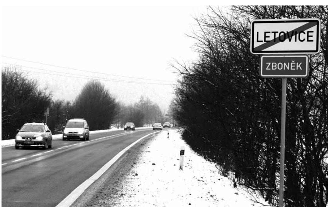
Půjde pryč? Jednou ze značek, kterou chtějí policisté odstranit je také ta upozorňující na začátek a konec místní části Letovic Zboňku.

Další návrh na odstranění se týká místní části Letovic Zboňku. Tam policisté navrhnou zrušení dopravních značek označujících začátek a konec obce na hlavním tahu, na silnici I/43 Brno-Svitavy. „V úseku není téměř žádná zastávka a tedy důvod, aby zde platila pravidla provozu stanovená pro obec,“ doplňují policisté. Ze stejných důvodů by dopravní značky začátek a konec obce na silnici I/43 měly být přesunuty