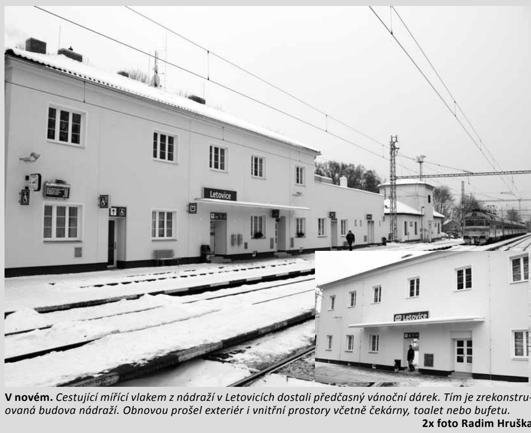
V novém. Cestující mířící vlakem z nádraží v Letovicích dostali předčasné vánoční dárek. Tím je zrekonstruovaná budova nádraží. Obnovou prošel exteriér i vnitřní prostory včetně čekárny, toalet nebo bufetu.