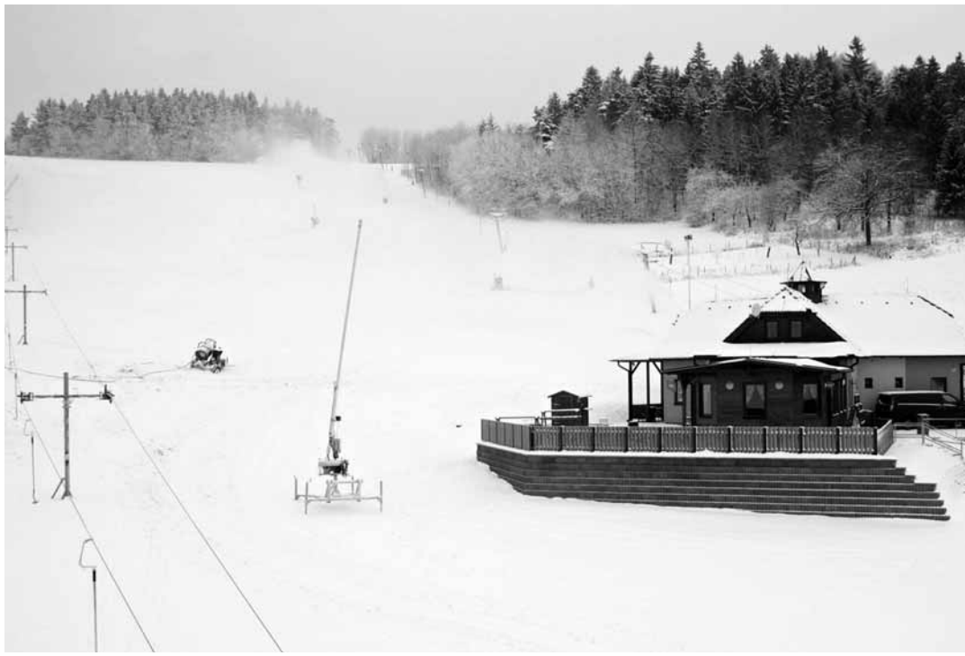
Servis. Na portálu www.holidayinfo.cz si mohou zájemci prohlédnout aktuální stav areálu.

Otevírací doba zůstává stejná jako v minulém roce, tedy ve všední dny od devíti do jednadvaceti hodin a o víkendu od osmi do jednadvaceti hodin. I přes zdražování elektrické energie zachovají v Olešnici také cenu jízdného. „Co se týče zlepšování podmínek pro lyžaře, tak jsme koupili novou rolnu za asi pět a půl milionu korun. Má modernější frézu,