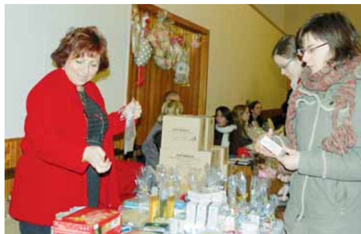
Jarmark. Pestrá nabídka a velká poptávka, to k jarmarku patří. Letošní ročník tradičního jedovnického akce se vydařil.

Paleta nabízeného zboží byla pestřejší. Řada stánků lákala na vánoční zboží, svíčky, mydla, obrázky, textilní hračky, hedvábné šátky. Nechyběla ani nabídka šperkařů. U stánků na jarmarku bylo také co ochutnávat. Byly tam zastoupeny speciality