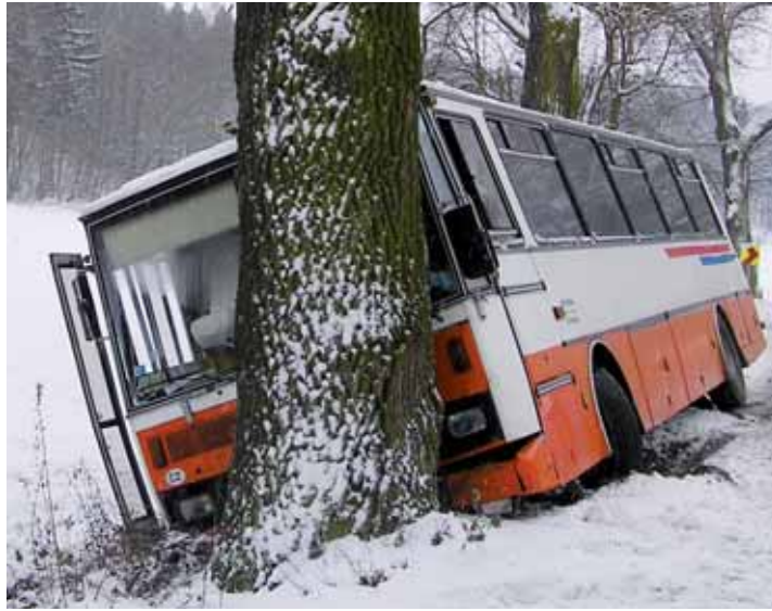
Nehoda. Už v pondělí havaroval na zasněžené silnici mezi Lažánkami a Jedovnicemi autobus, který převážel děti z plavání. Více na str. 2.

Problémy měly především řidiči kamionů, tradičně složitá byla situace na silnici I/43, konkrétně v kopci u Závisti a na Perné. Právě kamiony zapříčinily, že na hlavním tahu z Brna do Svitav se vytvořily kolony, které dosahovaly více