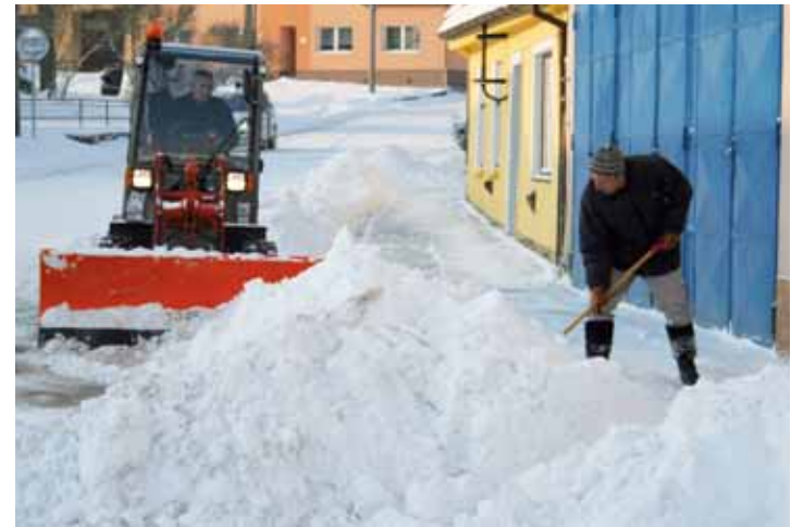
Úklid. S přívally sněhu se vyrovnávaly všechny obce a města. Takto například v Lysicích.

na umělé zasněžování, a v Hlubokém u Kunštátu. V provozu jsou už i běžecké okruhy na Drahaně vrchovině a na Boskovicku, konkrétně v okolí Kořence a obce Suchý. Více informací zájemci získají na internetových stránkách www.lyzarsketrasy.cz.