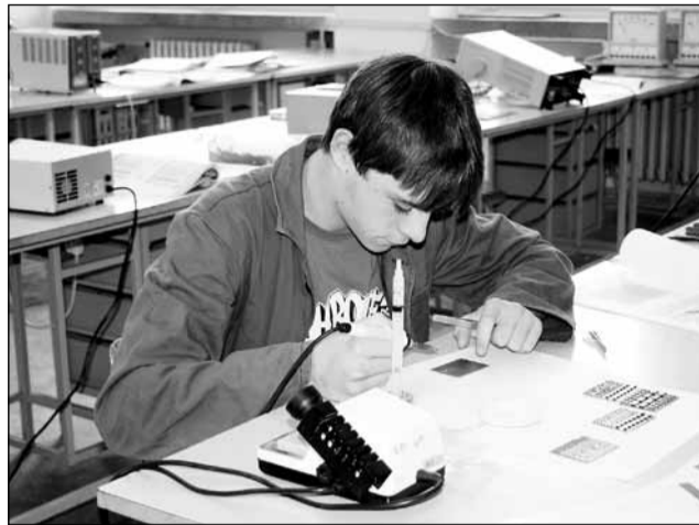
Škola moderních technologií. Toto přízvisko blanenské školy slaví výročí přísluší právem.

Významným impulsem k rozvoji vzdělávací nabídky i technického vybavení bylo období po roce 1991. V tomto období došlo v celém systému školství k uvolnění, ke vzniku nových škol a téměř neřízenému rozšiřo-