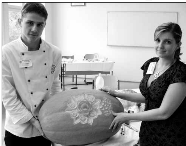
Ukázka. Studenti školy se svými pedagogy dokáží udělat spoustu krásných věcí.

„Současná vzdělávací nabídka naší školy je neustále přizpůsobována potřebám a trendům vývoje společnosti. Vyučovány jsou nové obory vzdělávání a výrazně byla posílena výuka v mnoha oblastech. Škola také navázala spolupráci s Mendelovou zemědělskou a lesnickou univerzitou v Brně a vzdělávací nabídku rozšířila o bakalářské studium,“ řekl ředitel školy Jindřich Friedl.