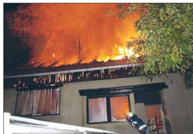
Zásah. Mohutný požár zaměstnal desítky profesionálních i dobrovolných hasičů.

„Oheň vypukl v přístřešcích s uskladněným dřevem a uhlím a rozšířil se na střechu sousední dílny. V době příjezdu hasičů byly v plamenech přístřešky i téměř celá střecha dílny. Hasiči, kteří vzhledem k silnému zakouření zasahovali v dýchacích přístrojích, proti pla-