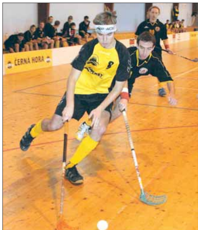
Talent. Výborně si vedl v obou zápasech blanenský Skoták, loni ještě junior.