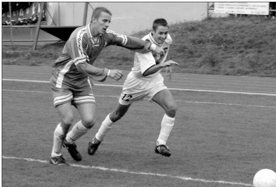
Lídr tabulky. Bořitov si vede v okresním přeboru suverénně. Tentokrát to odnesl Vavřinec.

Blanensko a Boskovicko - Dalším kolem pokračoval fotbalový okresní přebor.