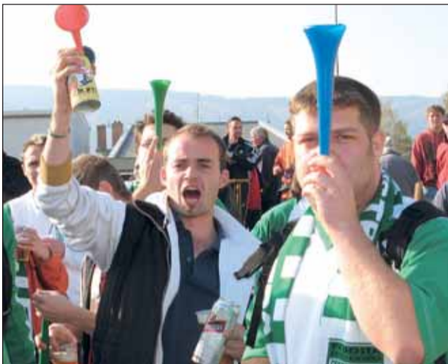
Fandové. Díky bystrckým „hooligans“ bylo kolem hřiště rušno. Vše se však odbylo bez incidentů.