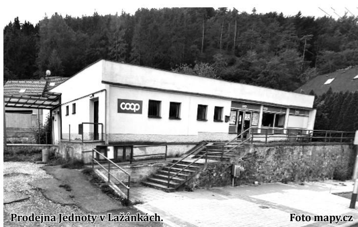
Prodejna Jednoty v Lažánkách.

I přesto chce vedení města dál jednat. O problému bude mluvit s osadním výborem v Lažánkách a projedná ho i prosincové zastupitelstvo.