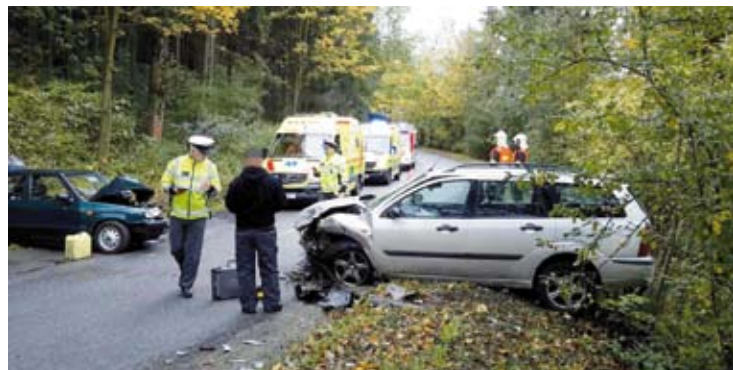
Na silnici z Ostrova u Macochy do Sloupa se v sobotu po ránu čelně srazila dvě osobní auta. Při nehodě se zranili dva lidé.