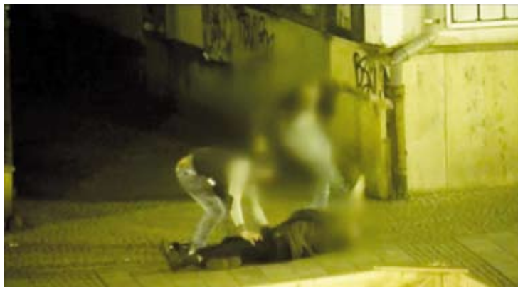
Zbitého muže násilníci okradli o zhruba tři tisíce korun a láhev piva. Útok v přímém přenosu sledoval

„Když muž po několika úderech pěstmi do obličeje upadl na zem, tak do něj následně i kopal. Potom bezvládného muže, který upadal do bezvědomí, nestydatě prošacovali a okradli. Přitom bezbranného seniora ještě kopli do hlavy,“ popsal blanenský policejní mluvčí Bohumil Malásek.