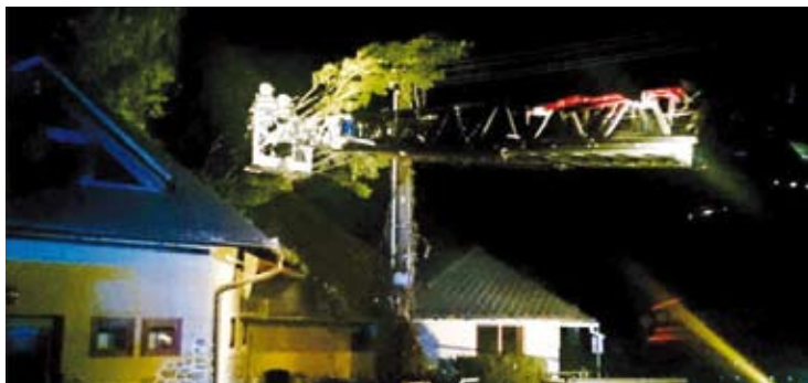
Silný vítr zaměstnal ve čtvrtek večer a v noci hasiče v našem regionu. V rámci celého kraje bylo hlášeno téměř třicet událostí. V našem okrese vyjžděli hasiči mezi osmnáctou a dvaadvacátou hodnou celkem desetkrát.

Michal Záboj video na zrcadlo.net