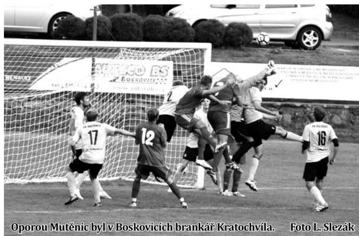
Oporou Mutěnic byl v Boskovicích brankář Kratochvíl.

9. kolo: Boskovice - Rousínov 3:0 (0:0), 46. Černý, 70. Preč, 75. Stara.