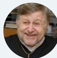
ThDr. Jan Hradil, Th.D. Biskup a starosta Města Újezd u Brna