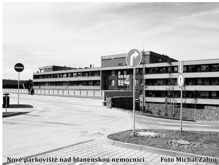
Nové parkoviště nad blanenskou nemocnicí.

Stavba začala na konci letošního dubna. Včetně přípravných prací