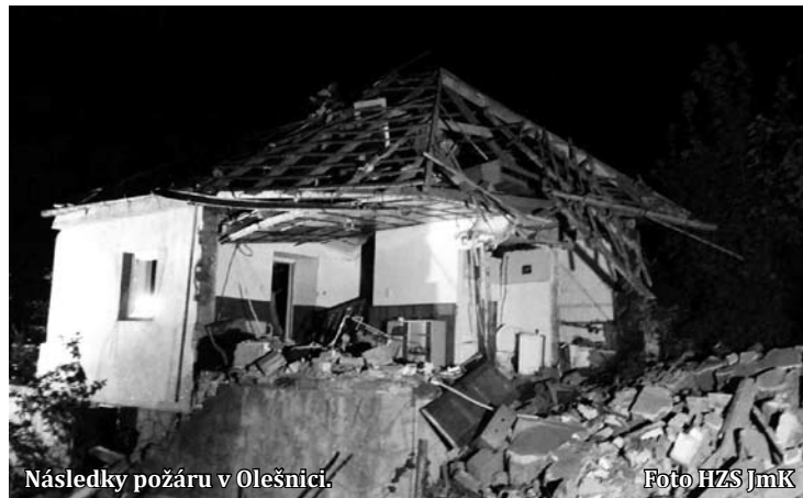
Následky požáru v Olešnici.

V Olešnici zasahovalo několik profesionálních sborů i dobrovolní hasiči. Velitel zásahu na místo povolal