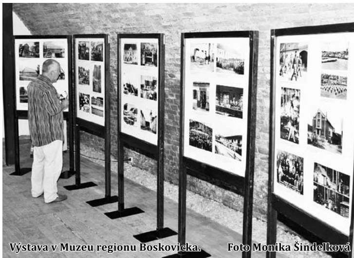
Výstava v Muzeu regionu Boskovicka.

Výstavu je možné v Muzeu regionu Boskovicka shlédnout do 30. října v úterý až pátek od 10 do 17 hodin a o víkendech a svátcích od 13 do 17 hodin. Vstupné je zdarma. (hrr)