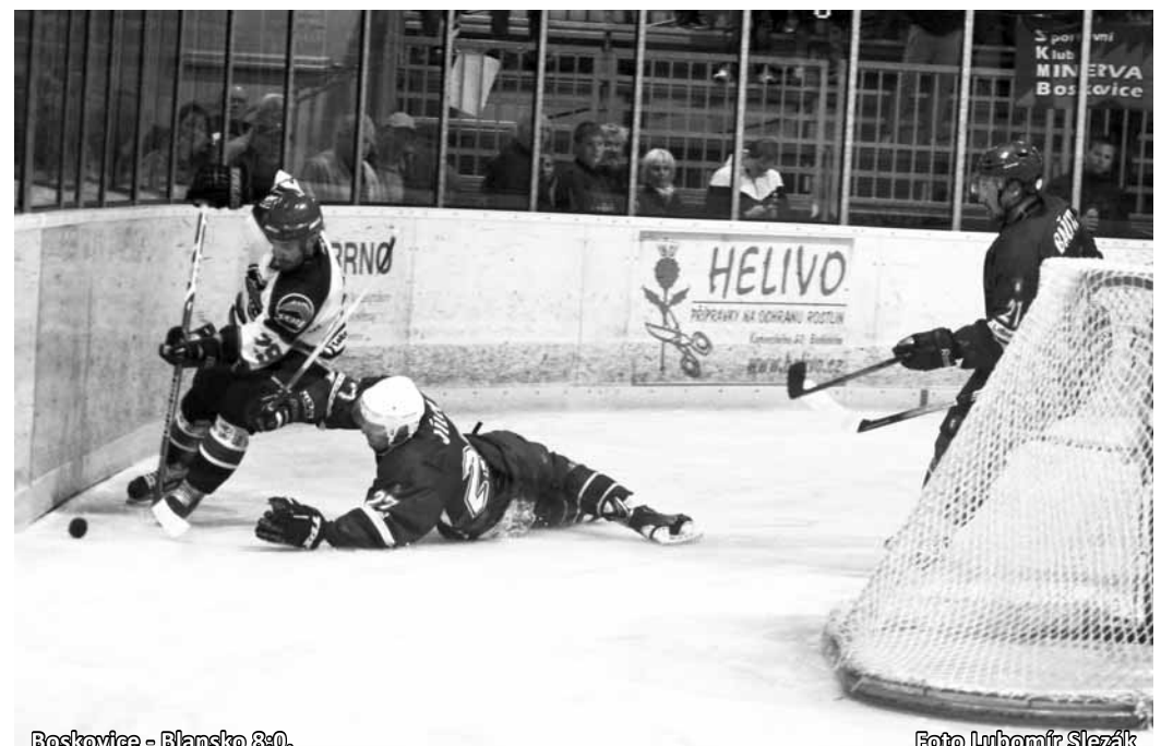
Boskovice - Blansko 3:0.