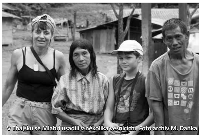
V Thajsku se Mlabri usadili v několika vesnicích.

Ale to předbílám. Už dopředu jsme z internetu věděli, že lidé Mlabri v Thajsku přežili. Cílem naší výpravy bylo zjistit, jak taková skupina lidí, která donedávna