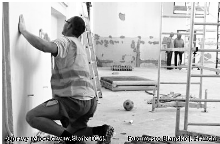
Opravy tělocvičny na škole TGM.

„Na základní škole v Erbenově ulici se kromě modernizace tělocvičny