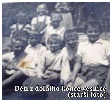
Děti z dolního konce vesnice (starší foto)