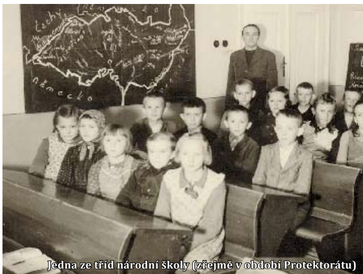
Jedna ze tříd národní školy (zřejmě v období Protektorátu)

Pohled na třídu, do které jsem chodil i já, ilustruje následující starší foto.