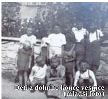
Děti z dolního konce vesnice (mladší foto)