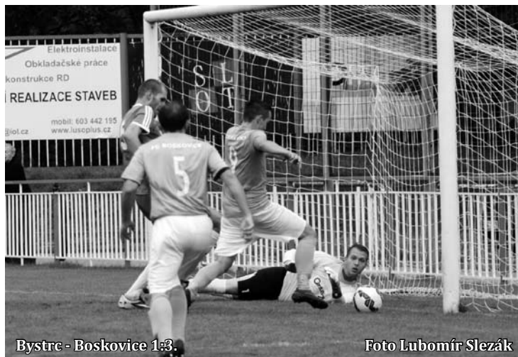
Bystrc - Boskovice 1:3.

V sobotu 30. září hostí Blansko na svém trávníku Polnou, utkání začíná v 15 hodin.