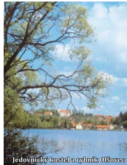
Jedovnický kostel a rybník Olšovec