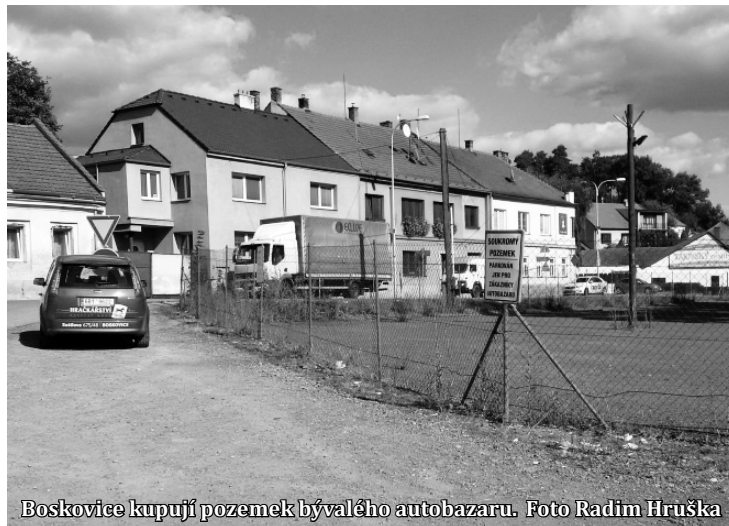
Boskovice kupují pozemek bývalého autobazaru.

Před rokem boskovičtí zastupitelé schválili nákup areálu Dvořáčkova mlýna. Za tři tisíce šest set metrů pozemků, na kterých stojí bývalý mlýn a autokemp, město zaplatilo čtrnáct milionů korun. Opozice to tehdy kritizovala. Michal Záboj