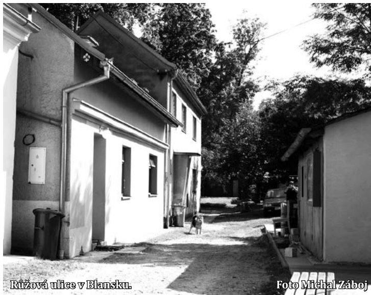
Růžová ulice v Blansku.