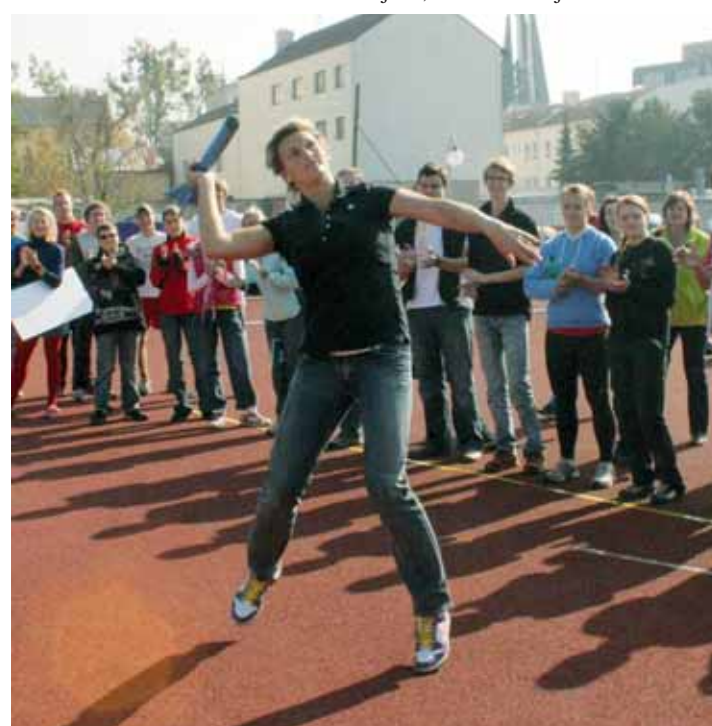
Špotáková. Olympijská vítězka v akci.

Určitě. Těším se, že ty dva roky s novým trenérem budou hodně zajímavé. Zhruba v březnu vyrazíme do jižní Afriky, vadí mi jen to, že tam budeme muset být delší dobu, to nemám ráda. Jsem ráda s kamarády, mít pestřejší činnost. Nikdy jsem nebyla ten, kdo žije jen atletikou od rána do večera. Život je pro mě i o něčem jiném.