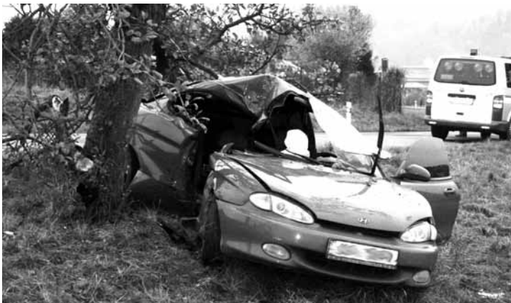
Nehoda. Dvěma těžkými zraněními skončila havárie, k níž došlo v sobotu 16. října kolem páté hodiny odpoledne na silnici za Lysicemi ve směru na Bořitov. Šestadvacetiletý řidič osobního vozu Hyundai vyjel ze silnice a havaroval do stromu. Řidič utrpěl těžká zranění, s nimiž byl transportován vrtulníkem do nemocnice. Těžká zranění při havárii utrpěla také jeho devatenáctiletá spolujedkyně,“ řekla blanenská policejní mluvčí Iva Šebková. Policie po dobu likvidace nehody na místě řídili provoz kyvadlově. (pš)

ti pohybu, ale především dbát na vlastní bezpečnost. Záchranářům je potřeba sdělit, co se stalo, co nejpřesněji určit místo nehody a popsat počet postižených a jejich zranění,“ dodala. Více na www.zrcadlo.net