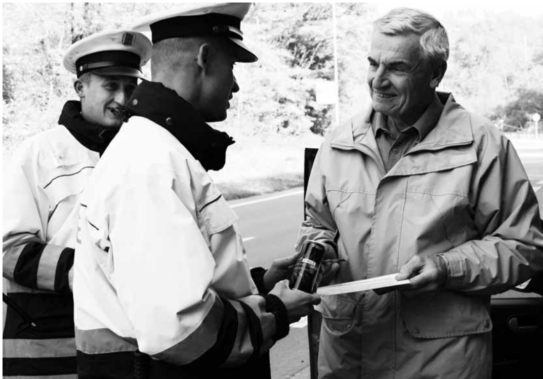
Odměna. Řidiči, kteří měli všechno v pořádku, dostali od policistů malý dárek.

Podle ní se mezi řidiči opět našli i tací, kteří usedli za volant pod vlivem alkoholu nebo jiným způsobem porušili předpisy. Hlídka tak například nedaleko Lhoty Rapotiny zastavila osmatřicetiletého řidiče Škody Felicie, který měl v dechu 2,2 promile alkoholu a je nyní podezřelý ze spáchání trestného činu ohrožení pod vlivem návykové látky. Další řidiči pak například neměli svoje vozy v dobrém technickém stavu. Podobnou akci budou policisté ještě opakovat.