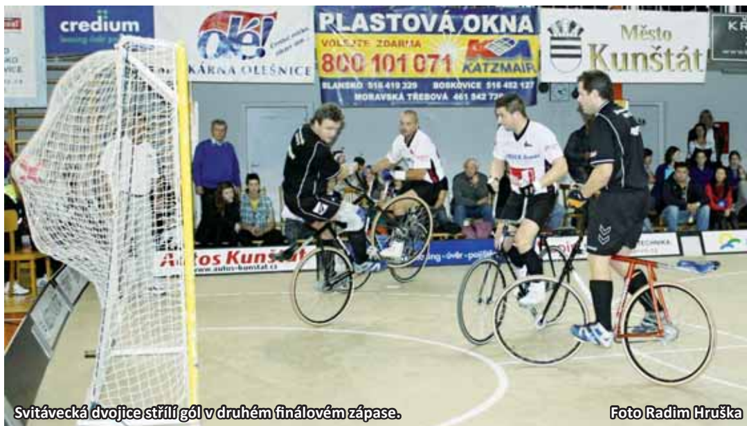
Svitávecká dvojice střílí gól v druhém finálovém zápase.

„K tomu, abychom postoupili na světový šampionát, jsme museli nutně porazit kluky z Plzně, kteří byli na třetím místě celkového pořadí extraligy. Povedlo se. Poté jsme ve dvou zápasech hráli o titul proti Favoritu Brno. První jsme prohráli rozdílem tří gólů. V tom druhém jsme museli vyhrát, abychom vůbec mohli pomýšlet na titul, což se nám