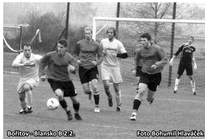
Bořítov - Blansko B 2:2.