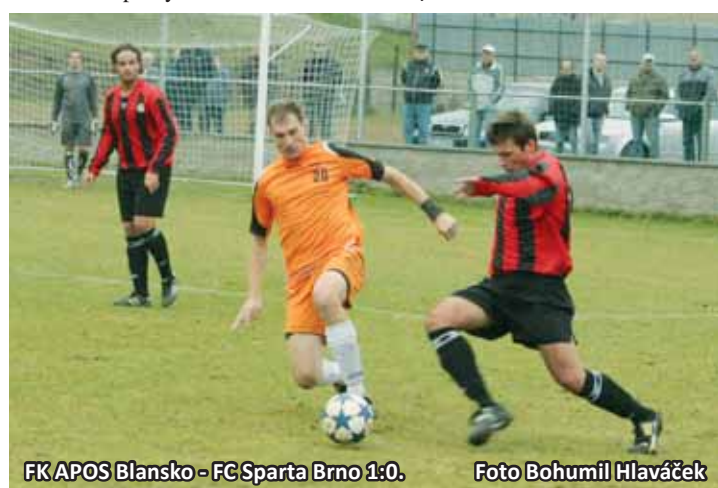
FK APOS Blansko - FC Sparta Brno 1:0.