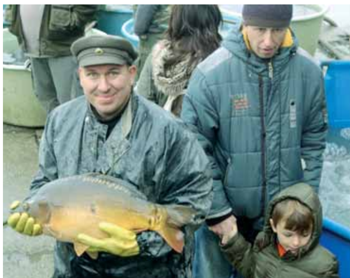
Výlov. Rybník Olšovec vydal své bohatství. Příští rok, až se zase naplní vodou, ožije.

„Jedeme do Jedovnic za hráz na svačák a pro kapra,“ vysvětlovala do telefonu své kamarádce jedna z pasažérek autobusu mířícího k rybníku z Brna. A nebyla zdaleka