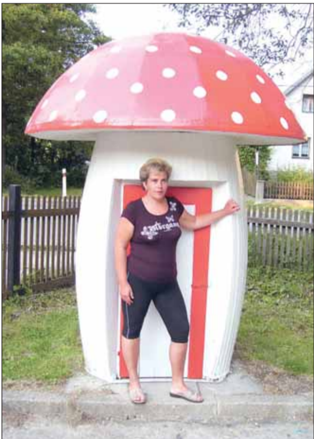
Houbaři nemají zatím příliš dobrou sezónu. Ale jak se říká, kdo hledá, najde. A pak že nerostou, je název snímku Věry Okáčové.