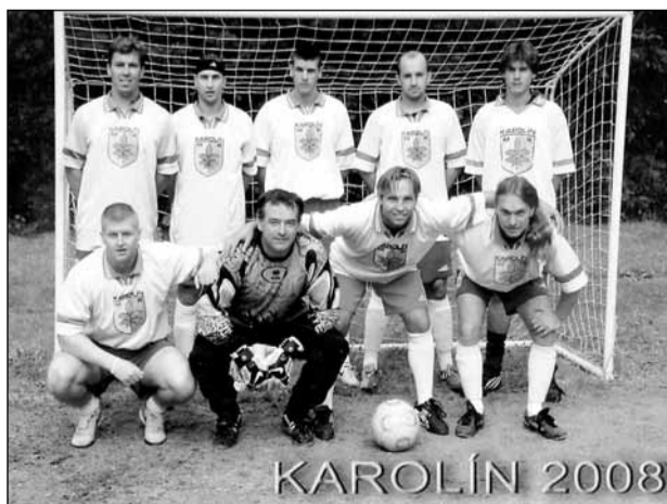
Oslavy. Malá kopaná v Karolíně byla založena již před pětadvaceti lety. Za tuto dobu se v jeho dresu vystřídala více než stovka fotbalistů. Věštin z nich se sešla minulou sobotu na velké oslavě.