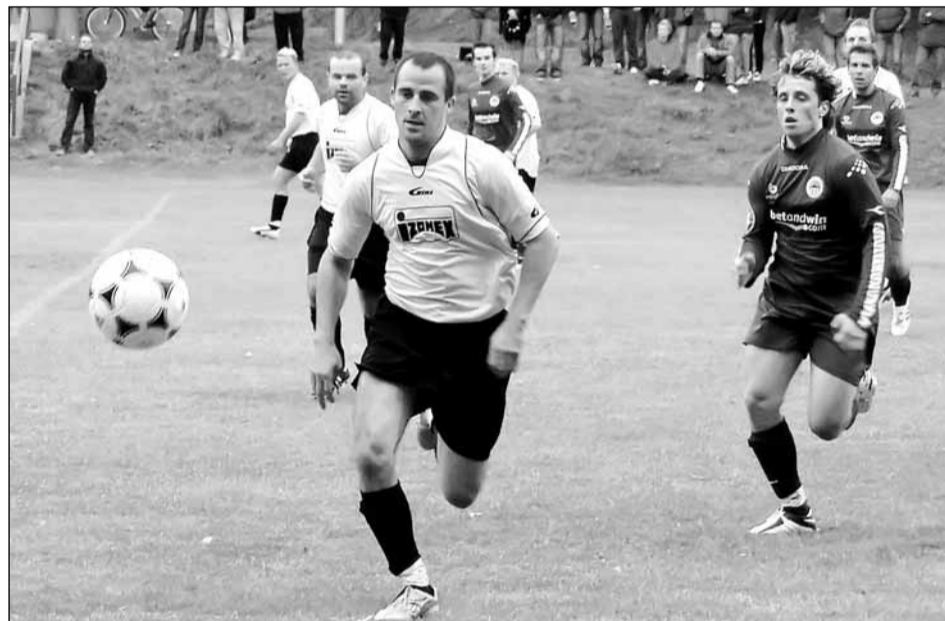
Fotbal. Bezbrankovou remízou skončilo derby ve III. třídě mezi týmy Lažan a Lipůvky. Šanci bylo dostatek, ale střelci buď nemířili přesně, nebo se zaskvěli brankáři. Několik stovek prochládlých diváků tak domů odcházelo s rozpačitými pocity.