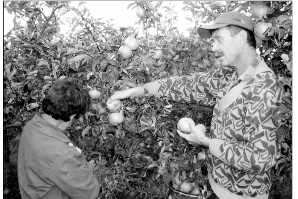
Úroda. Pracovníci sklízí jablka v Sadech ZEAS v Lysicích.