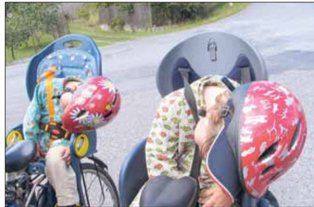
Milada Barešová poslala fotku, jejíž autorkou je Alena Žákovská. Ta svědčí o tom, že cykloturistika, konkrétně cesta z Rožmitálu pod Třemšínem do Březnice, je opravdu náročný koníček...