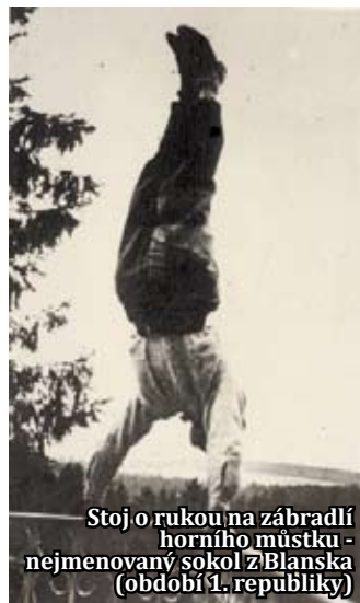
Stoj o rukou na zábradlí horního můstku - nejmenovaný sokol z Blanska (období 1. republiky)

vých nebo oplatkových kornoutků či mističek.