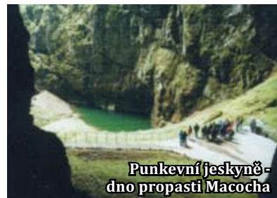
Punkevní jeskyně - dno propasti Macocha

Z dolního můstku je lépe vidět druhý rozměr propasti, totiž šířku a je z něj zajímavý pohled na horní můstek. Největší atrakcí pak bylo, když brněnští horolezci překonávali těch 138 m ze dna Macochy. Jednou jsem je sledoval z protilehlé strany horního můstku. První vstup na dno byl uskutečněn v roce 1723.