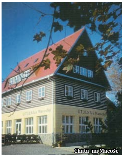
Chata na Macoše