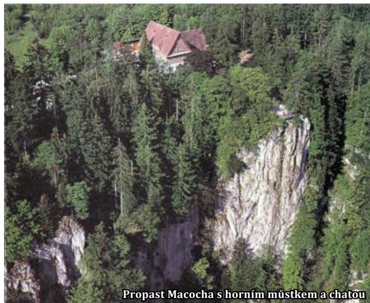
Propast Macocha s horním můstkem a chatou

Horní můstek byl vybudován již v roce 1882, dolní (též zvaný spodní) můstek pak v roce 1899.