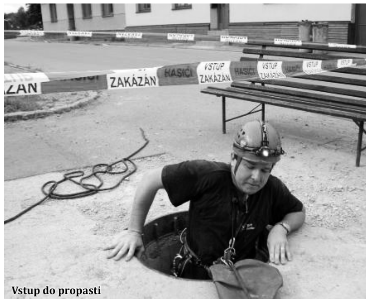
Vstup do propasti

Pokud si ale turisté chtějí do Rudice udělat výlet a propast pomyslně navštívit, není to problém. Odměnou za cestu do této obce v centru Moravského krasu jim bude hledání správného poklopu na silnici, na němž je uveden název propasti.