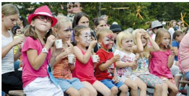
PRO DĚTI. V sobotu proběhl v areálu blanenské nemocnice již sedmý ročník Dne pro děti. Bohatý program jak na pódiu, tak i v celém areálu nemocnice přilákal více než dva tisíce návštěvníků.