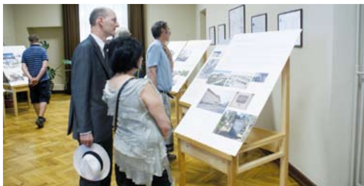
JARMARK. Svitávka hostila o víkendu již jedenáctý Svitávecký jarmark tradičních řemesel. V rámci něj došlo také na slavnostní otevření Muzea rodu Löw-Beer.