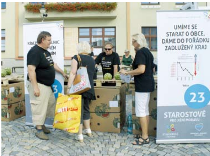
VOLBY. Volební kampaň je v regionu v plném proudu. V Blansku a v Boskovicích „starostové“ minulý týden rozdávaly melouny.

Chce-li preferovat konkrétního kandidáta na krajské kandidátce, může jeho jméno zakroužkovat. Zakroužkovat může maximálně čtyři kandidáty na pouze jednom hlasovacím lístku. Takto zvýhodněn