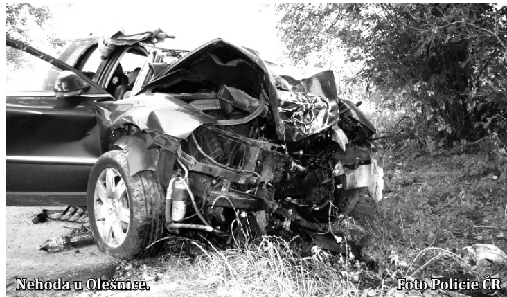
Nehoda u Olešnice.

Šofér na místě nehody zemřel. Stejně tak jeho o pět let mladší spolujezdkyně. Osmnáctiletého mladíka, který v autě rovněž cestoval,