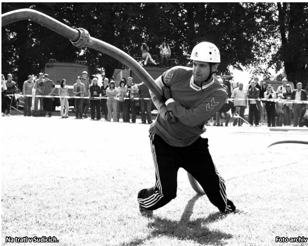
Na trati v Sudicích.

V kategorii mužů se všichni těšili na souboj o konečnou bednu. Jako první z favoritů nastoupili muži z Horního Poříčí, kteří před posledním kolem Kvasar Cupu vedli. Svým výkonem 17,87 s nenechali nikoho na pochybách, že titul bude ve správných rukou. Další boje pak probíhaly „jen“ o stříbro. Z průběžně třetího místa si dělali zásluku na druhou příčku muži z Hlubokého (TR). Bohužel pro ně útok skončil záhy po startu, když nenašroubovali sací koš. Tato fatální chyba je odsunula až na celkové šesté místo. Šokem pro přihlížečící byl útok mužů ze Sychotína, kteří napodobili Hluboké a i když se celou sezonu střídali ve vedení seriálu, tak nakonec na ně zbyla nepopulární bramborová příčka. Závání favoritů dokonale využili muži z Černovic. Časem 19,11 s si pojistili solidní bodový přísun a vyhoupli se na celkovou stříbrnou příčku. Parádní formu v druhé polovině seriálu předváděli muži z Lipové (PV). Stejně tomu bylo i v Sudicích. Body za třetí místo (za čas 18,75 s) jim stačili i na bronz v celém seriálu. Ještě doplníme, že stříbrnou příčku v Sudicích vybojovali loňští vicemistři z Maršovic (ZR) za čas 18,26 s.