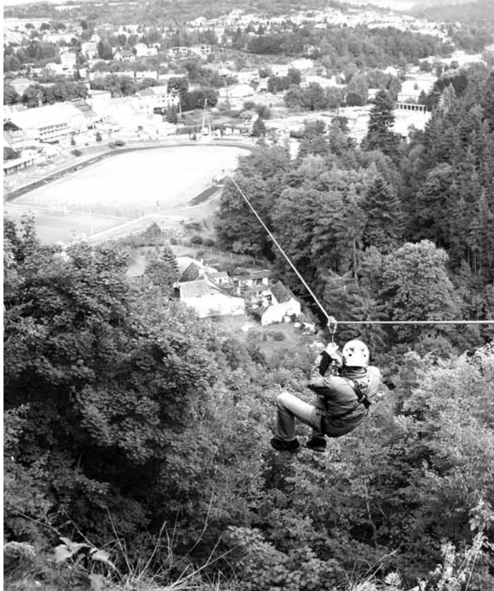
Divoká jízda. Účastníci traverzu si mohli vychutnat výhled na Boskovice.

Akce se mohla uskutečnit jen díky všem partnerům, kteří se na ni podíleli. Především to byla rodina Mensdorff-Pouilly, která dovolila na svých pozemcích provést takové úpravy, aby jízda na traverzu byla bezpečná. „Zvláštní poděkování pa-