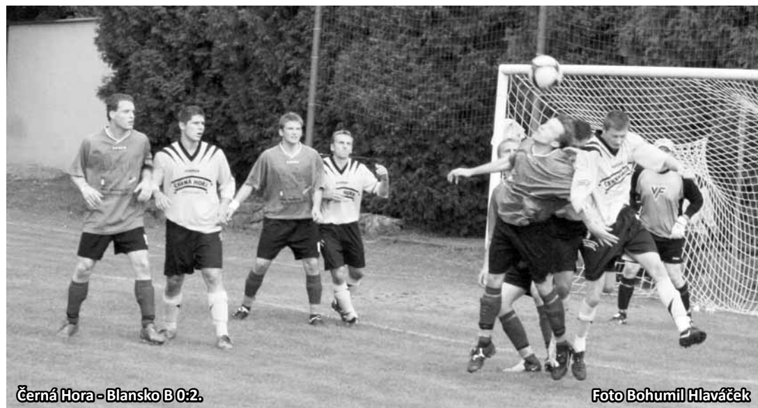
Černá Hora - Blansko B 0:2.