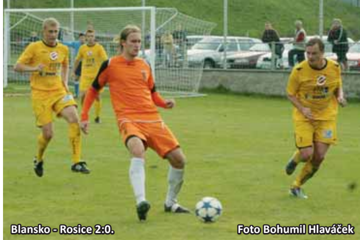
Blansko - Rosice 2:0.