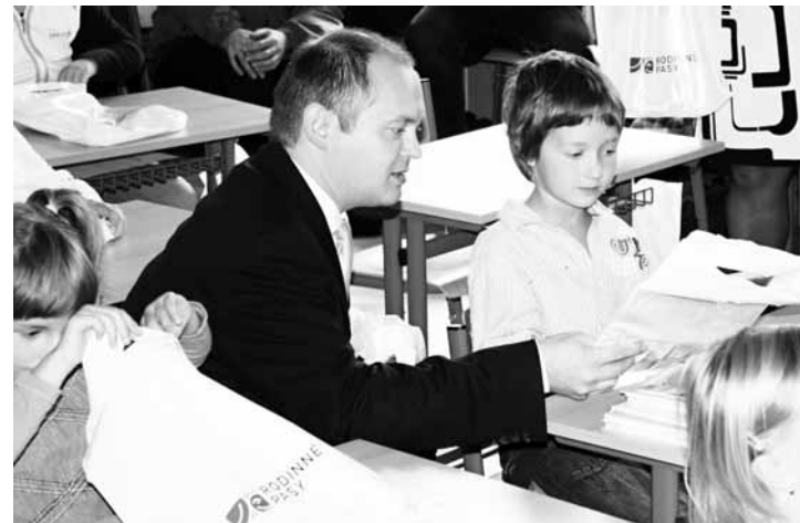
Návštěva. Prvního září zavítala do vícece školy vzácná návštěva. Na první den školáků se přijel podívat hejtmán Jihomoravského kraje Michal Hašek. Základní škola ve Viskách slaví v letošním roce sto dvacáté výročí založení. V současné době má kapacitu čtyřicet žáků.

„Je to tedy asi pětina z celkových pěti a půl kilometru. Velká zkouška nás čeká o víkend 18. a 19. září, kdy se v Kunštátě koná tradiční Hrnčířský jarmark. Podle harmonogramu by kolaps neměl nastat, přesto prosíme touto cestou řidiče, aby dbali pokynů pořadatelů,“ vzkazuje starosta. Podle jeho slov letos kromě již tradičního parkování na škvárovém fotbalovém hřišti bude nová odstavna plocha pro automobily také na poli před Kunštátem ve směru od Sebranic. (pš)