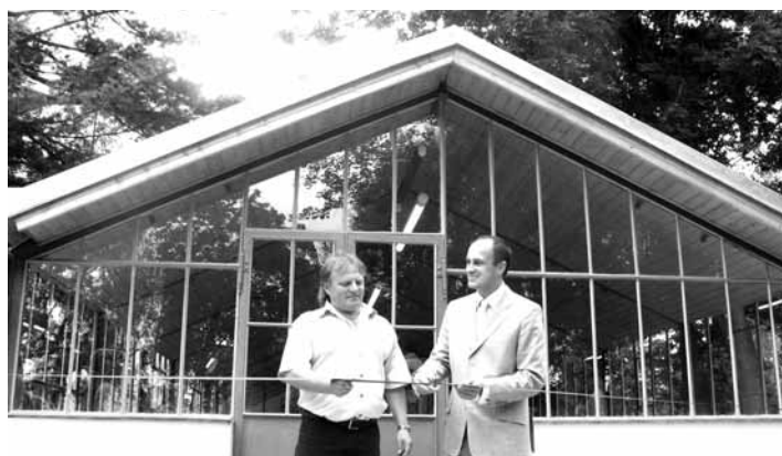
Slavnostní přestřižení pásky.