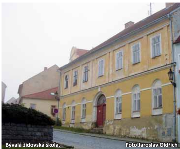
Bývalá židovská škola.