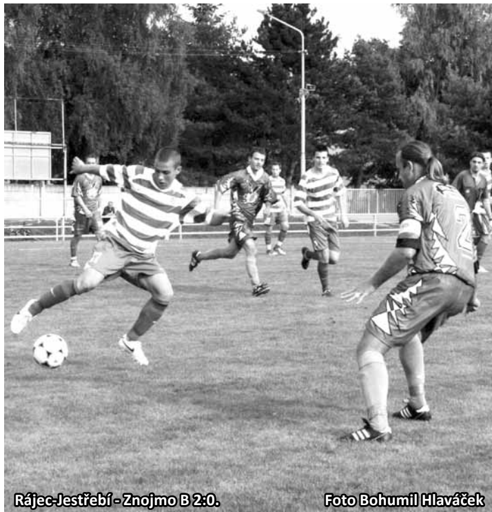
Rájec-Jestřebí - Znojmo B 2:0.

Rájec-Jestřebí – Znojmo B 2:0 (2:0) , Sova, Kolář. Rájec-Jestřebí: Němeček – Škvarenina (83. Koláček), Macík, Kolář, Herman – Navrátil (65. Nedělník), Opletal, Holý (75. Rusler), Sedlák – Ostrý, Sova.