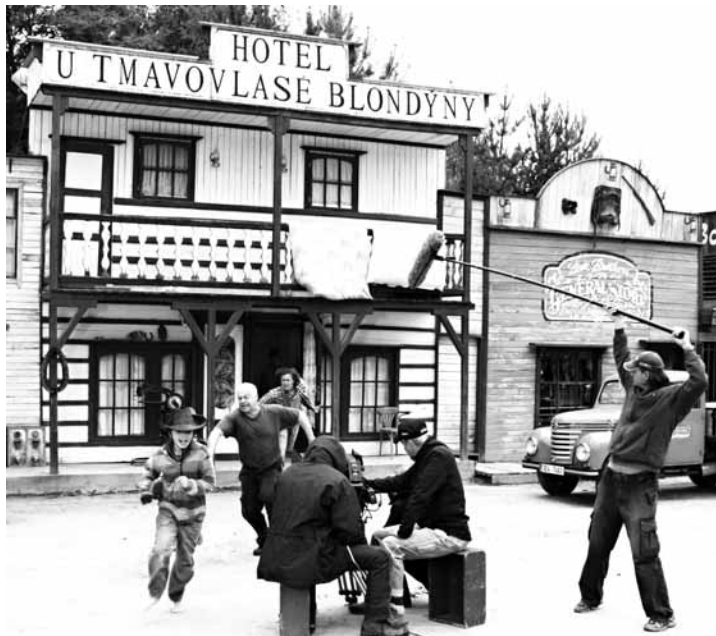
Natáčení. Jedna z prvních scén připravovaného filmu.

Podle tvůrců se do českého filmu po letech vrací stetsony, kankán v zakouřeném saloону a kolty zavě-