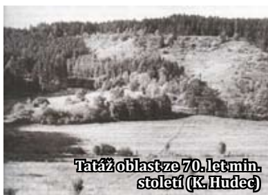
Tatáž oblast ze 70. let min. století (K. Hudec)