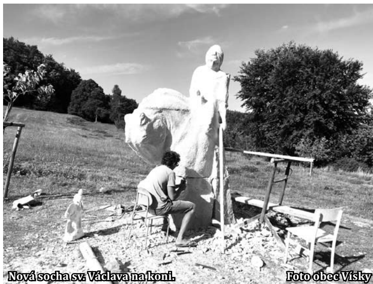
Nová socha sv. Václava na koni.

Obec buduje betlém ve spolupráci se sochaři již osm let. Umělci se do Vísek sjíždějí vždy o letních prázdninách. Jejich vedení jim zajišťuje pískovcové bloky, z nichž pak sochaři vytvářejí nové skulptury do betléma. Podle znalců je největším, tedy nejrozměrnějším betlémem v ČR. Je o něj velký zájem. Konec konců leží na třech turistických trasách.