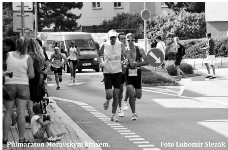
Půlmaraton Moravským krasem.