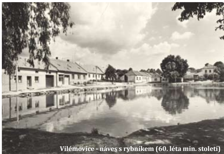
Vilémovice - návés s rybníkem (60. léta min. století)

Vesnice leží v severní části Moravského krasu, která je nejnavštěvovanější, na území Chráněné krajinné oblasti Moravský kras nad levým okrajem Suchého žlebu, 10 km východně od Blanska a 3 km severně od Jedovnic, ve žlábku náhorní planiny ve výšce 497 m nad mořem. Je orientována od jihovýchodu k severozápadu klesajícím spádem. Asi 100 metrů pod rybníkem je tzv. Vilémovské propadání, odkud odtékají vody systémem jeskyní k Malému výtoku v Pustém žlebu. V okolí je řada klasických krasových přírodních úkazů: závrtů, škrapových polí a především jeskyní, např. Smrtní, Srnčí, Verunčina, Krasvá, Husí a mnoho jiných. Nejznámější z nich je zmíněná propast Macocha.