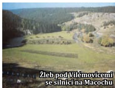
Žleb pod Vilémovicemi se silnicí na Macochu