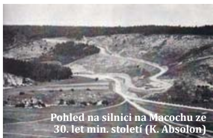
Pohled na silnici na Macochu ze 30. let min. století (K. Absolon)

Na několika následujících fotografiích je vyobrazena část Suchého žlebu pod Vilémovicemi, zachycující proměnu tohoto typického krasového útvaru. Tato část je nejčastěji v pozornosti přírodovědců a fotografů.