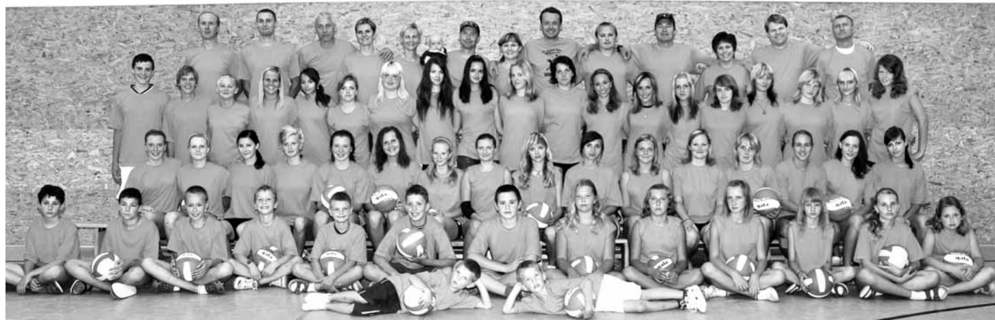
TJ Minerva Boskovice - Volejbalový kemp 2010