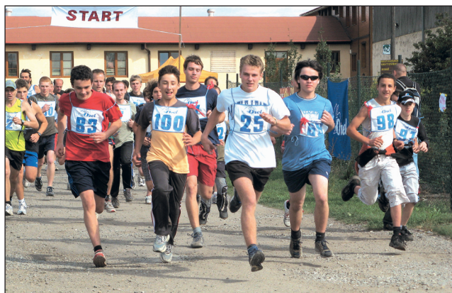
Jde se na to. Start závodu Vísecká desítka.