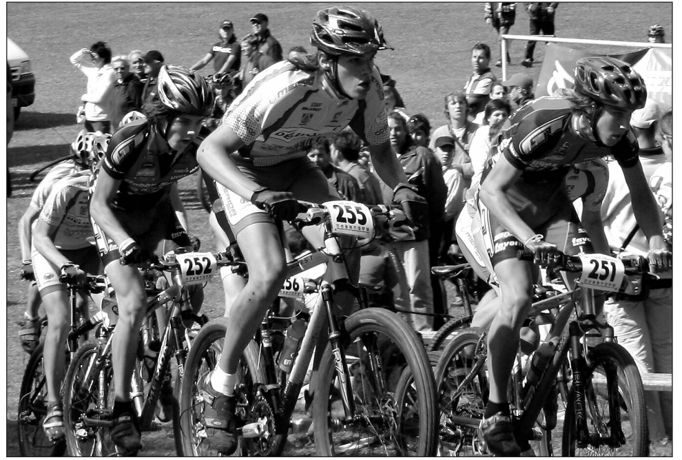
Start. Získat co nejlepší pozici před nájezdem do terénu. Právě se o to snaží junioři.