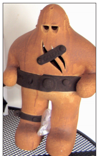
Blanský Golem. Tradiční maratón horských kol odstartuje v sobotu 8. září v 10.30 od haly ASK Blansko. Vítězové si odnesou tradiční trofej.