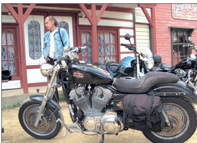
Harley-Davidson. Pistolníky a indiány doplnili poslední prázdninový víkend ve westernovém městečku také milovníci motorek.