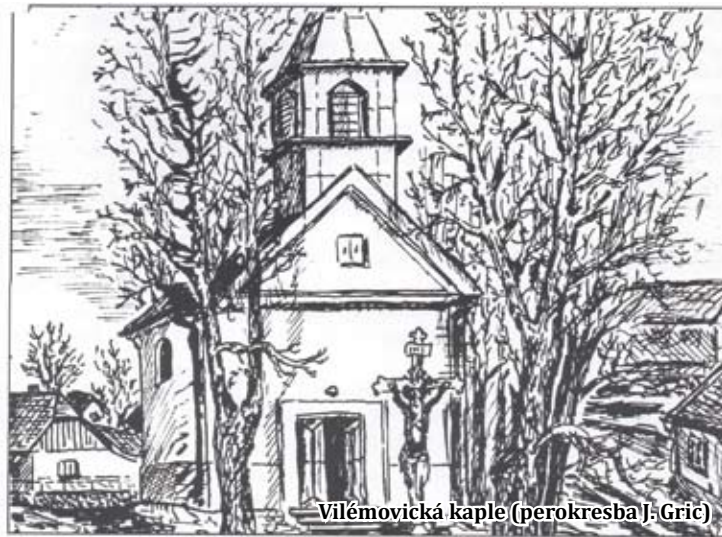
Vilémovická kaple (perokresba) - Gric