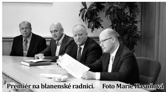
Premiér na blanenské radnici.

Po poledni měl Sobotka na programu návštěvu Boskovic. V tamním Domově pro seniory pobesedoval s jeho obyvateli a zaměstnanci. Na závěr pak zavítal do boskovické firmy Colorprofi. Michal Záboj