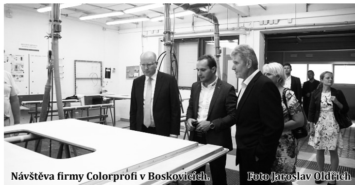
Návštěva firmy Colorprofi v Boskovících.

Ještě před polednem premiéra čekala prohlídka nového vodojemu