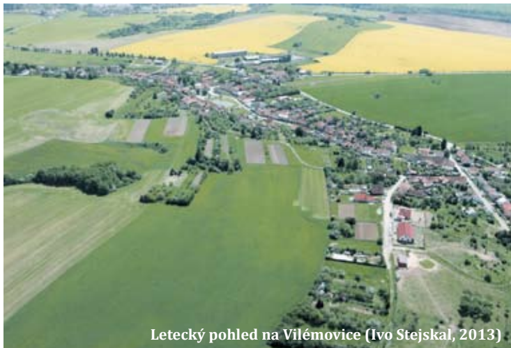
Letecký pohled na Vilémovice (Ivo Stejskal, 2013)

Při příležitosti významného výročí bych se chtěl podělit s čtenáři o moje vzpomínky na život v obci v 50. a 60. letech minulého století.