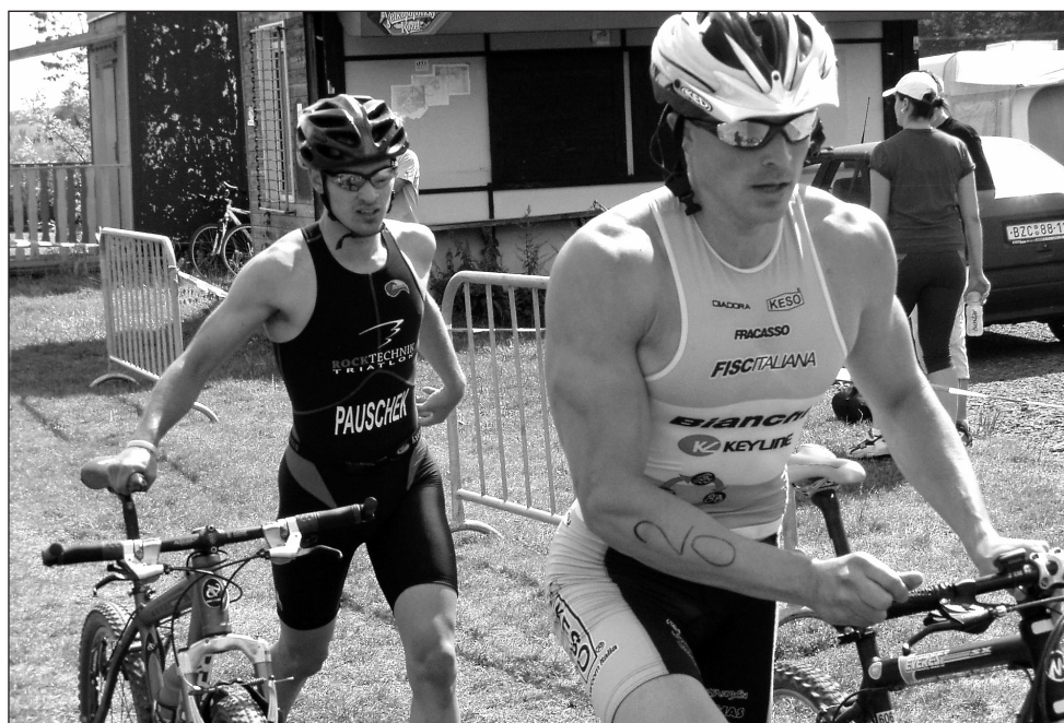
V depu. Z kola sesedali triatlonisté v areálu autokempu Olšovec.