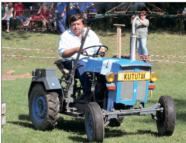
Kututák. Na podomácky vyrobené traktůrky s jezdcí čekala ve Velké Roudce náročná trať.

Asi nejčastěji se objevují kututáky s motory z oktávií nebo traban-