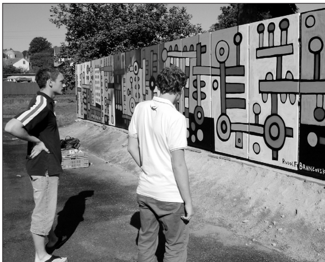
Skate park. Kluci si prohlížejí nové výtvary, které vznikly během týdenního workshopu.

„Na místě jsme pracovali od úterý. Ze začátku jsme tady dělali dva a lidi se chodili dívat, postupně se přidali další. Během