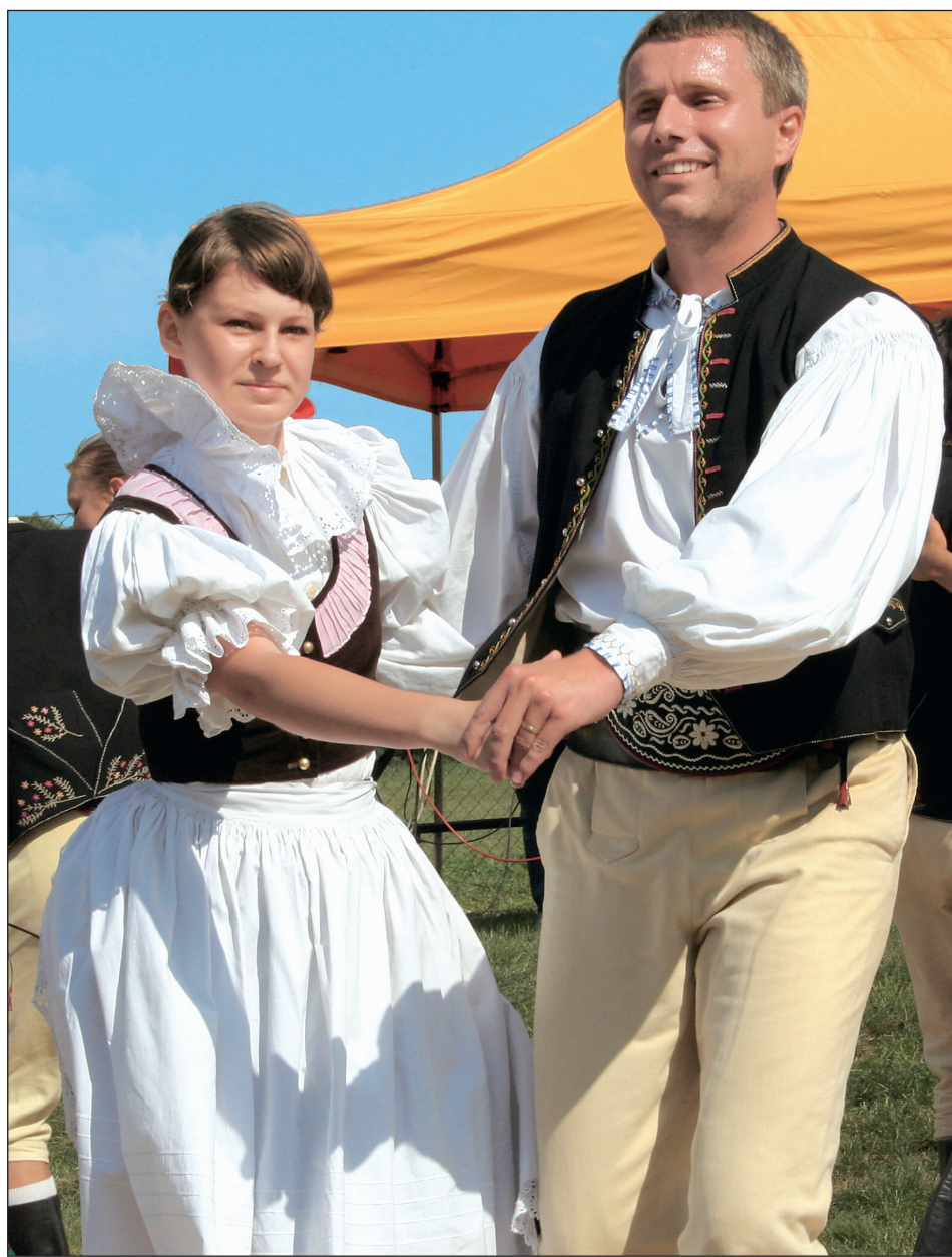
Drahan. Okresní dožínkovou slavnost hostilo agrocentrum Ohrada ve Vískách. V bohatém programu kromě mažorettek, ukázek práce s dravci či westernového ježdění, zatancoval také folklorní soubor Drahan.