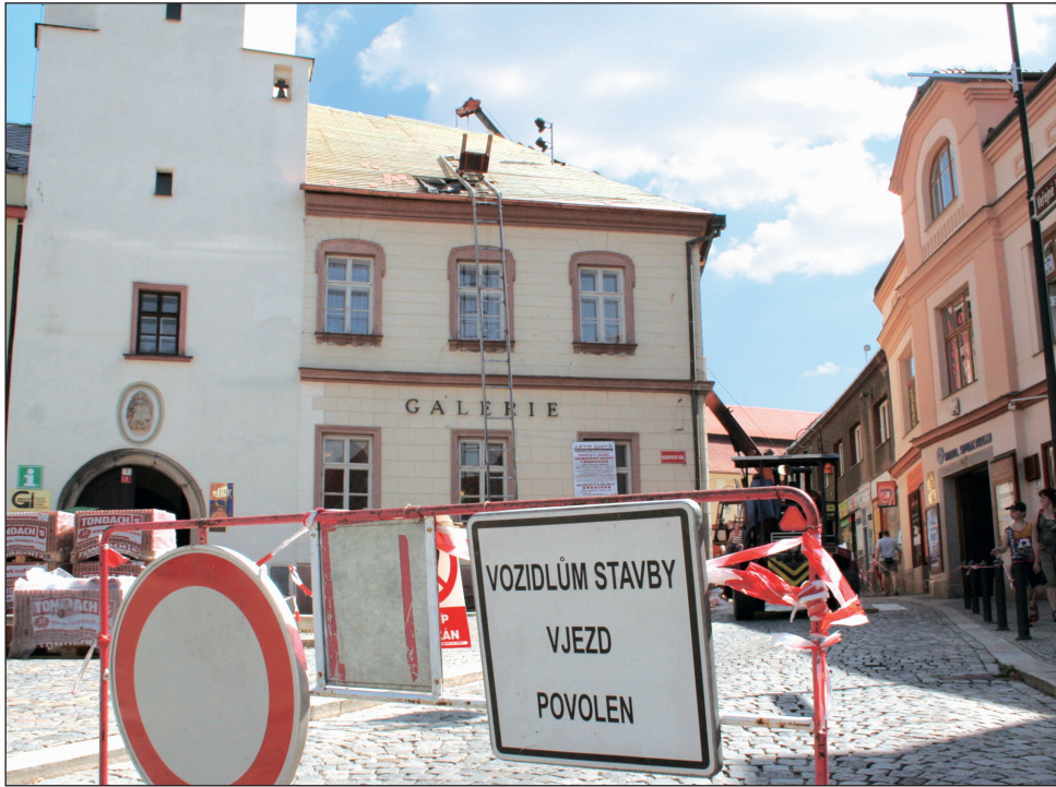
Omezení. Oprava střechy radnice komplikuje i provoz na Masarykově náměstí.

„Opravit by potřebovala i sousední budova, ve které sídlí městský úřad. Směrem do náměstí se už vyměnila okna. Teď by to chtělo vyměnit okna do dvora. Budova by si zasloužila opravu celkově, ale zatím na to nejsou volné prostředky,“ doplnila Vítková.