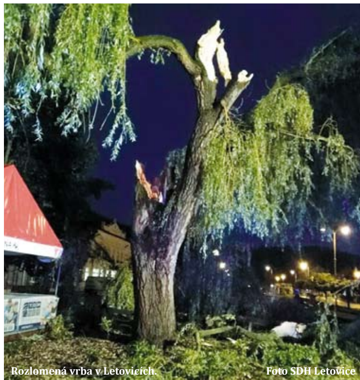
Rozlomená vrba v Letovicích.

V noci ze čtvrtka na pátek hasiči na Blanensku a Boskovicku měli dvakrát tolik zásahů. Zatímco v noci na čtvrtek v celém Jihomoravském