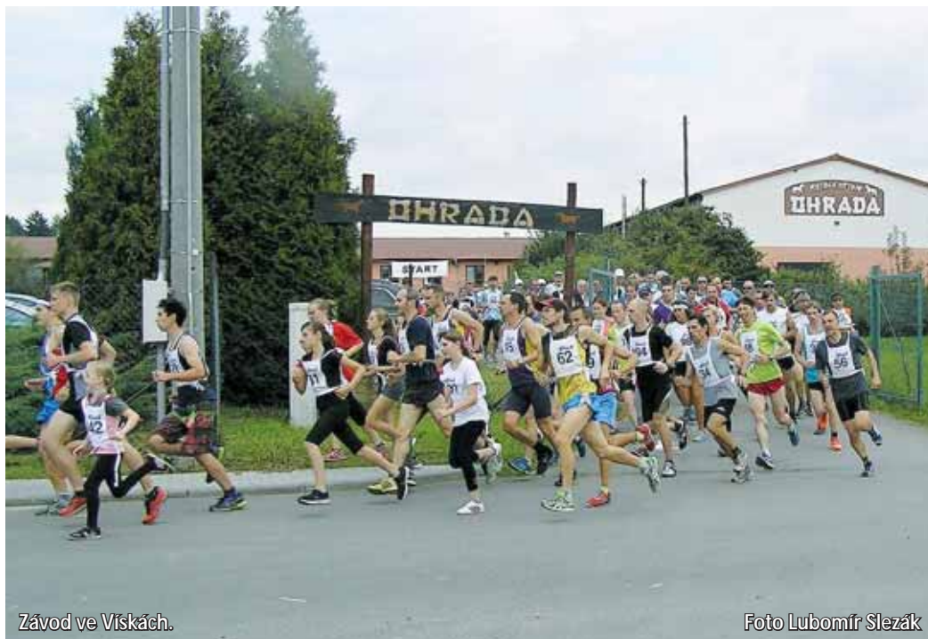
Závod ve Viskách.