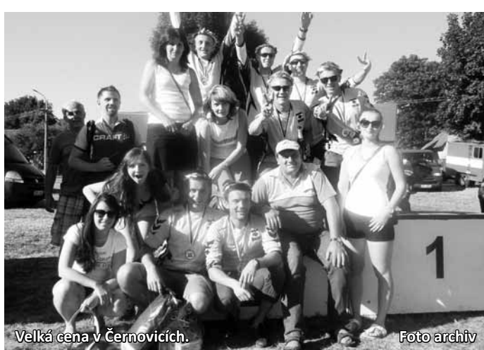
Velká cena v Černovicích.

Klání o nejrychlejší požární útok odstartovali pár minut po dvanácté hodině muži. V konkurenci třiceti čtyř družstev nejlépe obstálo Hluboké z Třebíčska, které zvítězilo s časem 17,34 s, na druhou příčku vystoupala Obora z Blanenska s časem 17,46 s a třetí skončila Nesvačilka z Brněnska, které se časomíru podařilo zastavit v čase 17,58 s.