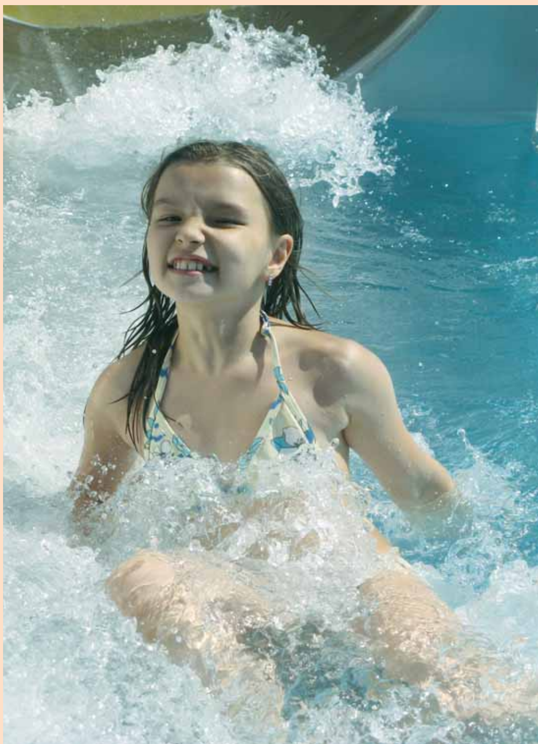
Počasí. Teploty na několika místech minulý týden překročily rekordních 35 stupňů a doslova „vyhnaly“ tisíce lidí k vodě. Plno tak bylo v akvaparcích, na koupalištích, u vodních nádrží i rybníků. Nejvíce se u vody tradičně vyřádí děti.