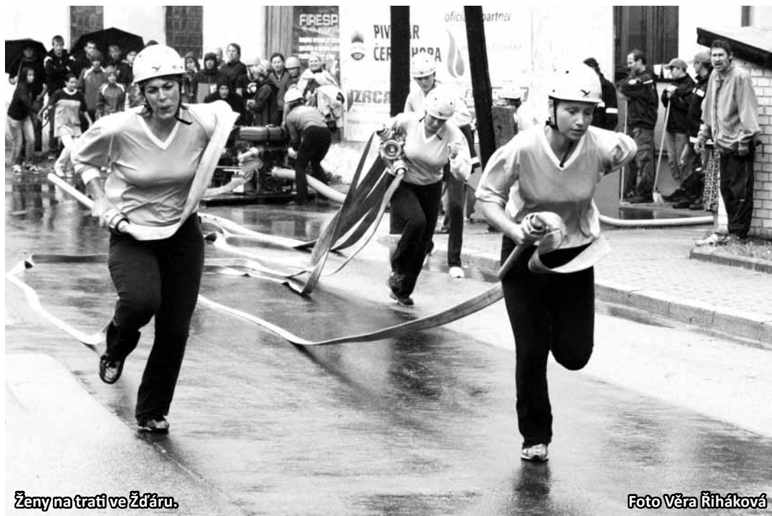
Ženy na trati ve Žďáru.

Výsledky ve Žďáře dopadly ideálně pro diváky Kvasar Cupu. Družstva si rozdělila body tak, že na špičce seriálu se smazaly větší bodové rozdíly a soutěž o zlato začíná v podstatě znovu do nuly. Vždyť rozdíl mezi prvním a desátým místem je jen