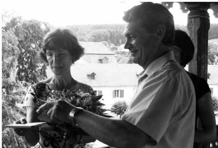
Knihy. Křest knihy na lysické zámecké kolonádě.

„Do Lysic jezdím už dvanáct let. Nejprve za dcerou, nyní už deset let i za vnučkou. Prožila jsem zde spoustu zážitků, dělala jsem si poznamky a když se nastřádaly, říkala jsem si, že bych je mohla dát