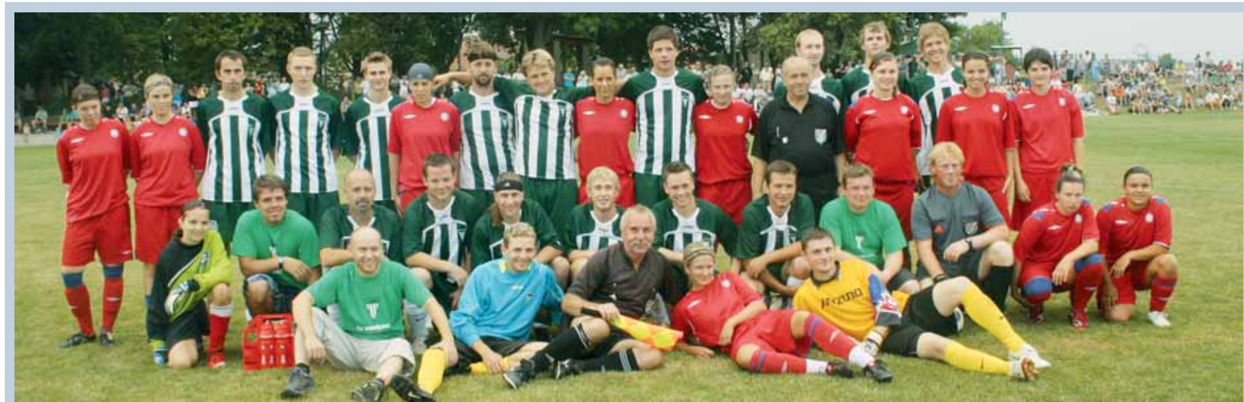
Slavnost. Nabitě sportovní odpoledne měli v sobotu ve Vavřinci. U příležitosti otevření travnaté plochy si to proti domácím rozdali staří páni nad 45 let Sloupu, nad 35 let Doubravice či blanská příprava. Vyvrcholením bylo utkání místních mužů proti ligovým fotbalistkám brněnské Zbrojovky (viz snímek).