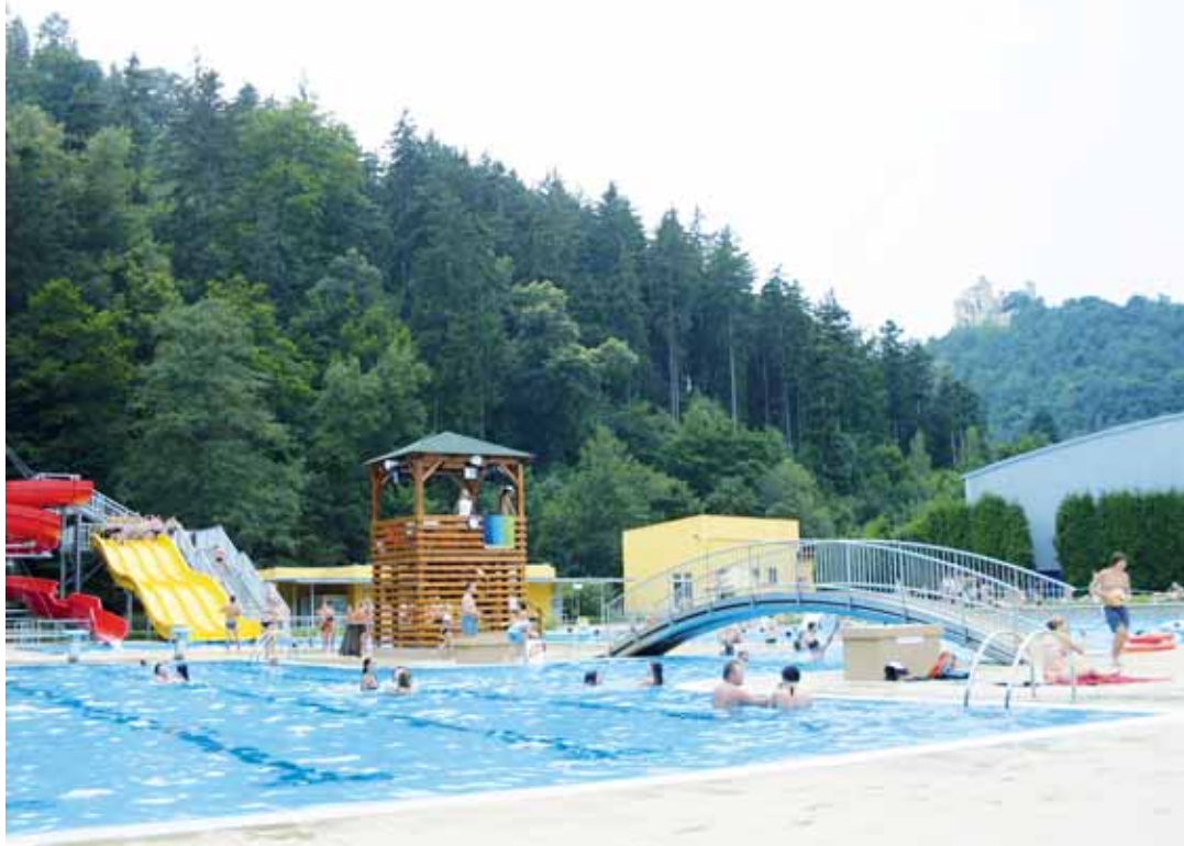
K vodě. Návštěvníky přilákalo i nově opravené boskovické koupaliště.