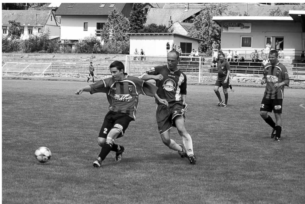
Výrazení. Penaltová loterie poslala z poháru ven Boskovice na úkor Protivanova.