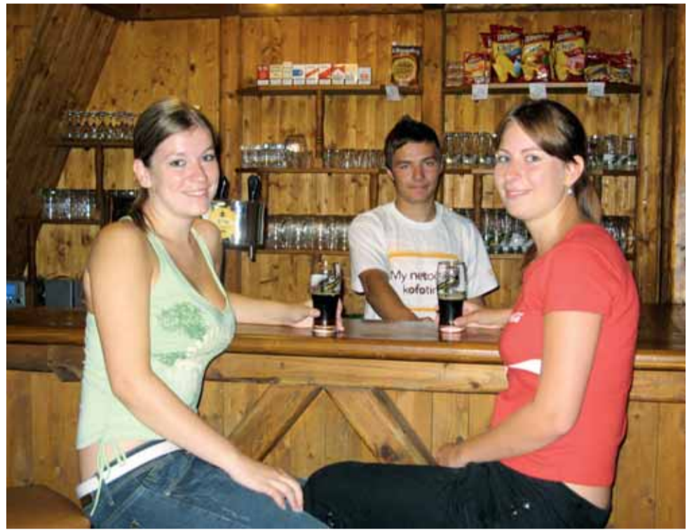
Přijďte k nám. Restaurace na koupališti, to je příjemné prostředí a také ochotný personál.

Než však mohl svoji novou provozovnu otevřít, musel provést několik úprav. „Chvilku to trvalo. Kompletně se zrekonstruovala kuchyň, vymalovalo se tam, nakoupili jsme nové kuchyňské přístroje, upravila se přípravná jídel. Samotná restaurace byla v dobrém stavu. Jen tady nikdo více než půl roku nebyl, tak jsme utřeli prach a opravili podlahu za