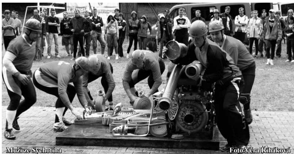
Muži ze Sychotína

Na travnaté dráze zaútočili nejdříve muži. Již výsledky z předchozích kol Kvasar Cupu naznačovaly dobrou formu mužů ze Starého Lískovce (BM). V Lomnici dokázali své ambice přetavit v bronzovou příčku za čas 18,25 s. Po nezdaru ve Žďáře opět zaveleli k útoky na příčky nejvyšší loňští vítězové seriálu ze Stražiska (PV). V sobotu si odvezli body za stříbrnou pří-