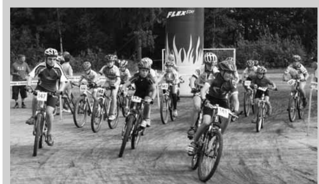
Pohár Dražanské vrchoviny. Velká cena se jela ve Valchově. Na snímku je start mladších žáků.

1. Kumstát, 2. Hirt (oba Ekol Team), 3. Slatinský (Moravské Budějovice), 4. Pospichal Zb. (EKOL Team), 5. Klement (SK Axiom OrBíTt), 6. Kuchařík (Moravské Budějovice), 7. Pospichal V. (EKOL Team), 8. Podborský (TRI LAMY Brno), 9. Křenek (EKOL Team), 10. Petr (Favorit Brno). Ženy: 1. Vykoukalová (EKOL Team), 2. Vozařová (Uherské Hradiště), 3. Jiráňová (Moravská Slavia). Lidový triatlon: 1. Hajdamach (Ráječko), 2. Klement (Auto Cont), 3. Blažek (Bořitov). Ženy: 1. Klimešová (OSTEN), 2. Formánková A. (Kunštát), 3. Floriánová (Brno). (bh)