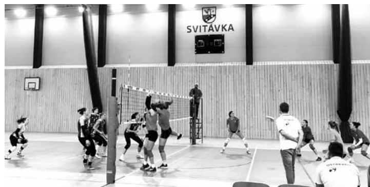
VOLEJBALOVÝ KŘEST. Ve čtvrtek 27. září mohli fanoušci ve sportovní hale ve Svitávce vidět extraligový volejbal. Ženy Králova Pole porazily tým Ostřavy 3:1.