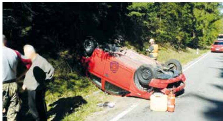
V pátek 28. 9. 2018 vyjeli hasiči k dopravní nehodě u Vilémovic. Mezi Lipovcem a Holštejnem se převrátilo osobní auto na střechu. Uvnitř cestovala jedna osoba, kterou nebylo třeba vyprošťovat.