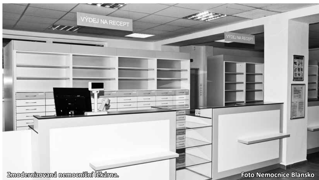
Zmodernizovaná nemocniční lékárna.

„Rekonstrukce lékárny probíhala ve dvou etapách. První etapa zahrnovala rekonstrukci výdejny léků pro nemocniční provoz a prodejny zdravotnických potřeb. V prostorách byla provedena kompletní výměna elektroinstalace, rozvodů vody, ústředního