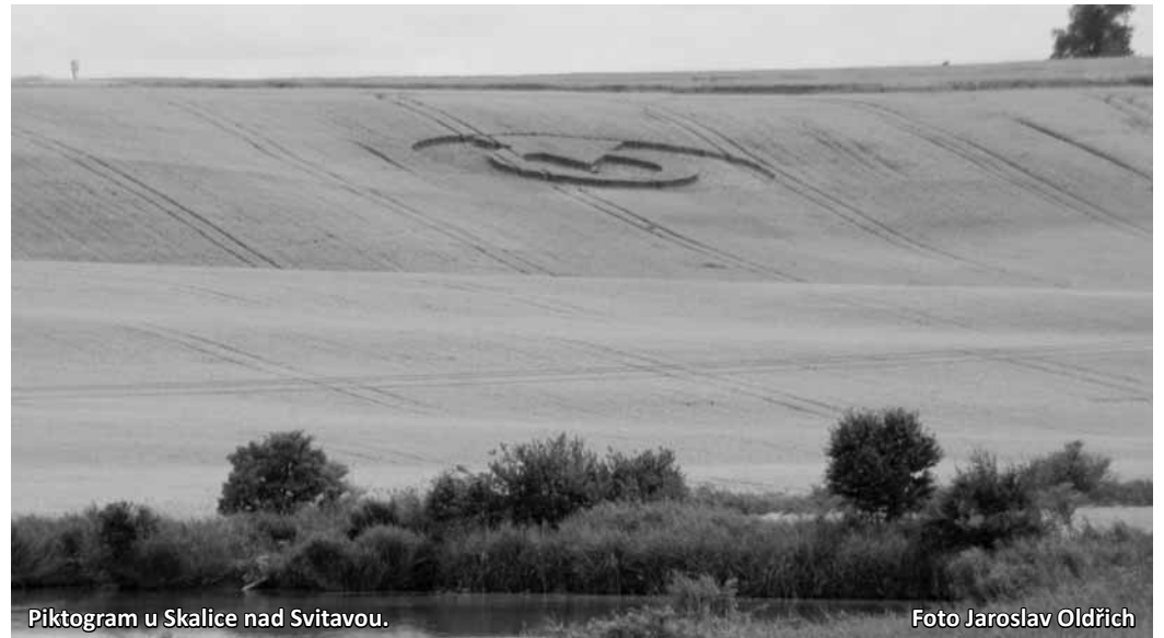
Piktoqram u Skalice nad Svitavou.

Na místo pak proudily stovky lidí. Přímou v kruhu se konala také