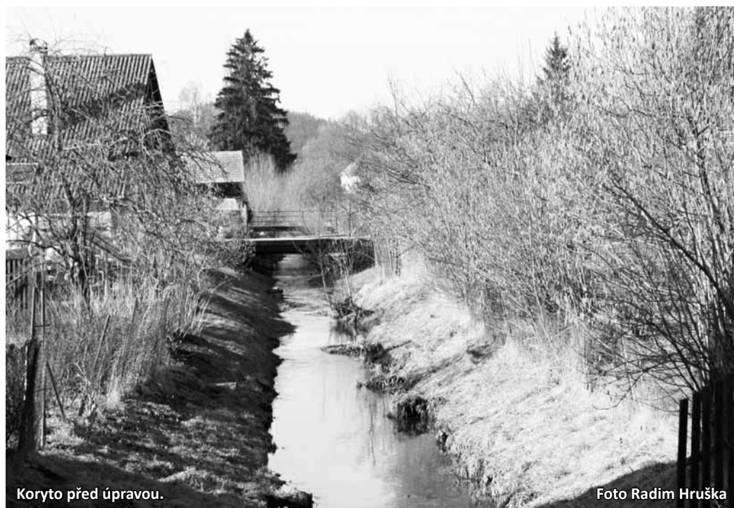
Koryto před úpravou.

Po vyčištění by koryto po úpravách mělo ustát dvacetiletou vodu. V praxi to znamená, že budou muset být odtěženy všechny naplaveniny a potok by se měl vrátit do podoby z roku 1934. V levé části koryta navíc vznikne třímetrový pás, který bude scho-