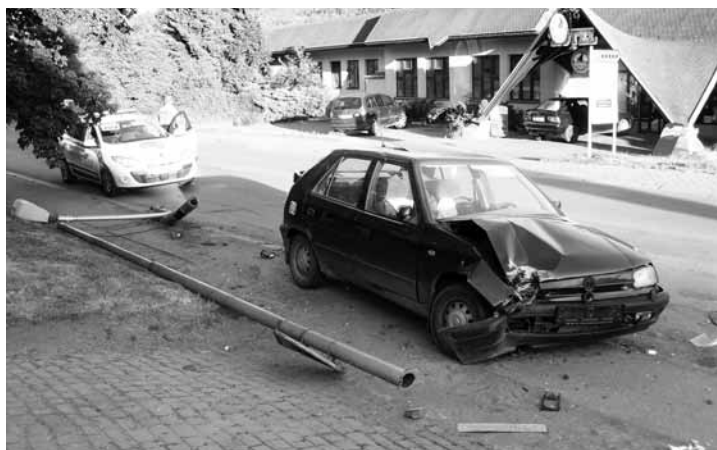
Nehoda. V pátek 9. července došlo k havárii v boskovické Dukelské ulici. Řidič narazil do sloupu veřejného osvětlení.

Dolní Lhota - Škodu ve výši třicet tisíc korun způsobil zloděj v pískovně v Dolní Lhotě. Během víkendu tam totiž ukradl devadesát metrů měděného kabelu. (hrr)