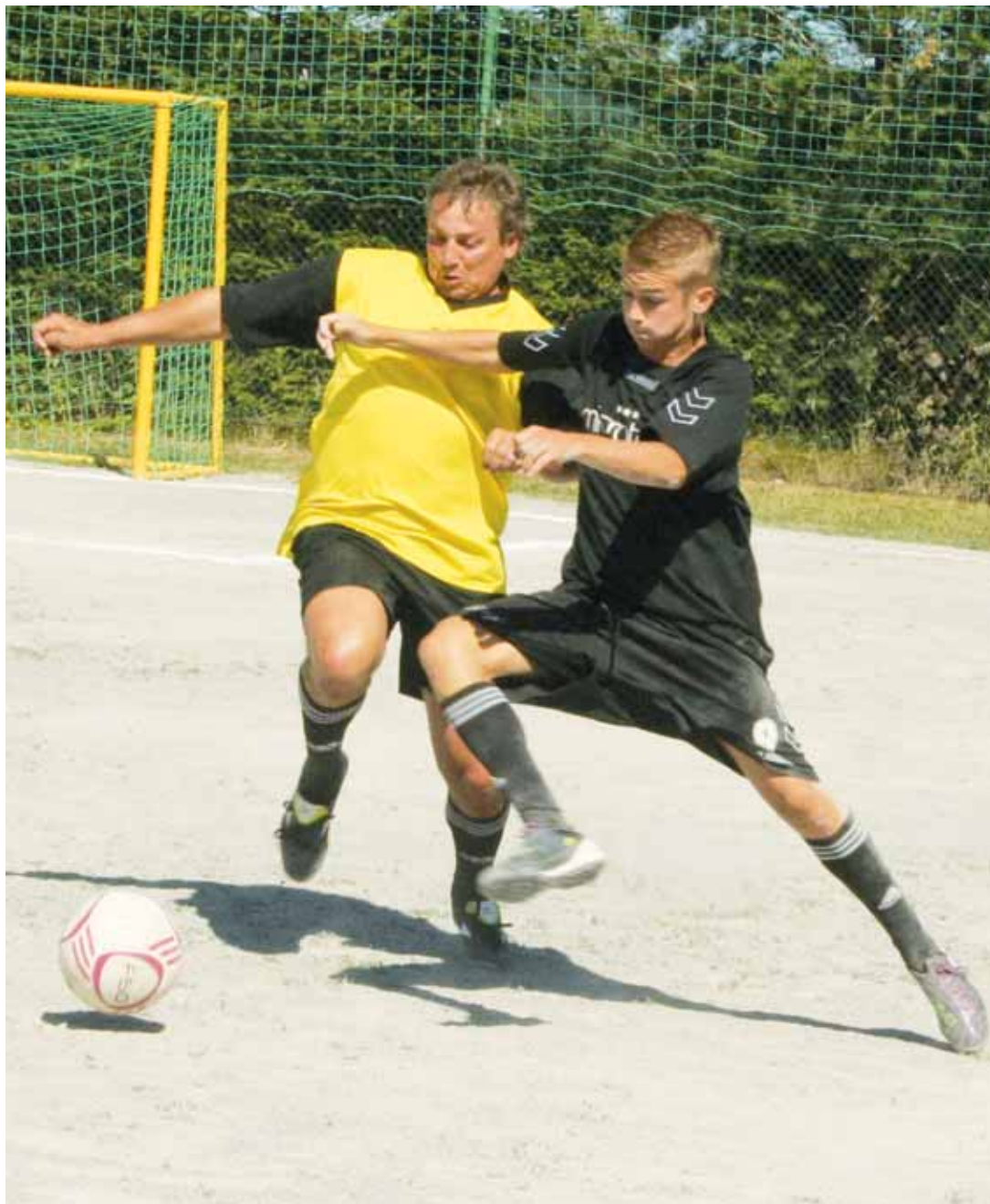
Finále. O výhru v letošním Poháru týdeníku Zrcadlo bojovala v Okrouhlé mužstva z Lomnice a Lhoty u Lysic.