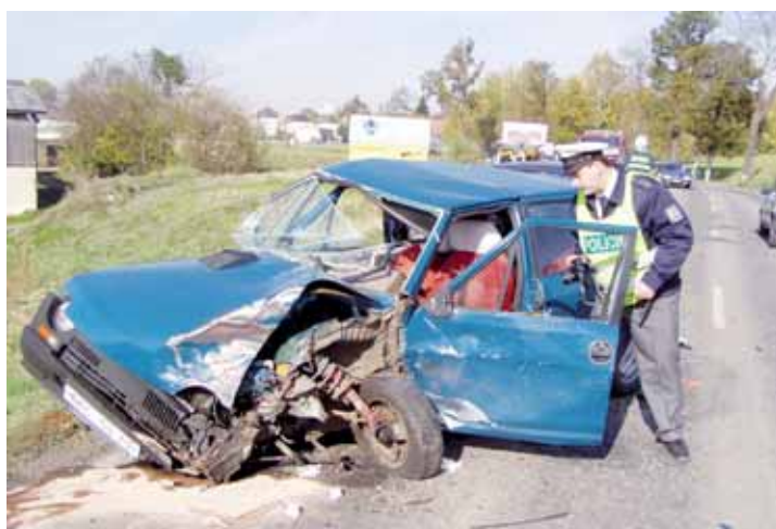
Nehoda. Neopatrnost za volantem končí v řadě případů tragicky.

Ani uplynulý víkend nebyl na silnicích klid. O nezdůvodnosti některých řidičů svědčí například výsledky policejní akce, která se v neděli 11. července soustředila na rozjezd účastníků Street Dance