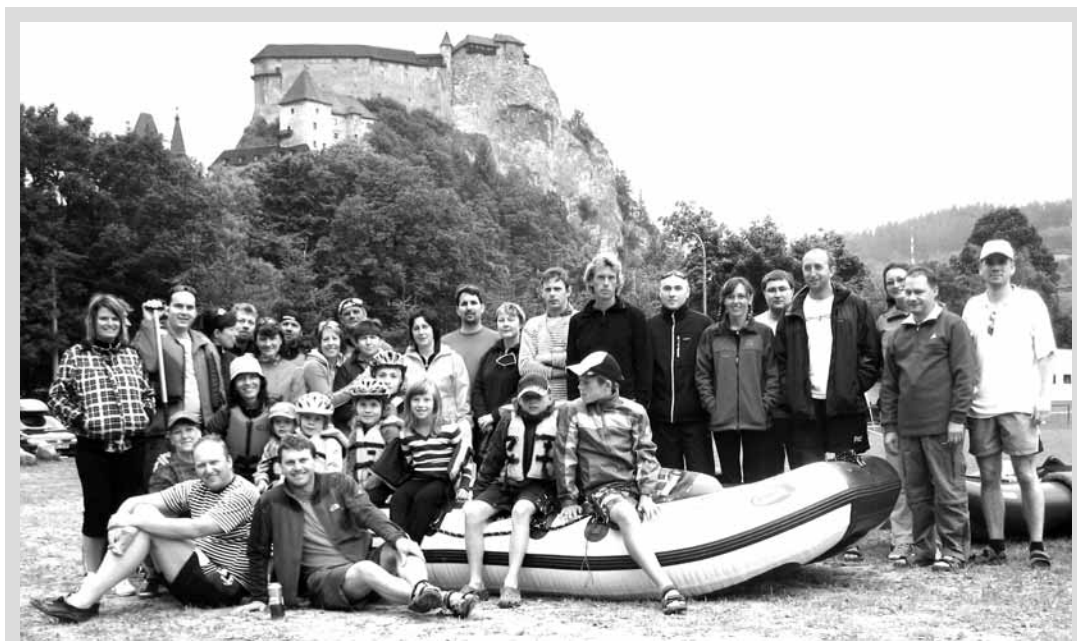
Prázdniny. V průběhu prodlouženého víkendu se blanenští studenti Vysoké školy mezinárodního podnikání a příznivci vodáckého sportu zúčastnili vodáckého kurzu na slovenské řece Oravě. Splav byl dlouhý 61 km po svižné a krásné meandrující řece, jedinečnou přírodou severozápadního Slovenska. Na závěr proběhla prohlídka Oravského hradu, který patří k nejkrásnějším a nejnámějším památkám Slovenska. Jan Hrnčíř

Věci veřejné, TOP 09 a další strany představí svoje kandidáty v nejbližších dnech.