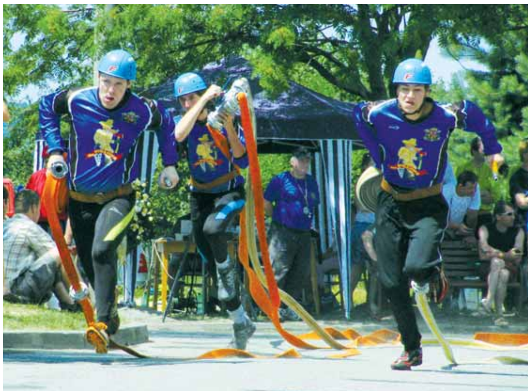
Útok. Závodníci absolvují trať v Šošůvce.

V mužské kategorii šlo stranou veškeré taktizování. Důkazem toho je šest nedokončených útoků. Kvůli umístění těsně za stupni vítězů si udrželi vedení v seriálu muži ze Sychotína. Bronzovou příčkou zatroubili do útoku na titul loňští vicemistři z Maršovic. Tentokrát měl jejich čas hodnotu 18,74 s. Velká spokojenost vyzářovala z borců ze Starého Lískovce SPORT (BM), kteří si za čas 18,54 s odvezli stříbrný pohár. Překvapením jsou muži z Lipové (PV). Bodový přísun za první místo (18,49 s) je katapultoval na průběžnou druhou příčku Kvasar Cupu.