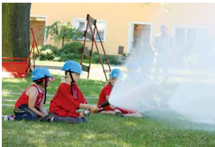
Družba. Mladí hasiči předvedli v neděli dopoledne hostům z Borotína útok i štafetu.

„Víkend se opravdu vydařil. V sobotu proběhly sportovní a kulturní akce jako přátelské utkání v malé kopané nebo zápolení na lávce přes koupaliště. Večer samozřejmě