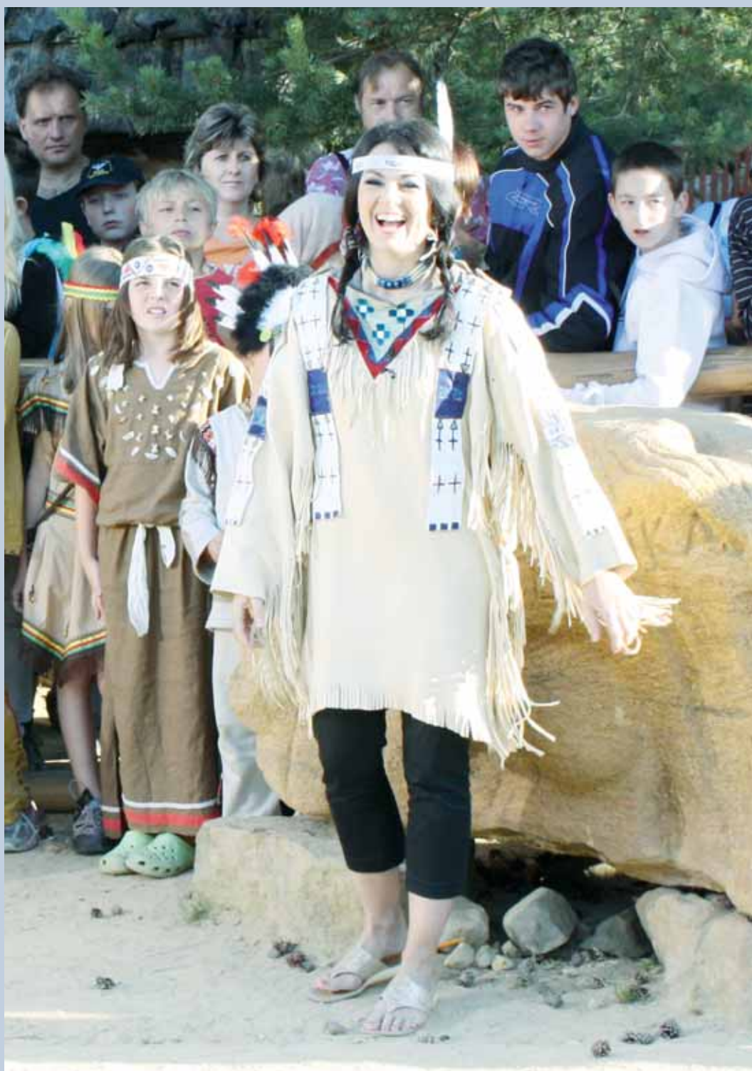
Natáčení. Boskovické westernové městečko zažilo minulý týden natáčení Snídaně s Novou na cestách. V indiánském duchu probíhala i předpověď počasí (viz foto). Více fotografií na str. 3