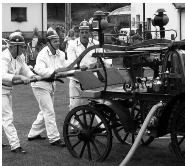
Oslavy. Sobotní odpoledne patřilo ve Skalici ukázkám hasičské techniky.

Oslavy pokračovaly v sobotu už od rána Dnem otevřených dveří na hasičské zbrojnici. „Vystavili jsme tam techniku a připravili jsme i výhledkové