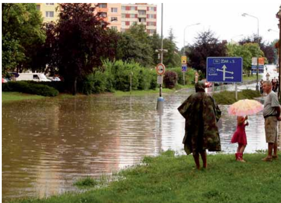
Velká voda. Už po několikáté v poslední době potrápily přívalové deště Boskovice. Obrovská vodní laguna se vytvořila na křižovatce ulic Komenského a Vodní.

V úterní podvečer se velká voda prohnala Boskovickem. Nad městem se strhla průtrž mračen, chvílemi doprovázená kroupami. „Trvala déle, než dosavadní letošní bouřky, a proto jsou i následky rozsáhlejší. Škody na majetku města se týkají hlavně bytů v Hybe-