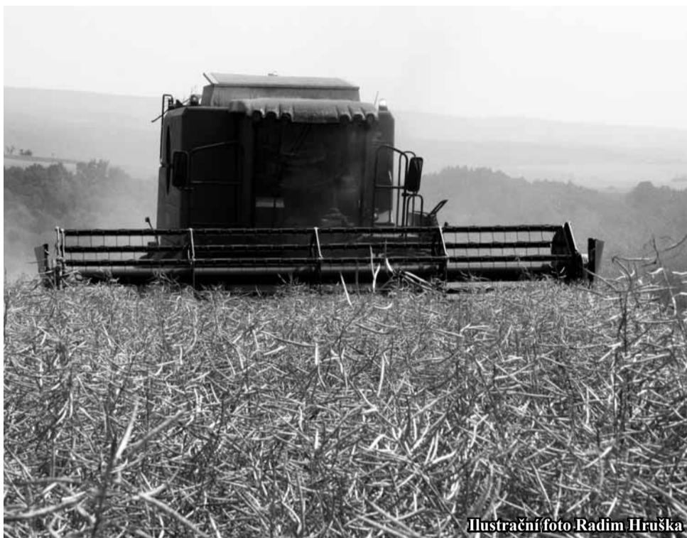
Ilustrační foto Radim Hruška

Pokud jde o obiloviny, nejdříve za 14 dnů vyjedeme do porostů pšenice. Pokud je „normální“ rok, co se týká počasí,