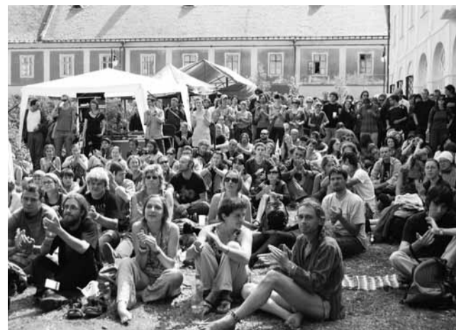
Za muzeem. Tradiční oblíbené návštěvníků se těší hudební scéna za boskovickým muzeem.