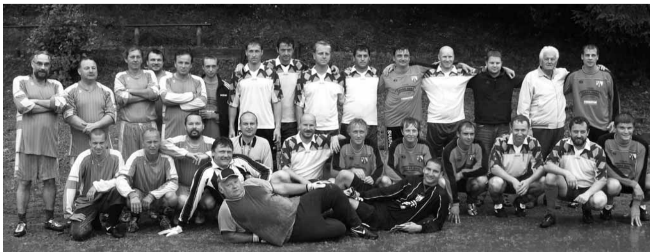
Oslavy. Účastníci exhibičních utkání na společné fotografii.

„nadělil“ vítězství v poháru malé kopané, Memoriálu Josefa Rybára O pohár týdeníku Zrcadlo. První místo znamená znovu možnost startu na republikovém turnaji – Poháru vítězů pohárů.