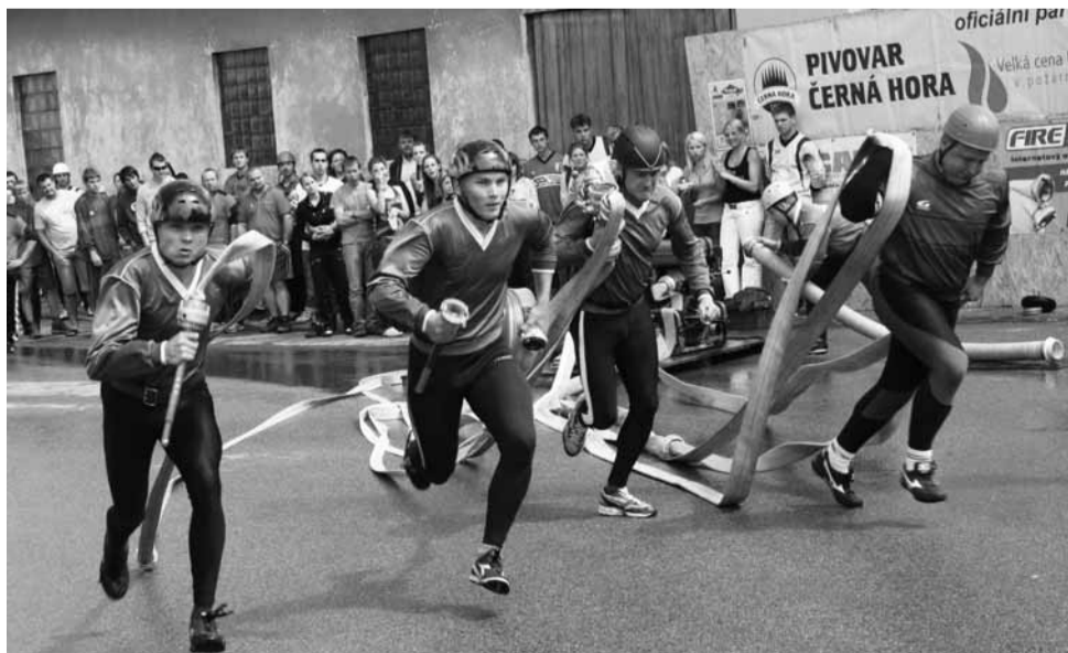
Po startu. Trať ve Žďáru patří kvůli stoupání k nejtěžším ve velké ceně.

Jak bývá na asfaltových tratičkách zvykem, první odstartovaly ženy. Přijelo celkem třináct týmů. Na dřívější úspěchy zavzpomínaly ženy ze Sebranice a za čas 21,71 s si odvezly třetí místo. Stříbrnou příčkou si upevnily vedení v Kvasar