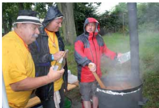
Vydařená akce. Přes nepříznivé počasí si gurmáni na akci Doubravický guláš přišli rozhodně na své.

Ke kotlům se letos postavilo rekordních sedmáct týmů. Celou akci moderoval skvěle Pavel Kašpar z rádia Petrov. Právě on ji fundovaně představil. „Nápad byl převzat z Rakvic,“