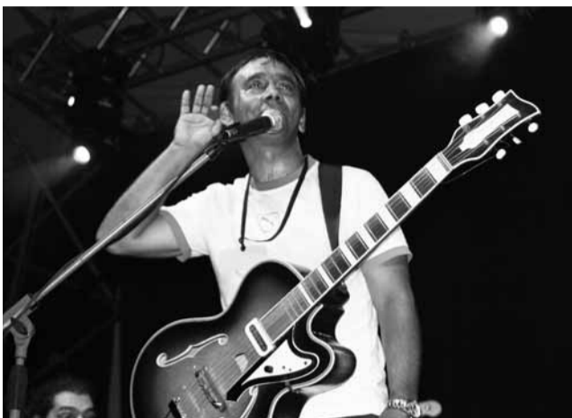
Hudba. Vystoupila i kapela Terne člave, která míchá romské melodie s jazzem, flamenkem a dalšími styly.