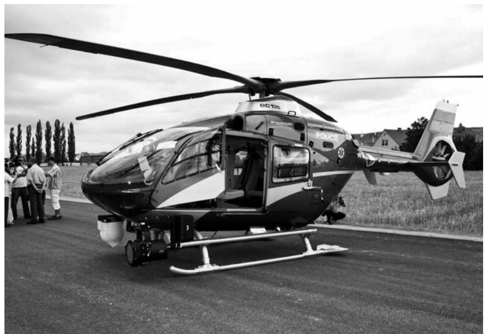
Vrtulník. Policistům pomáhal při akci také vrtulník, který zachytil například nebezpečné předjíždění.

Na Blanensku policisté zastavili také jednoho řidiče pod vlivem alkoholu, u něhož dechová zkouška ukázala 1,19 promile. Pětatřicetiletý řidič je tak podezřelý ze spáchání trest-