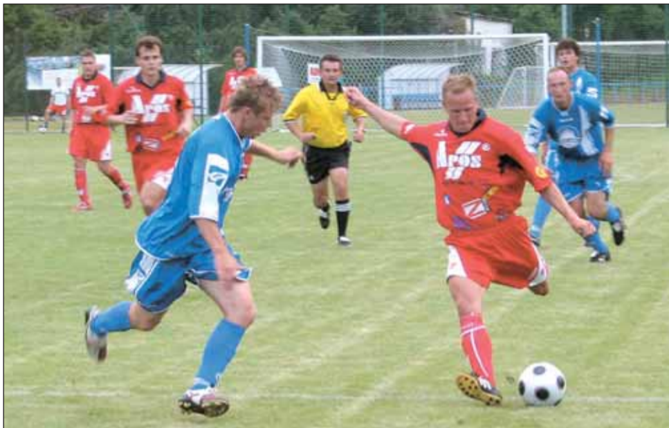
Turnaj. Ve finále boskovického turnaje se utkali domácí s rivalem z Blanska.