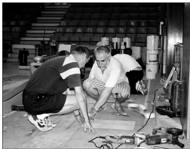
Pomoc. S přípravnými pracemi před položením nových drah pomohli členové a činovníci tělovýchovné jednoty.