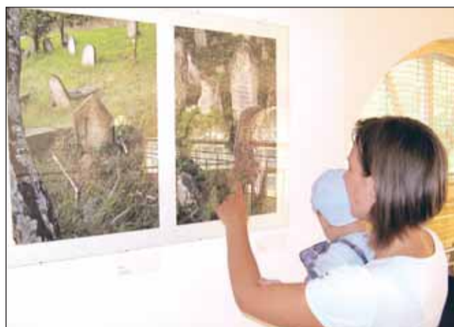
Výstava ve skleníku. Boskovický Zámecký skleník patřil během čtyř dnů festivalu fotografiím Ivana Prokopa. Ten se zabývá hlavně hudební a divadelní fotografií. Je autorem obalů audiovizuálních nosičů. Vystavený cyklus fotografií je výběrem z rozsáhlé kolekce mapující prolínání židovské a křesťanské kultury v tuzemsku.