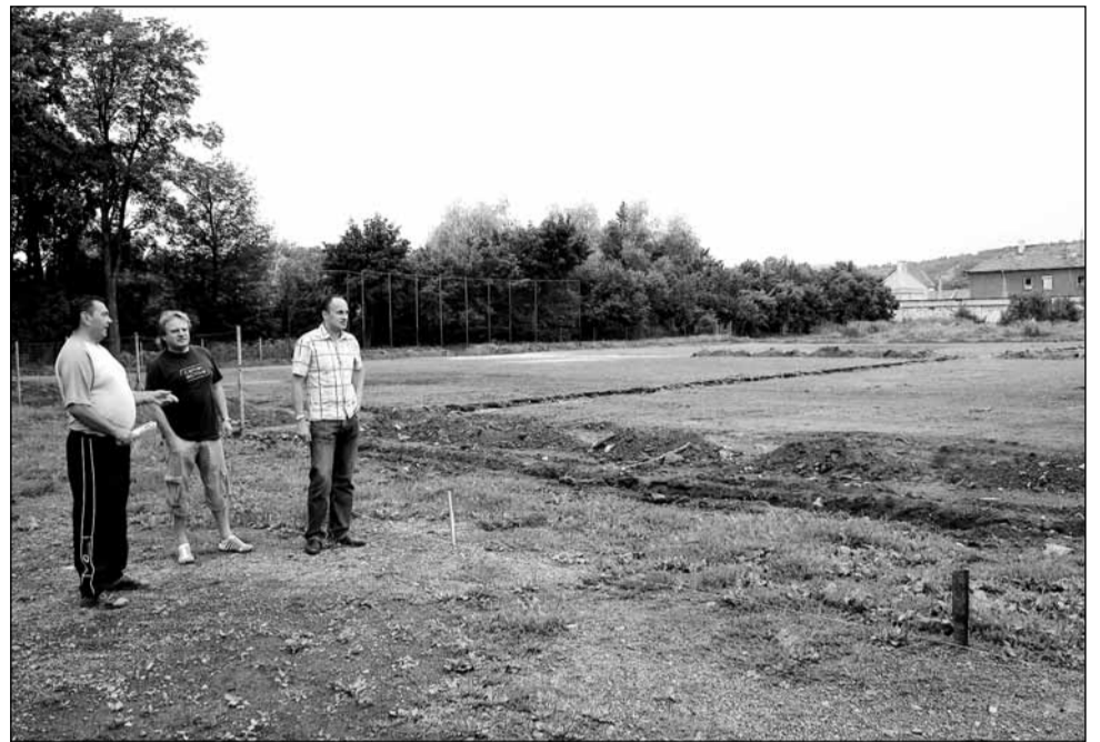
Rekonstrukce. Vedení radnice ve Svitávce se rozhodlo fotbalistům pomoci k nové travnaté ploše. Přípravné práce začaly.

„Práce s mládeží byla u nás v poslední době na výborné úrovni. Radnice se především proto rozhodla pomoci a zastupitelstvo schválilo položku v rozpočtu ve výši necelých čtyřicet tisíc na rekonstrukci,“ potvrdil starosta. Jak řekl, počítalo se ale se spolufinancováním z dalších zdrojů. Ty se vedení Moravanu podařilo zajistit. „Bylo nám sice jasné, že žádnou astronomickou sumu nezískáme, nicméně z prostředků kraje jsme obdrželi sto osmdesát tisíc korun, z našich zdrojů př-