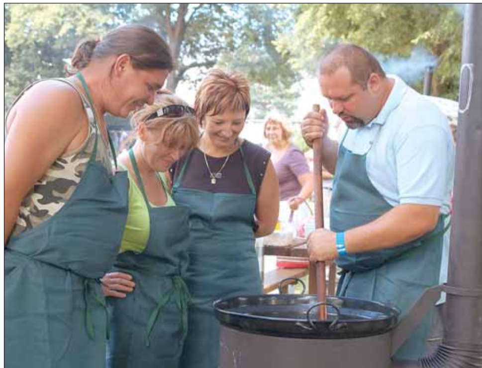
V akci. Zbýšovští přijeli do Doubravice vařit srnčí guláš. Povedl se.