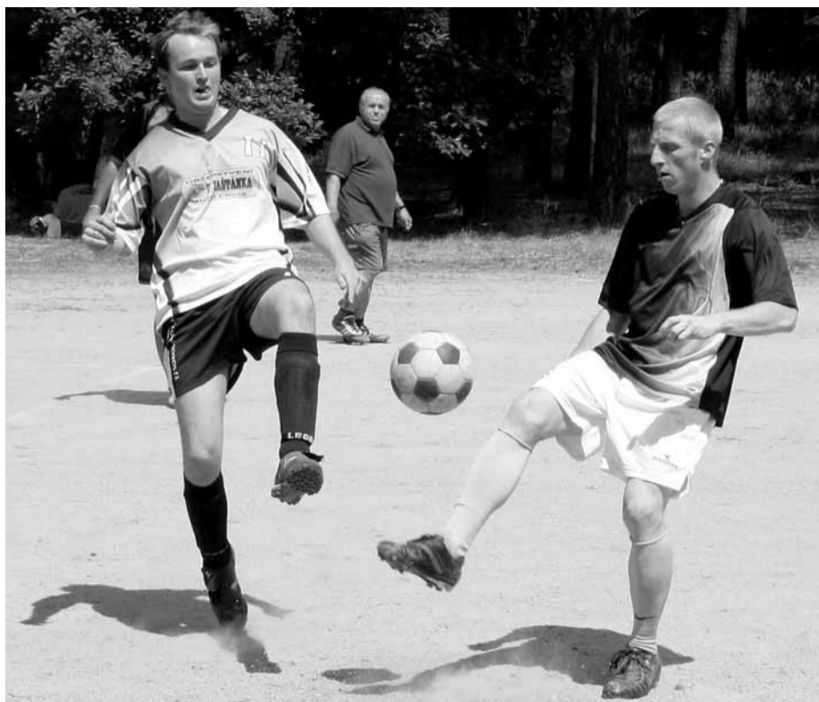
Tradiční turnaj. Pohár vítěze prázdninového turnaje v Karolíně zůstal doma. KANAP vyhrál před Hokejkami Blansko a celkem FOFO Štěpánek.