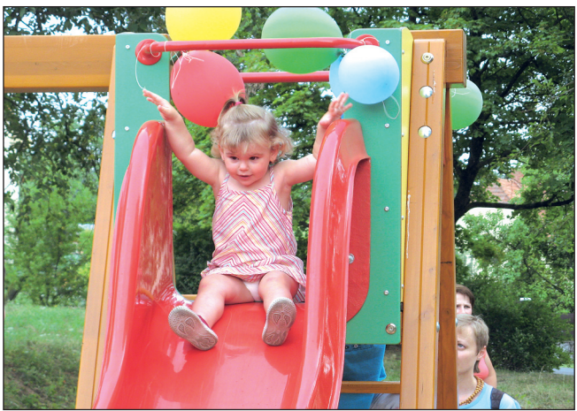
Slavnost. Středeční odpoledne bylo v Klepačově ve znamení malého svátku. Na pozemku ve vlastnictví města si zde místní vybudovali za finanční pomoci radnice malé dětské hřiště, které v tento den slavnostně otevřeli.