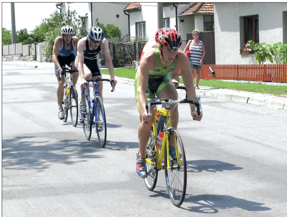
Vedoucí skupina. V cyklistické části se na čele záhy utrhl čtyřčlenná skupina, z níž vzešel i vítěz dalšího ročníku Vysočanského triatlonu.