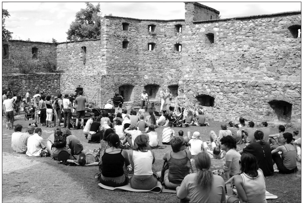
Divadlo. Boskovický hrad patřil celý víkend divadlu. Hradby vytvořily výbornou kulisu.

Už se tam toho spousta zlepšila, každý rok přibude něco nového, a proto ty skoky už nejsou tak velké. Když se pak člověk podívá na starší fotografie, kde je ta čtvrť zachycena, tak si uvědomí,