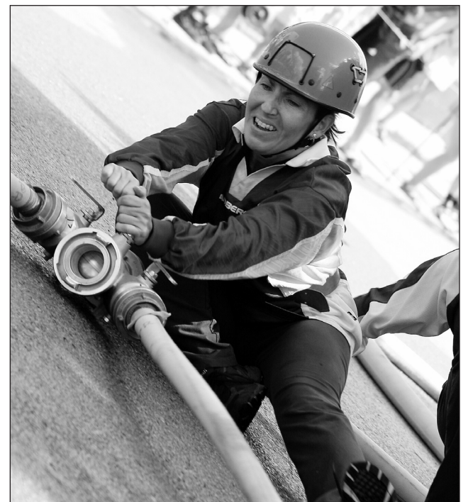
Úsilí. Jedna ze soutěžících závodů ve Žďáru.

Příští týden nás čeká soutěž v Černovicích, na kterou srdečně zveme všechny příznivce požárního sportu. Kompletní výsledky naleznete na www.vc-blanenska.com .