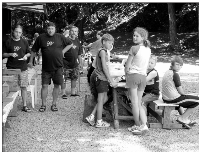
Tábor. Děti z Hlučína i jejich vedoucí jsou ve Sloupě spokojeni.

I Ostraváci mají vždy „cetéháčko“. Jejich letošní celotábo-