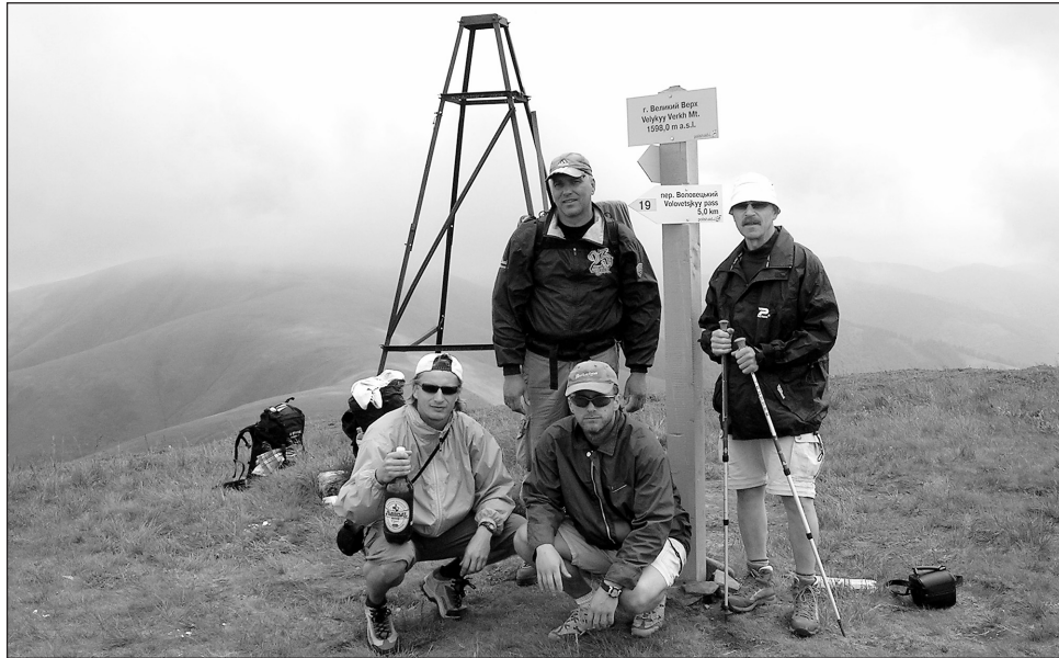
Výstup. Cestovatelé na jednom z vrcholů ve výšce 1598 metrů nad mořem.