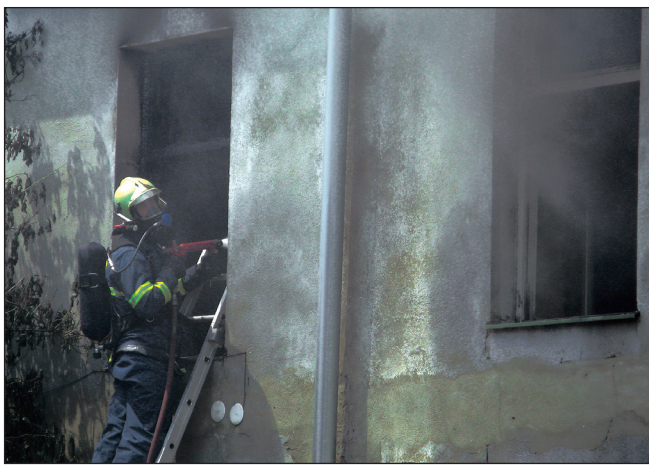
Požár. Ve středu hořelo v předzámčí blanenského zámku. Příčina je v šetření, pravděpodobně ale půjde o nedbalost při používání otevřeného ohně nebo kouření, řekl vyšetřovatel blanenských hasičů Antonín Pivoňka. Při požáru došlo ke zranění dvou osob.