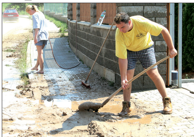
Likvidace následků. Lidé v Rájci-Jestřebí celou sobotu odklízeli od svých domů naplavené bahno.

„Zhruba od jedné hodiny v noci začalo silně pršet. Co se týká Jestřebí, po několika hodinách se z ulic