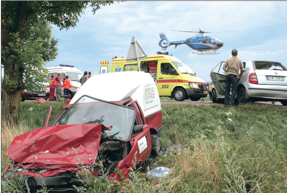
Nehoda. Čtyři zranění, z toho dvě těžká, si vyžádala vikendová nehoda u Bořitova. Jedenapadesátiletý řidič Škody Fabie nepřizpůsobil rychlost jízdy dešti, vjel do protisměru a tam se čelně střetl s protijedoucím pickupem. Za ním jedoucí řidič Fordu Mondeo chtěl zabránit střetu, prudce brzdil a skončil v příkopu.