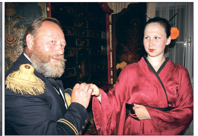
Historie. Na život spisovatelky Marie von Ebner-Eschenbach, rozené hraběnky Dubské, zaměřili noční prohlídky v lysickém zámku. Návštěvníci se seznámili s jejím pestrým životem, jehož část prožila právě na tomto historickém objektu.