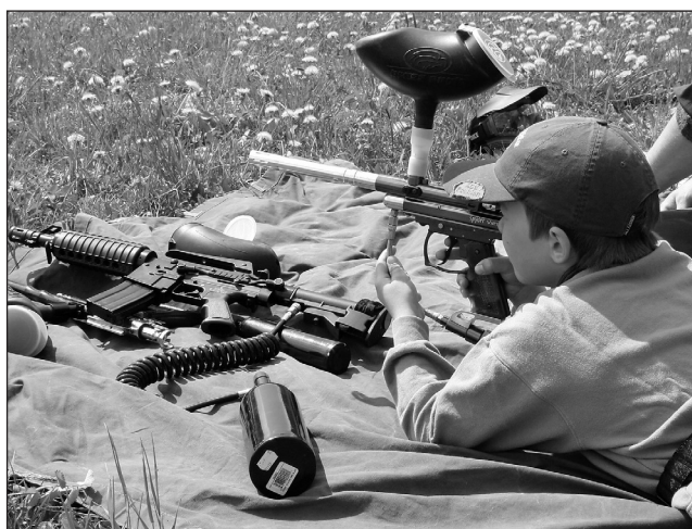
Atrakce. Jednou z vyhledávaných atrakcí je kromě terénních kár také paintball.

Příští rok by se měla nabídka pro návštěvníky ještě rozšířit. V Oleš-