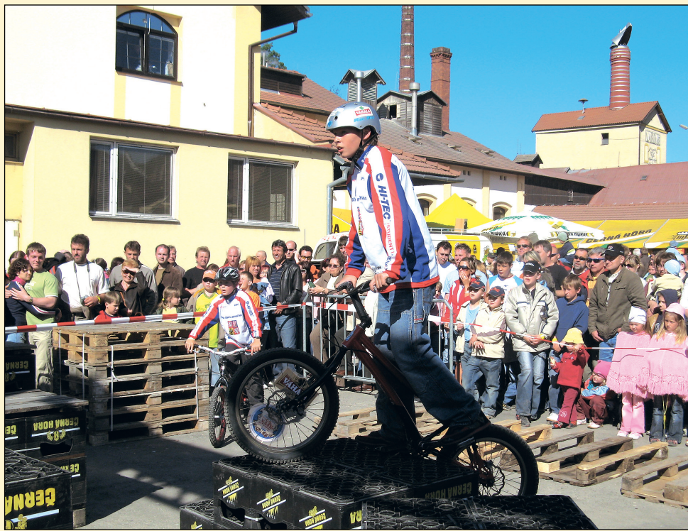
Exhibice. Blanenští reprezentanti se představili na exhibičním vystoupení v rámci Pivního máje.

odvětví. Místem konání je areál přehrady Palava a přilehlé terény v lese. Na startu budou v barvách