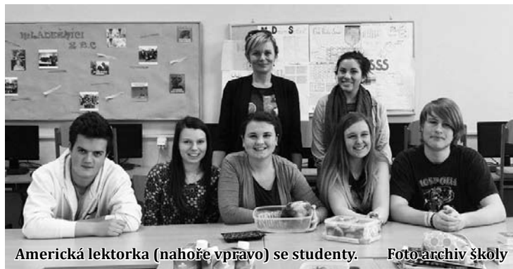
Americká lektorka (nahore vpravo) se studenty.

Dostala jsem tuto možnost od programu Fulbright, který umožňuje studentům, kteří dokončili vysokou školu, studovat, učit nebo provádět výzkum v cizí zemi. Přihlásila jsem se do učitelského programu, který