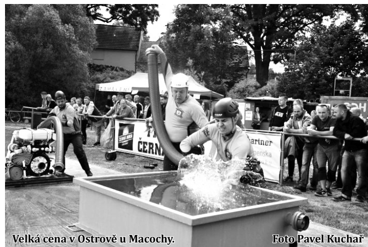
Velká cena v Ostrově u Macochy.