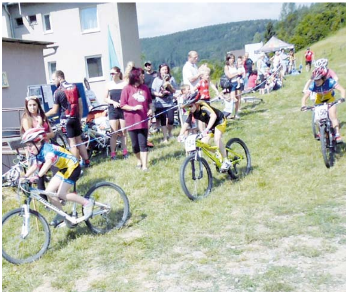
POHÁR DRAHANSKÉ VRCHOVINY. Minulý týden se bikeři sešli hned na dvou kláních v rámci tohoto poháru. Nejprve se v netradičním termínu 5. července jel osmý závod v Benešově, v sobotu 9. července se po jednorozhodnutí odmlce Pohár Dražanské vrchoviny vrátil do Březové nad Svitavou.

1. kolo - neděle 7. srpna v 17:00: Veverská Bítýška/Lipovec/Rudice - Boskovice, Vilémovice/Kohoutovice/Rájec-Jestřebí - Ráječko, Jedovnice/Kunštát - Tišnov. (les)