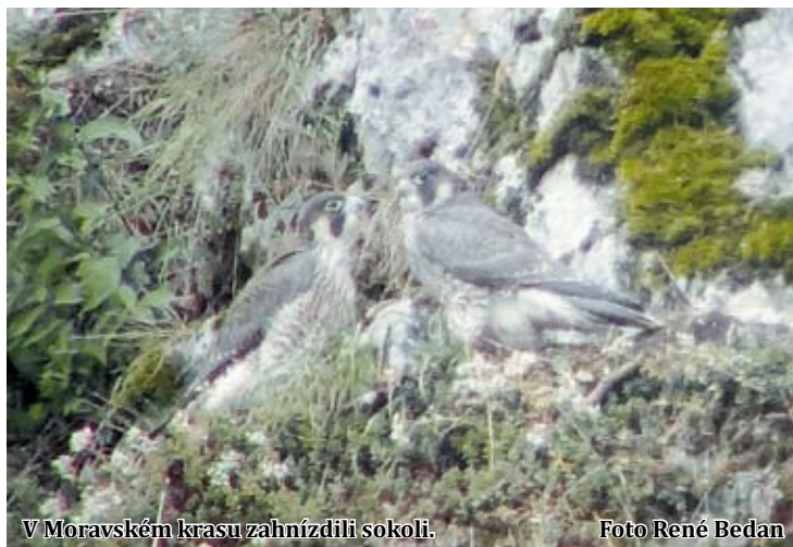
V Moravském krasu zahnízdili sokoli.