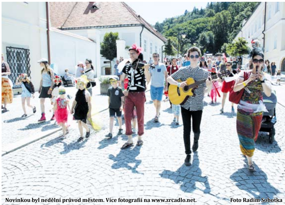
Novinkou byl nedělní průvod městem. Více fotografií na www.zrcadlo.net .