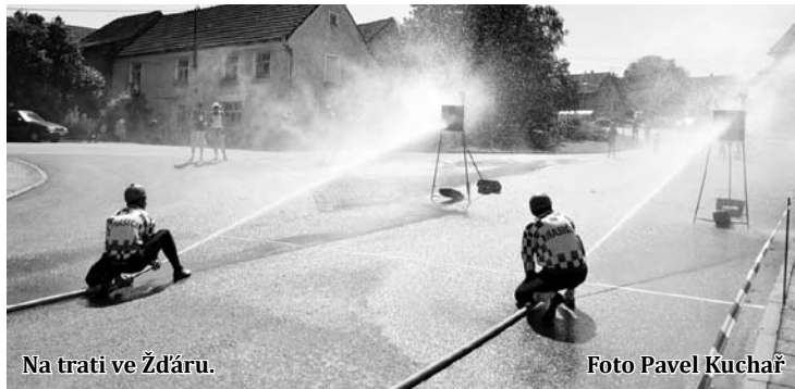
Na trati ve Žďáru.

Nejbližší soutěž Velké ceny Blanenska v požárním útoku proběhne v neděli 24. července v Paměticích. Broňa Zhořová