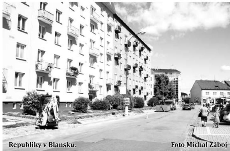
Republiky v Blansku.