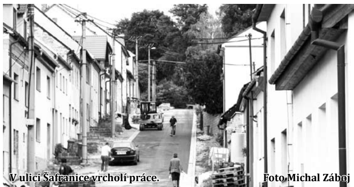
V ulici Šafranice vrcholí práce.