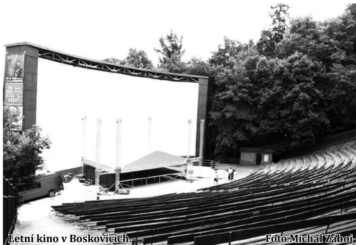
Letní kino v Boskovicích.

„Na přelomu roků 2017 a 2018 by mělo být budováno zázemí, zahrnující šatny, pokladnu, sociální zařízení