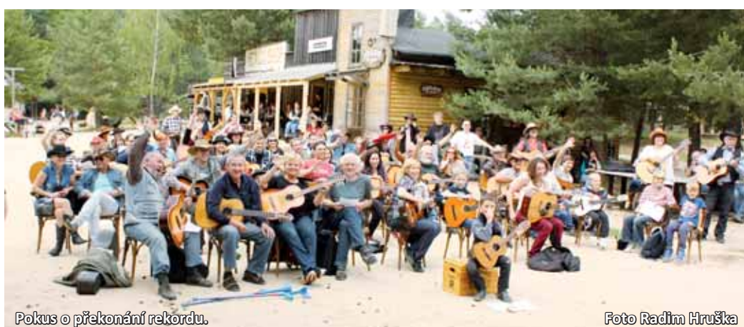
Pokus o překonání rekordu.

Cílem nadšenců ve westernovém městečku bylo překonat Portu, na které v roce 1997 zahrálo současně tři písničky dohromady