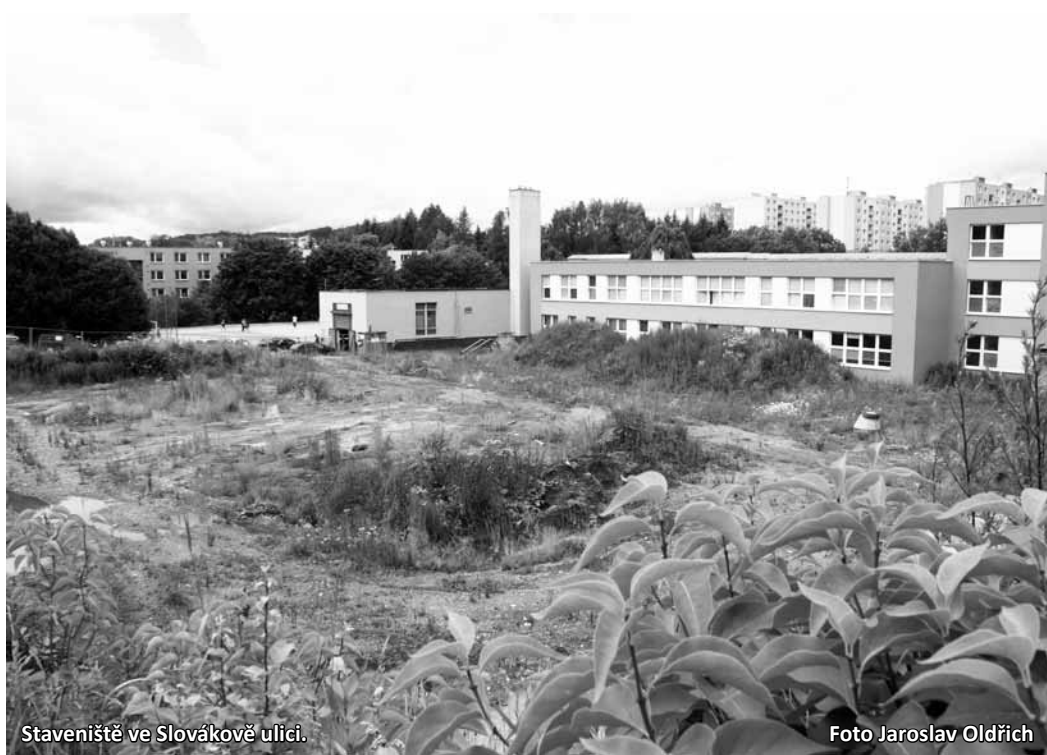
Staveniště ve Slovákově ulici.

Podle opozice však znamená zastavení stavby ve Slovákově ulici to, že sportovní hala v Boskovicích nevznikne minimálně dalších deset let. „Pro mladé lidi,