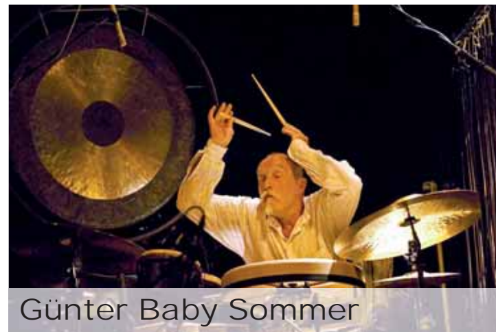
Günter Baby Sommer

Skutečně nasloucháme srdcem. A k tomu je třeba čas. Čas je největším bohatstvím, které Momo má, protože ví, že čas přebývá v srdci. Ale jsou tu Šedí