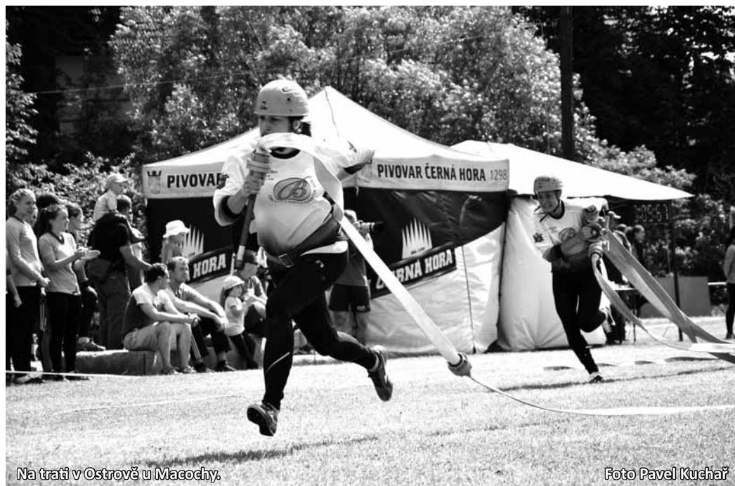
Na trati v Ostrově u Macochy.

Po krátké přestávce nutné ke zkrácení dráhy o dvacet metrů pro ženskou kategorii a k občerstvení