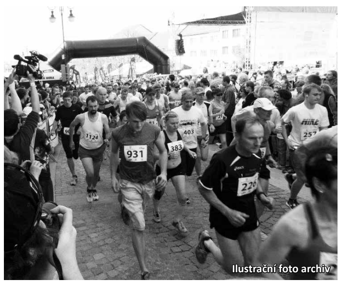
ilustrační foto archiv

Po dvouměsíčním intenzivním tréninku budou na programu kondiční výběhy. Účastníci si mohou vyzkoušet zaběhnout jednotlivé úseky hlavního závodu. Každý běžec už bude trať znát a bude vědět na co si dávat v hlavním