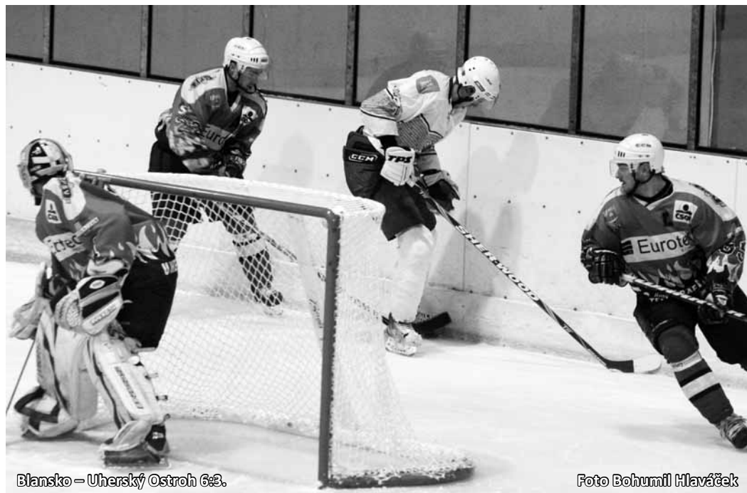
Blansko - Uherský Ostroh 6:3.

V sobotu se Dynamiters představili již v jiném světle. Vlétli do utkání jako vítr a neuběhly ani dvě minuty a bylo to již 2:0. Zaskočení hosté se nezmohli ve zbytku utkání na podstatnější odpor, obzvláště, když podobným razantním způsobem začala i druhá třetina, v jejímž úvodu domácí znovu dvakrát skórovali. O osudu zápasu bylo definitivně rozhodnuto. Uherský Ostroh pak sice srovnal hru, branky však přibývaly na obou stranách. Boskovice v neděli dovedly