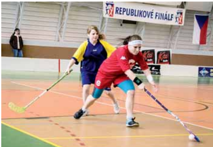
Středoškolský šampionát. Hala SPŠ Jedovnice hostila republikové finále středních škol ve florbalu.