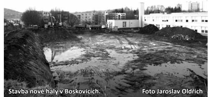
Stavba nové haly v Boskovicích.

Přeji jim zdraví, to je nejdůležitější, navíc hodně pokoje a ohleduplnosti. K tomu, abychom spokojeně žili, patří také určitá dávka štěstí, dobré rodinné zázemí, a aby lidé měli práci.