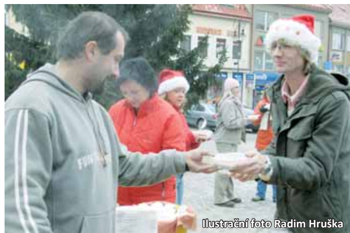
Ilustrační foto Radim Hruška

Kromě polévky si budou moci lidé odnést domů i duchovní symbol Vánoc v podobě světla z Betléma, které přivezou členové místního skautského oddílu Nibowaka. „Spolupráce se osvědčila, o betlémské světlo je každý rok velký zájem, a tak skauti přijedou letos už podesáté. Letos se bude polévka opět rozdávat i v Letovicích, druhém největším městě regionu, akce stejného formátu jako v Boskovicích se tam uskuteční už po-