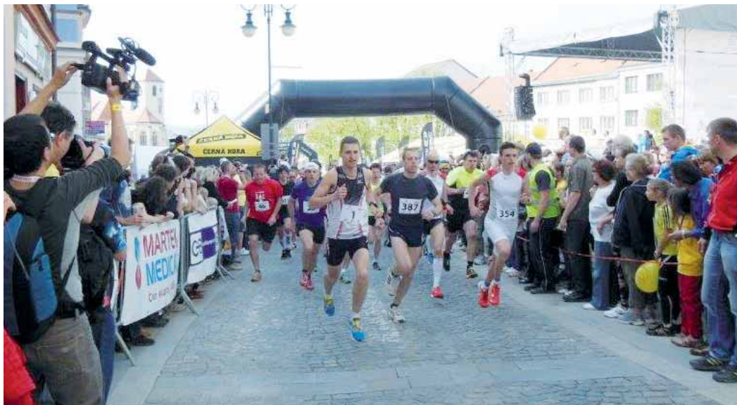
Boskovické běhy. Prvomájová sportovně společenská akce se stala v boskovickém kalendáři již tradicí.