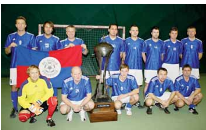
Sokol BK Sadros Boskovice. Tým obhájil loňský titul v první okresní lize v malé kopané a současně se probjoval do republikového finále.