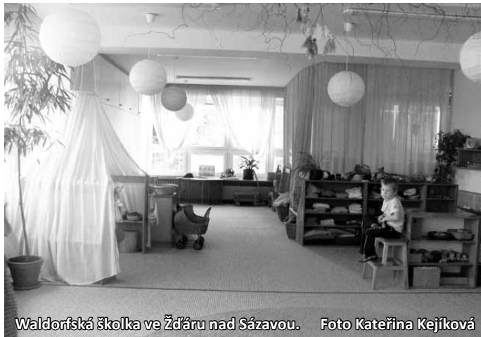
Waldorfská školka ve Žďáru nad Sázavou.

Za projektem stojí Waldorfská iniciativa Boskovice, která vznikla na jaře letošního roku. „Na začátku bylo to, že jsme chtěli trochu jiný přístup pro naše dítě až nastoupí do školky. Hledali jsme proto v Boskovicích a blízkém okolí a nic nenášli. Náhoda tomu chtěla, že jsme potkali jednu naši známou, která vozila děti do waldorfské školky do Brna. Začali jsme si o tom povídat a dostali se k lidem v Boskovicích, kteří o tuto formu školky měli zájem. Vozit děti do Brna je pro řadu rodičů nereálné, proto jsme se rozhodli vytvořit waldorfskou školku přímo v Boskovicích,“ uvedla Kateřina