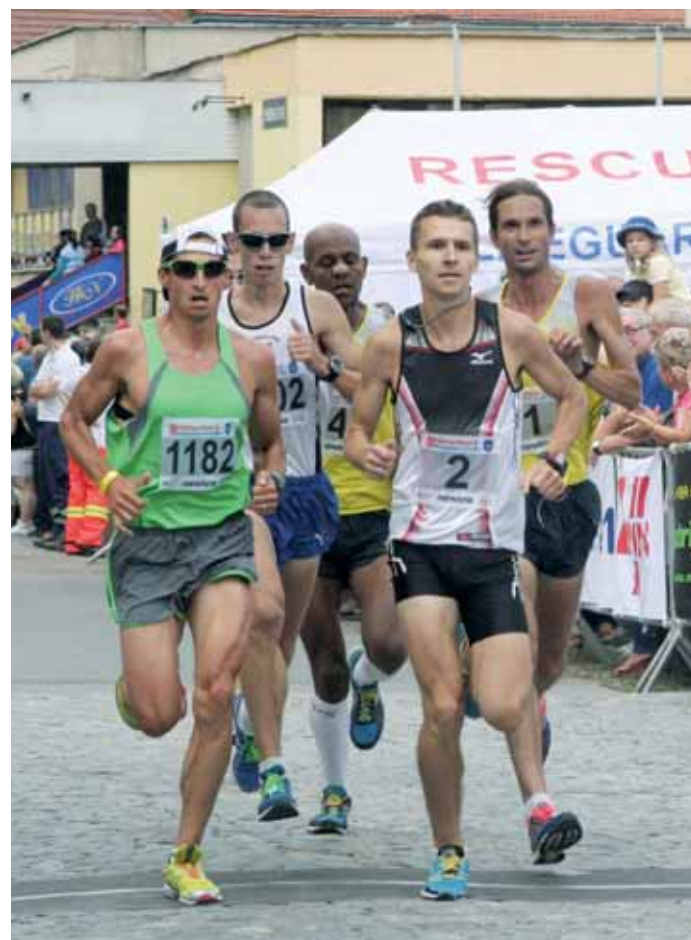
Půlmaraton Moravským krasem. Rekordní účast na běhu zařadila závod k nejvýznamnějším v republice.