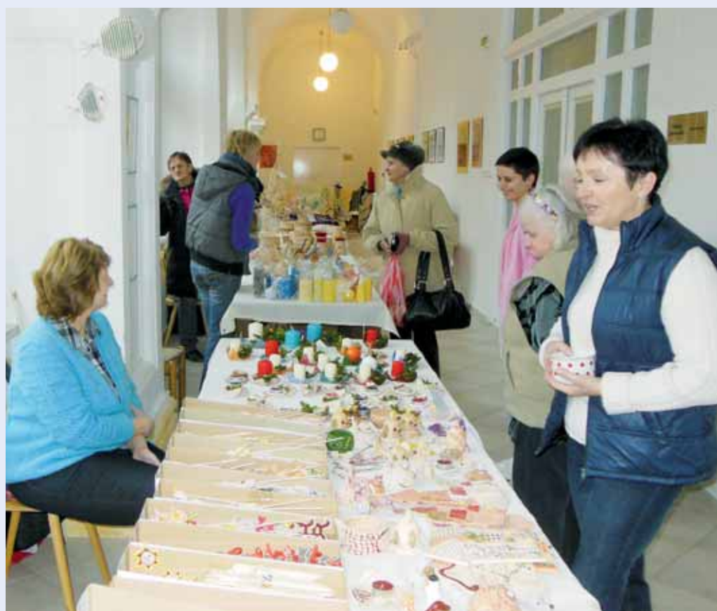
Tradice. Uplynulou sobotu se v Sociálních službách Šebetov konal tradiční Vánoční jarmark. Přichodí si mohli zakoupit výrobky klientů zařízení.