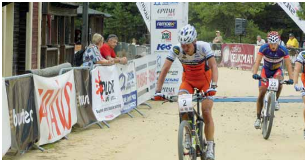
Republikový závod. Závod seriálu Českého poháru horských kol se konal v areálu a okolí boskovického westernového městečka.