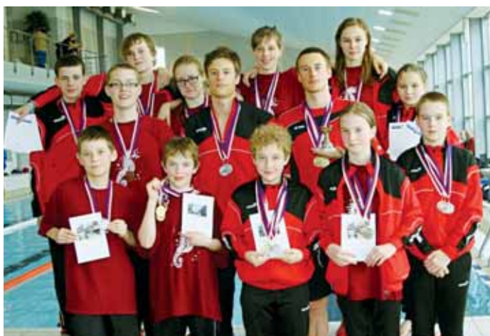
Skvělá práce s mládeží. Závodníci ASK Blansko sbírají medaile na plaveckých závodech po celé republice.