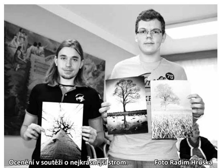
Ocenění v soutěži o nejkrásnější strom.

„Z vítězství mám radost a věřím, že aleji pomůže. Jedovnicí alej jsme do soutěže přihlásili proto, abychom na tuto významnou krajinnou dominantu upozornili a pokusili se získat peníze na její obnovu. Na vítězství se určitě významnou měrou podíleli i žáci základní školy v Jedovnicích a studenti místní průmyslovky. Alej před třemi lety poničila vich-