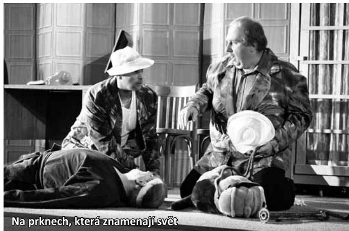
Na prknech, která znamenají svět