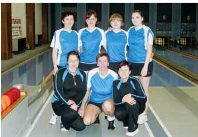
Stříbro. Kuželkářky Blanska obsadily v konečné tabulce první ligy vynikající druhé místo.