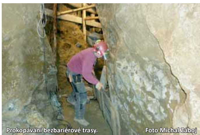
Prokopávání bezbariérové trasy. Foto Michal Zábaj

Některé chodby stačí pouze rozšířit. V jednom místě ale jeskyňáři