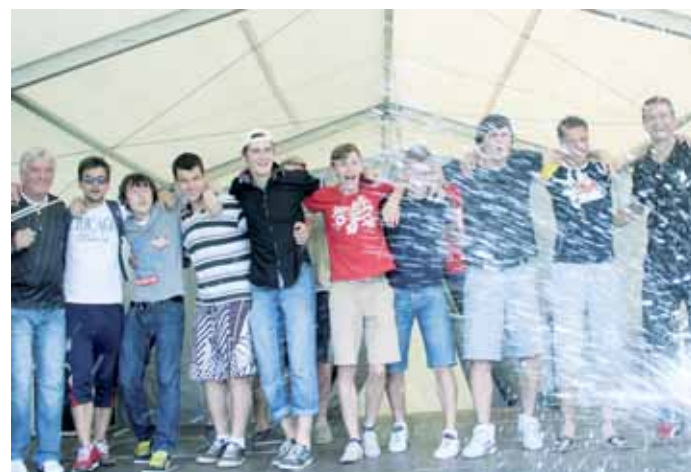
Postup. Blanensští fotbalisté vyhráli krajský přebor a postoupili zpátky do divize.