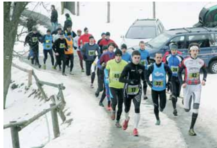
Okresní běžecká liga. Seriál závodů na našem okrese má stále se zvyšující popularitu.