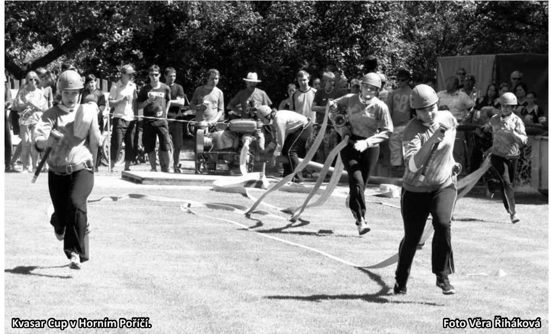
Kvasar Cup v Horním Poříčí.

Přední příčky v kategorii mužů letos vypadají poměrně monotónně. Největší porce bodů si pravidelně rozdělují šestice družstev. Stejně tomu bylo i v Horním Poříčí. Šestou příčku obsadili muži z Hlubokého (TR), kteří před nedělní soutěží vedli seriál Kvasar Cupu společně s muži ze Sychotína. Pátou příčku ukořistili loňští vicemistři z Maršovic. Časy padaly opravdu špičkové, o čemž svědčí i bramborová příčka pro muže ze Stražiska (PV) s časem 17,83 s. Bronzová pozice za čas 17,74 s stačila na osamostatnění mužů ze Sychotína ve vedení Kvasar Cupu. Parádní útok před domácím publikem předvedli muži z Horního Poříčí. S časem 17,46 s se dokonce mohli chvíli radovat z bonusu za překonání rekordu drá-