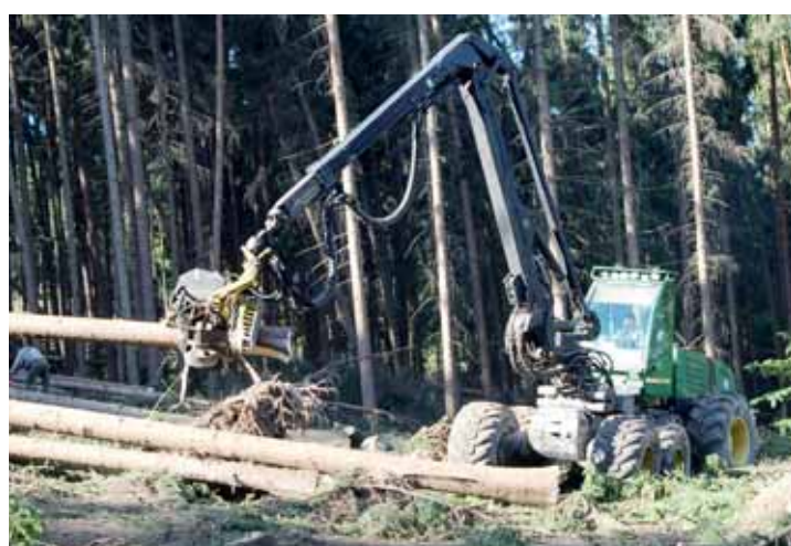
Pomocníci. Předností moderní techniky pomáhající při likvidaci lesní kalamity je rychlost a bezpečnost práce.

Křtiny - Rychle a s co nejmenšími ztrátami se snaží lesní hospodáři likvidovat následky nedávné bouře, která v lesích Moravského krasu způsobila značné škody. Nejde jen o boj s kůrovcem, ale vede je k tomu také snaha o udržení kvality vytěženého dříví. A tak do lesů nastoupila mimo jiné harvesterová technologie. Co je to harvester? Víceoperační stroj, který při těžbě dříví kácí, odvětvuje, rozřezává a ukládá strom v jednom cyklu. Vše je plně mechanizováno a automatizováno.