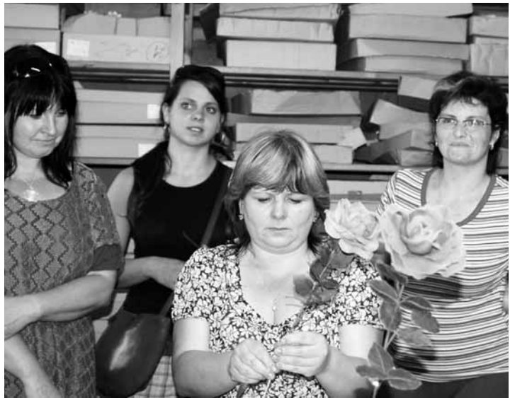
Růže. Především ženy oceňovaly zručnost pracovníků z Moraviafloru.