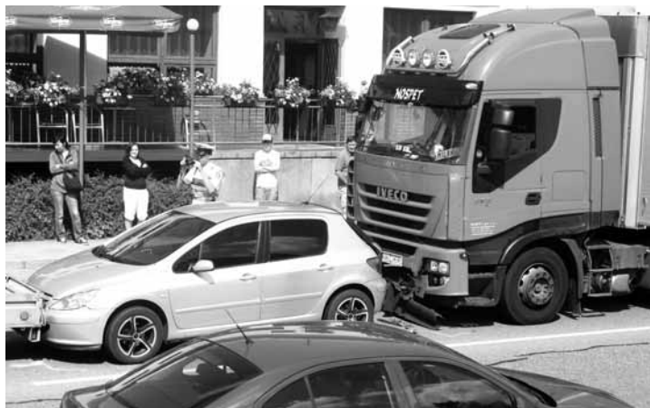
Havárie. Nehodu kamionu a dvou osobních automobilů vyšetřovali minulý týden ve čtvrtek policisté v Lipůvce.

Borotín - Část střešní krytiny rozebral zatím neznámý pachatel v Borotíně jen proto, aby se dostal do tamní zemědělské usedlosti. Na dvoře domu, který je už několik let neobývaný, pak ukradl motor ze sekačky a dva dvacetilitrové kanystry, z nichž jeden byl plný benzínu a druhý nafty. Dále si odnesl také větší množství nářadí. Celkem tak způsobil škodu za více než sedmáct tisíc korun. (hrr)