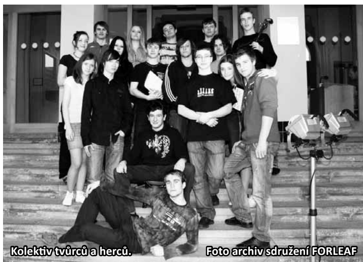
Kolektiv tvůrců a herců.

„Původně jsem měl představu, že vznikne dokument mapující život školy. Projektu se ujalo sdružení FORLEAF a naši studenti. Když mně přinesli scénář, byl to šok. Ve filmu jsem se měl totiž objevit i já, ale s kuklou na hlavě. Bylo to něco úplně jiného, než jsem čekal. Nakonec se mně to ale zalíbilo a já jsem kývl. Film jsem viděl poprvé až na jeho předpremiéře a musím říci, že jsem byl příjemně překvapený,“