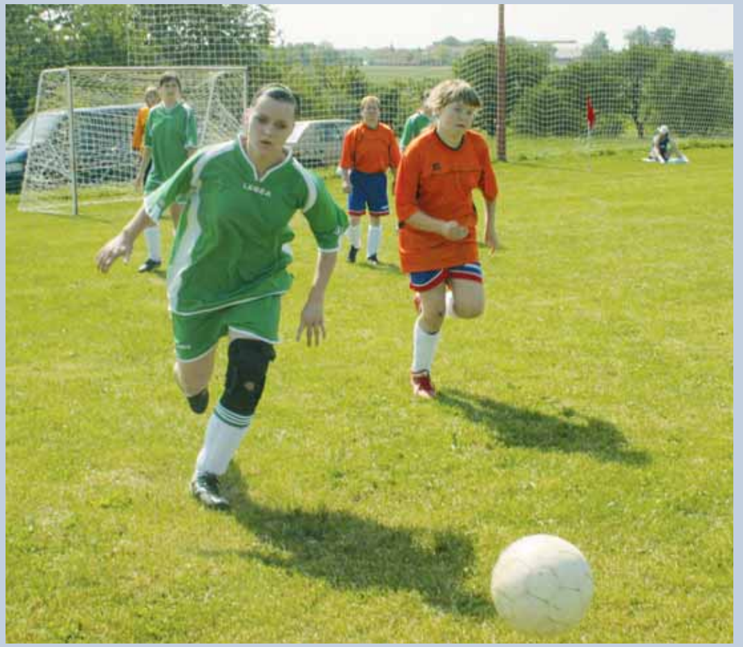
Hyundai Cup. Týden před hlavním vilémovickým mužským turnajem v malé kopané se utkali na čtyřech hřištích starší páni a ženy. Výsledky na str. 12