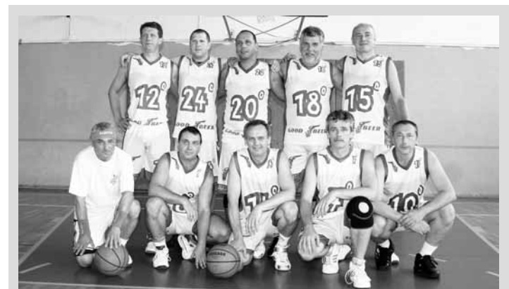
Veteráni. Na mezinárodním turnaji v basketbalu v domácí hale ASK obsadila blanenská stará garda třetí místo.