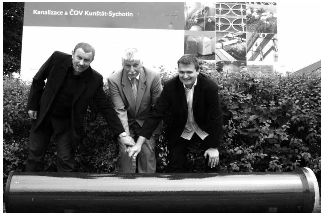
Start. Symbolickým poklepáním kanalizační roury odstartovala kunštátská radnice největší investiční akci ve svých dějinách.