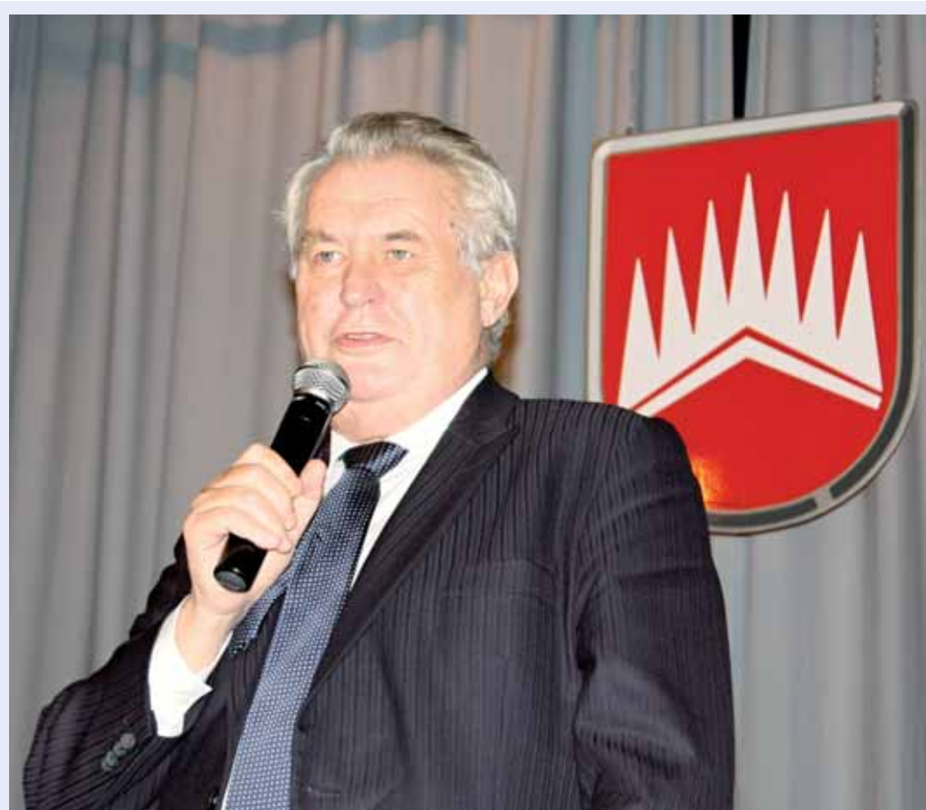
Návštěva. Do regionu přijel minulý týden prezident Miloš Zeman. Navštívil Černou Horu, Blansko a Boskovice. Více na straně 4. Rozsáhlá fotogalerie a videa na www.zrcadlo.net.

Pořádáte nevšední akci? Děje se u vás něco zajímavého? Volejte: 774 408 399 Pište: redakce@zrcadlo.net