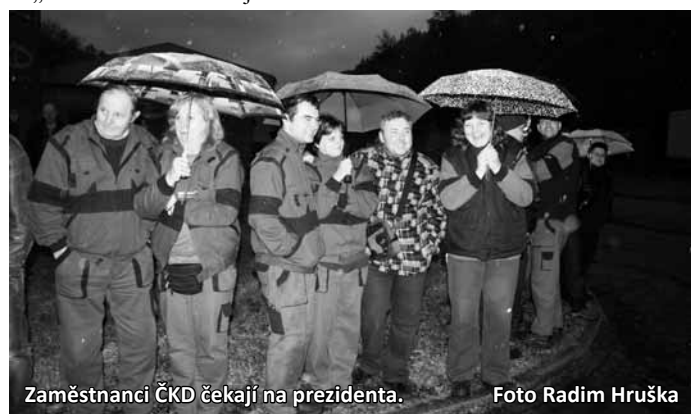
Zaměstnanci ČKD čekají na prezidenta.

Miloš Zeman se pak se zaplněným sálem blanenského kina rozloučil trojicí přání. Přítomným popřál pevné zdraví a šťastnou ruku při výběru vánočních dáreků. „A za třetí vám přeju životní pohodu. Nenechte se nikdy ničím a nikým otrávit a myslíte vlastní hlavou,” dodal prezident Miloš Zeman, který před půl sedmou odjel do Brna.