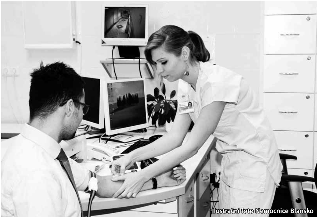
Ilustrační foto Nemocnice Blansko

mimo jiné vyhotovení anamnézy a klinického vyšetření erudovaným onkologem, EKG, vyšetření tlaku, odběry krve a moči, test stolice nebo rentgen plic, ultrazvuk břicha, prsou a kožní vyšetření. Cena balíčku bude čtyři a půl tisíce korun.