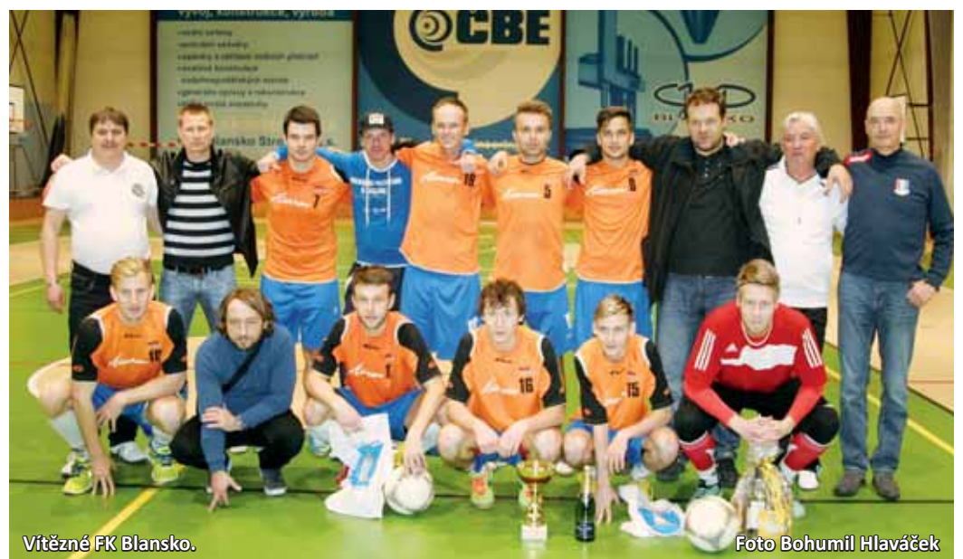
Vítězné FK Blansko.