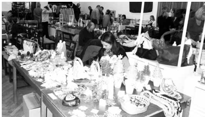
Jarmark. Jedovnický kulturní dům hostil v sobotu již dvaadvacátý knižní jarmark a jedenáctý ročník veletrhu produktů z Moravského krasu. Na místo se sjeli prodejci z našeho i sousedních okresů, přijelo jich kolem třiceti.

Do plánu zimní údržby v okrese Blansko je zařazeno přes 590 kilometrů silnic druhých a třetích tříd a dalších padesát kilometrů silnic prvních tříd. Dvanáct kilometrů silnic většinou krajských komunikací třetích tříd se v zimě vůbec neudržuje. O další desítky kilometrů obecních silnic se starají města a obce. (moj)