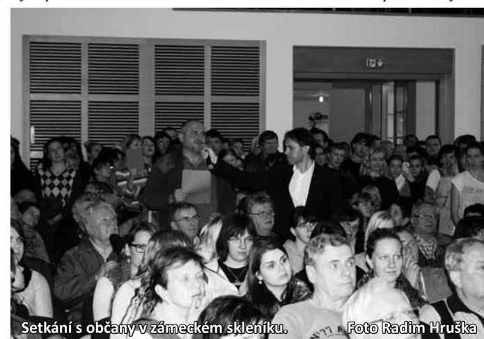
Setkání s občany v zámeckém skleníku.