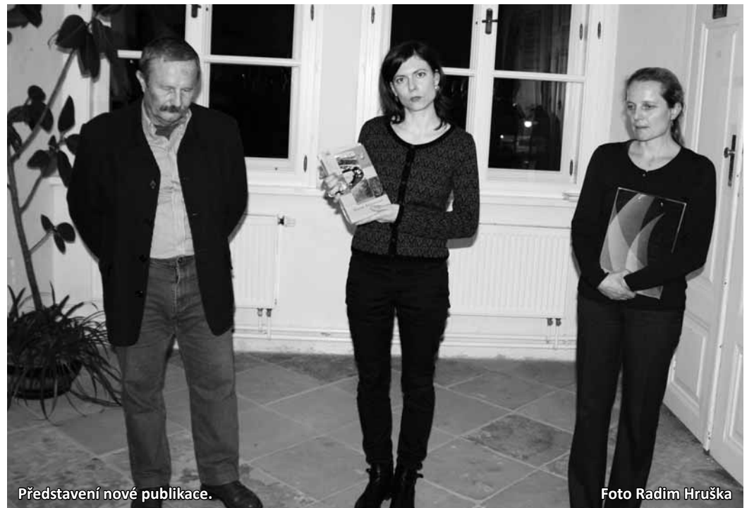
Představení nové publikace.

„Jedná se již o třetí díl vlastivědy, předcházející, zabývající se přírodou a lidovou kulturou a nářečím na Boskovicku, vyšly v roce 2008 a 2009. Kvůli finančním problémům se třetí díl vydává s větším odstupem až letos. Dalším plánem redakční rady Vlastivědy