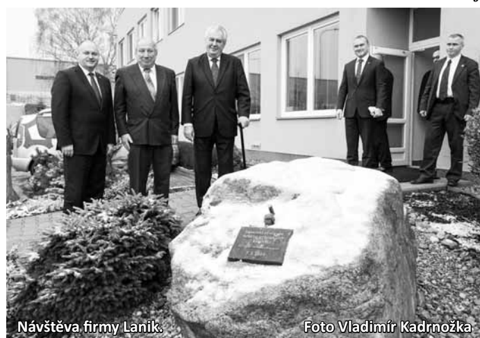
Návštěva firmy Lanik.