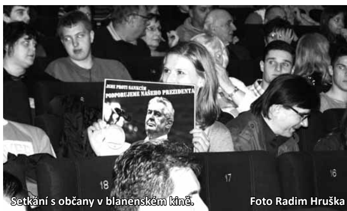
Setkání s občany v blanenském kině.