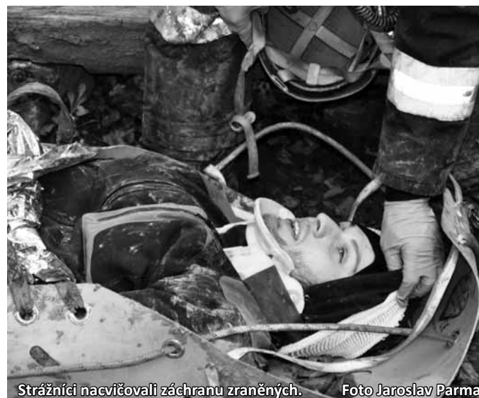
Strážníci nacvičovali záchranu zraněných.

„Vzhledem k obtížnosti terénu byla následně na místo povolána jednotka hasičů z Boskovic. Záchranáři z městské policie zatím připravili místo záchranu a spustili se do jeskyně, kde pátrali po