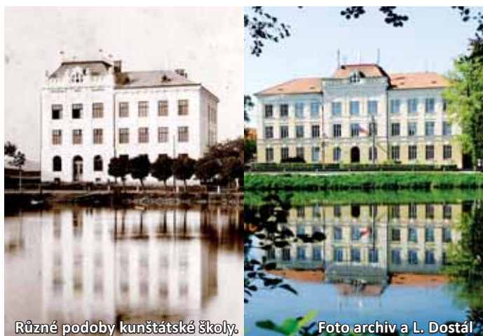
Různé podoby kunštátské školy.