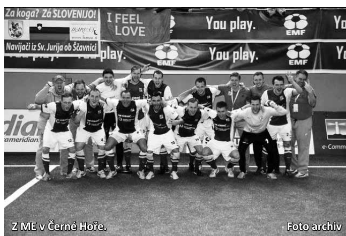
Z ME v Černé Hoře.

Velkou zásluhu na tom mělo, že jsme hráli ve Final Four republiky v malé kopané, které jsme se Sadrosem Boskovicem vyhráli a všimli si nás trenéři. Pozvali nás na kemp, kde bylo 24 hráčů a všichni tři jsme se dostali do užšího výběru pro Černou Horu. Každopádně to potvrdilo úroveň malé kopané na našem okresu.