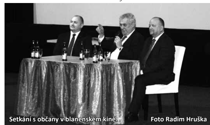
Setkání s občany v blanenském kině.