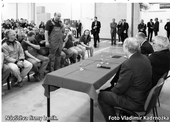
Návštěva firmy Lanik.