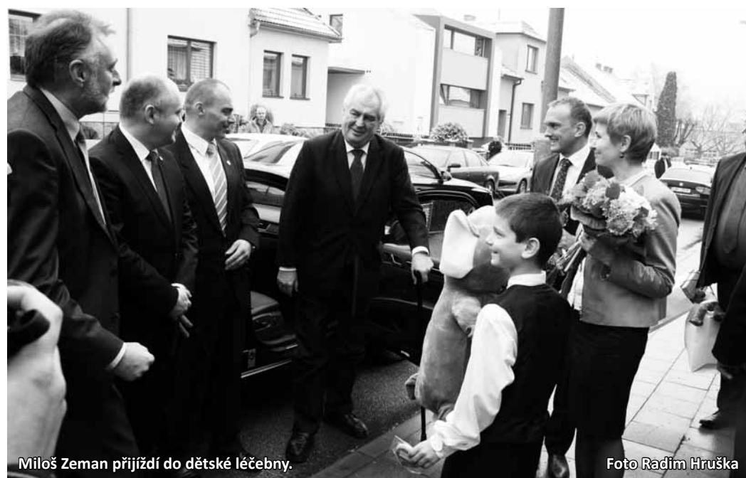
Miloš Zeman přijíždí do dětské léčebny.

Miloš Zeman v Boskovicích ještě navštívil firmu Lanik, kde pochválil vedení společnosti, kterou vidí jako perspektivní. „Ve firmě, kde pracuje asi 250 lidí, je průměrná mzda 28 tisíc korun, což je o čtyři tisíce více než je průměrná mzda v Jihomoravském