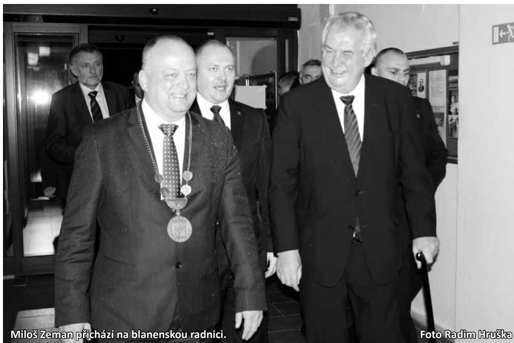
Miloš Zeman přichází na blanenskou radnici.