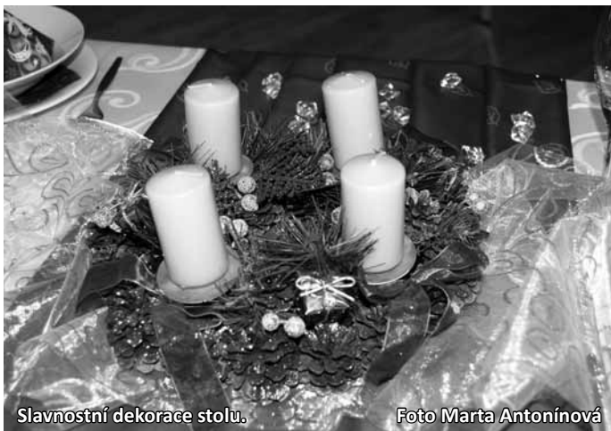
Slavnostní dekorace stolu.

Dětem i dospělým se líbili dílničky, workshopy i prodejní část výstavy, které připravilo KSMB, návštěvníci si mohli prohlédnout výstavu obrazů Věry Kocmano-