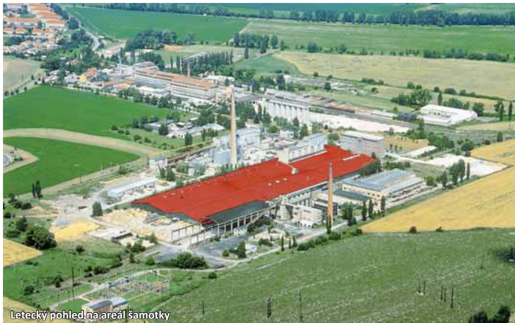
Letecký pohled na areál šamotky

V poli Werner pan Meisel založil a do dvou let vyrazil stolu, která ote-