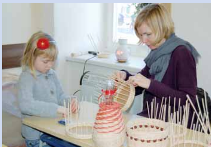
Křtiny. Na křtinském jarmarku to vonělo, nejen cukrovím, medovinou, ale také zabičáčkou. Co všechno umí šikovné ruce, to předvedly například korálkářky, návštěvníci jarmarku také sledovaly jak vzniká paličková krajka. Kdo chtěl, mohl si zkusit vyrobit košík nebo ošatku. Zájem byl velký. * Lipovec. Vánoční dekorace, nápady na dárky a mnoho dalšího nabízel tradiční jarmark v Lipovci. Svou zručnost předváděly korálkářky nebo třeba košíkář. Někteří návštěvníci si na letošní stromeček pověsí i baňku se jménem.