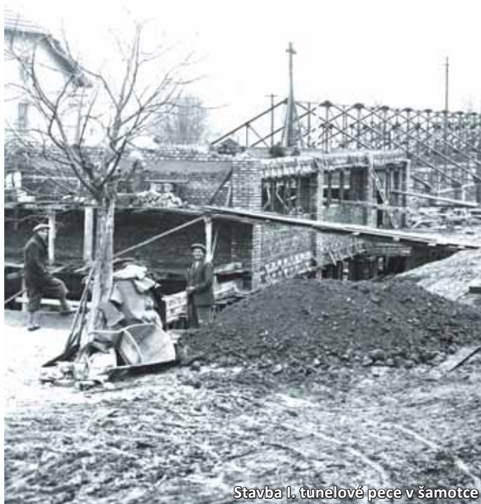
Stavba l. tunelové pece v šamotce

Výpal lupků probíhá pouze na šachtových pecích na Anně, značná pozornost je věnována výsledné kvalitě pálených lupků, která je rozhodující pro kvalitu finálních výrobků - šamotových kamenů. Dostavily se i úspěchy obchodního rázu, ty se pozitivně promítaly do ekonomiky a finanční oblasti. Nebyvale stoupla prestiž firmy mezi odběrateli i v celém oboru žárovýroby.