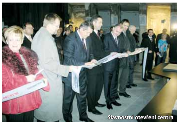
Slavnostní otevření centra