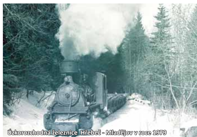
Úzkorozchodná železnice Hřebčích - Mladějov v roce 1979

složité zabývat se otázkami dalšího rozvoje. Těžkou situací ještě znásobil požár, který vypukl 19. listopadu 1919, trval 3 dny a zničil celou továrnu, kromě kotelny a obytné budovy. Tato pohroma však paradoxně vyřešila předchozí dilema, jakým směrem orientovat budoucnost šamotky. Již v roce 1921 byla továrna znovuobnovena po stavební stránce do své původní podoby. Převratnou změnou byla následná elektrifikace,