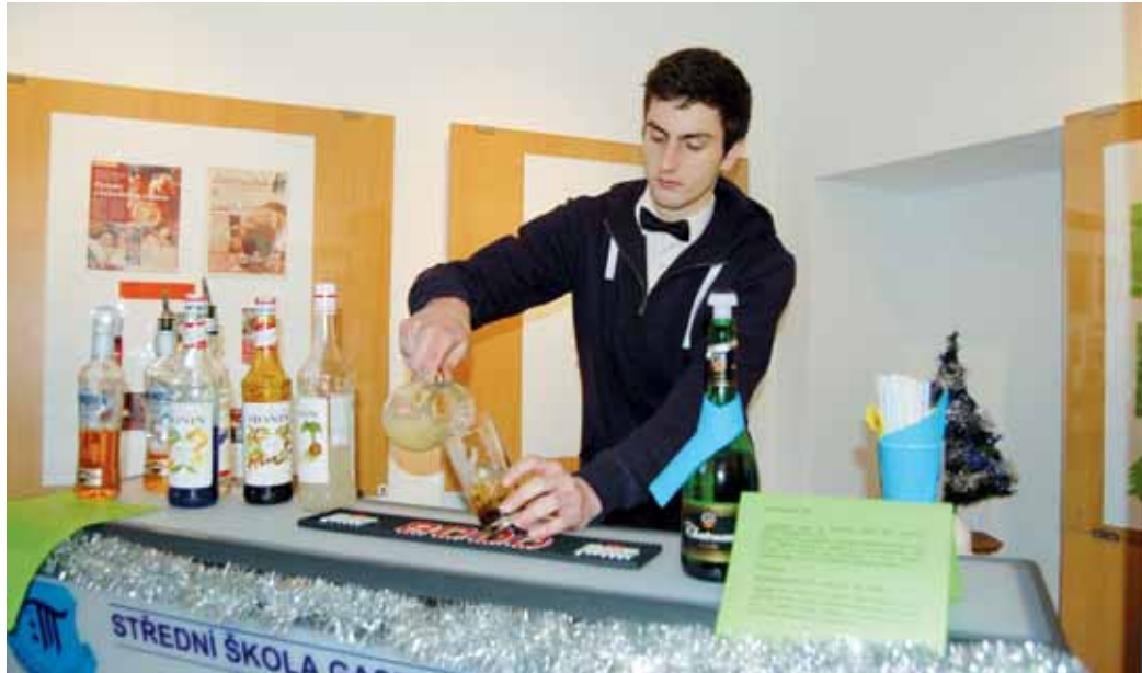
Ochutnávka. Moderní míchané nápoje, ale i staročeské vánoční jídlo jste mohli ochutnat v blanenském zámku.

Zatímco děti upoutala například strašidelná Perchta, která dříve často dělala společnost čertu, Mi-