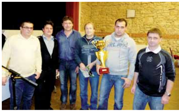
Valná hromada Malé kopané okresu Blansko v sobotu vyhlásila i vítěze jednotlivých divizí. Pohár pro vítěze 1. ligy převzali hráči Sokola BK SADROS Boskovice.