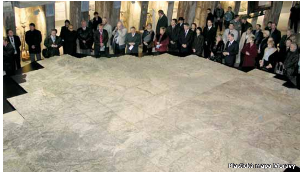
Plastická mapa Moravy