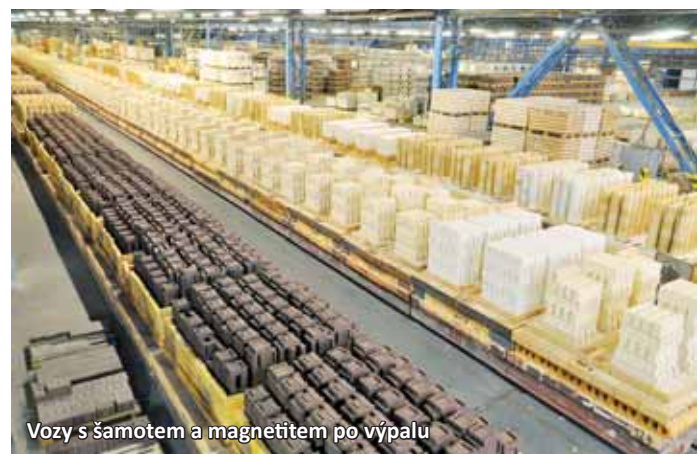
Vozy s šamotem a magnetitem po výpalu